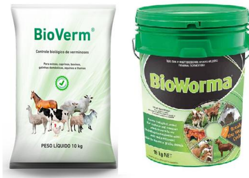
Figure 2 - Commercial formulations containing D. flagrans : BioVerm® (Brazil) and BioWorma® (Australia).