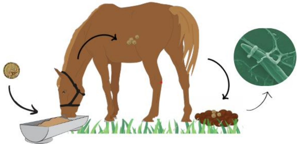
Figure 1 - Dynamics of helminth control in horses using helminthophagous fungi.

It is through the oral administration of these fungal isolates in animal feed that the so-called ‘classical biological control’ takes place, a term that can refer to the flooding of these biological agents into the soil [52]. In the fecal pat, the development of these fungi are stimulated by contact with an increasing number of free-living larvae. With colonization, the chlamydospores establish themselves in the pasture, with subsequent ingestion of the pasture by the animals [78]. The parasite burden present in the pasture (the non-parasitic phase of the helminths) represents around 95 per cent of the total parasite population. As such, almost all of this load is found in the environment and fungi therefore act in the most important place for control, reducing the number of third-stage larvae in pastures and, consequently, reducing the infection rate [79,80].