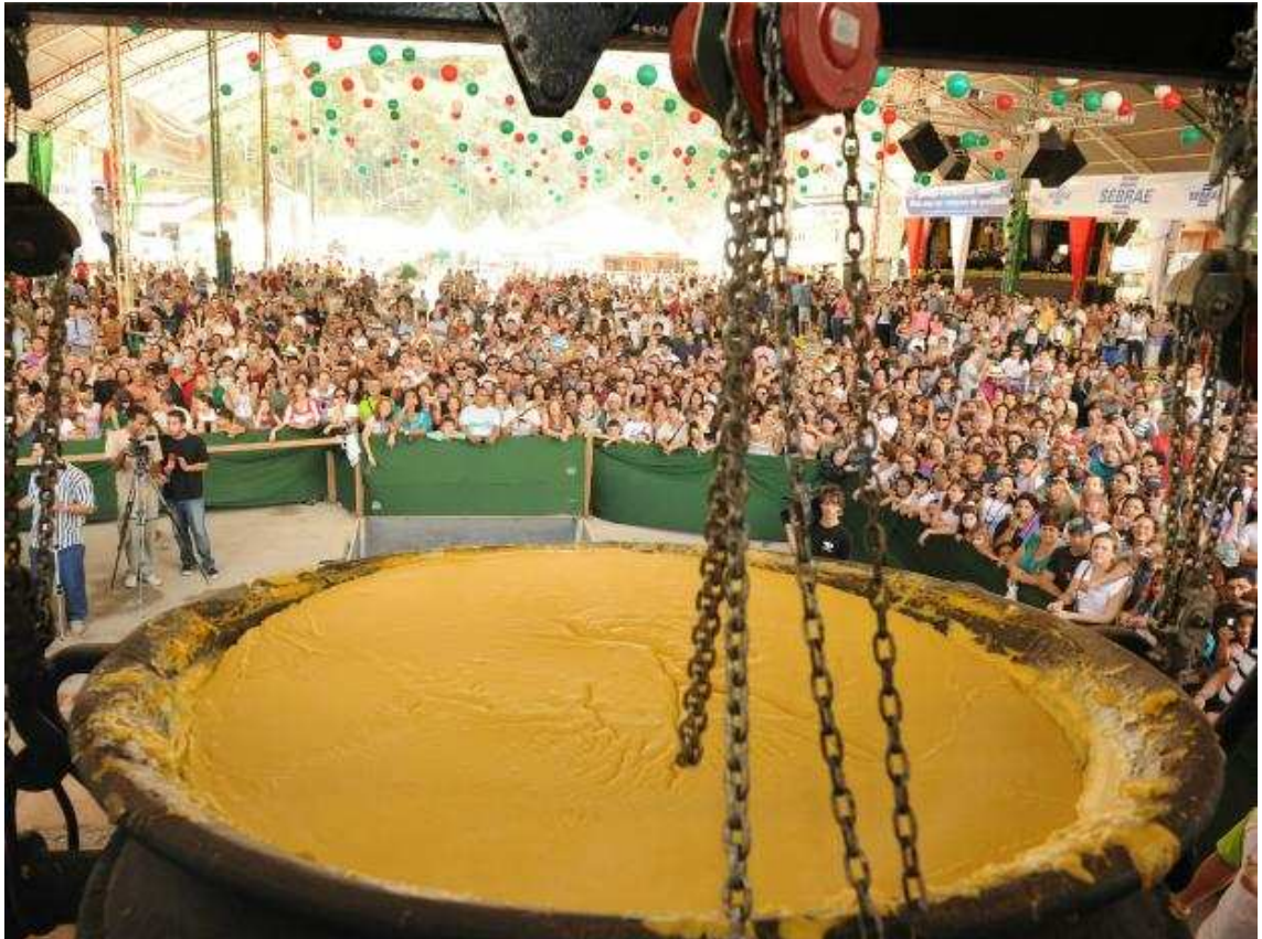
Figura 5 - Iniciando o tombo da polenta durante a Festa da Polenta em Venda Nova do Imigrante.