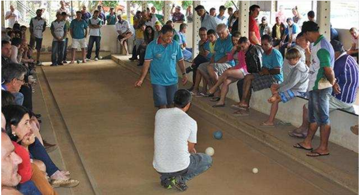
Figura 9 - Jogo de abertura do Campeonato de Bocha de Venda Nova do Imigrante de 2017.