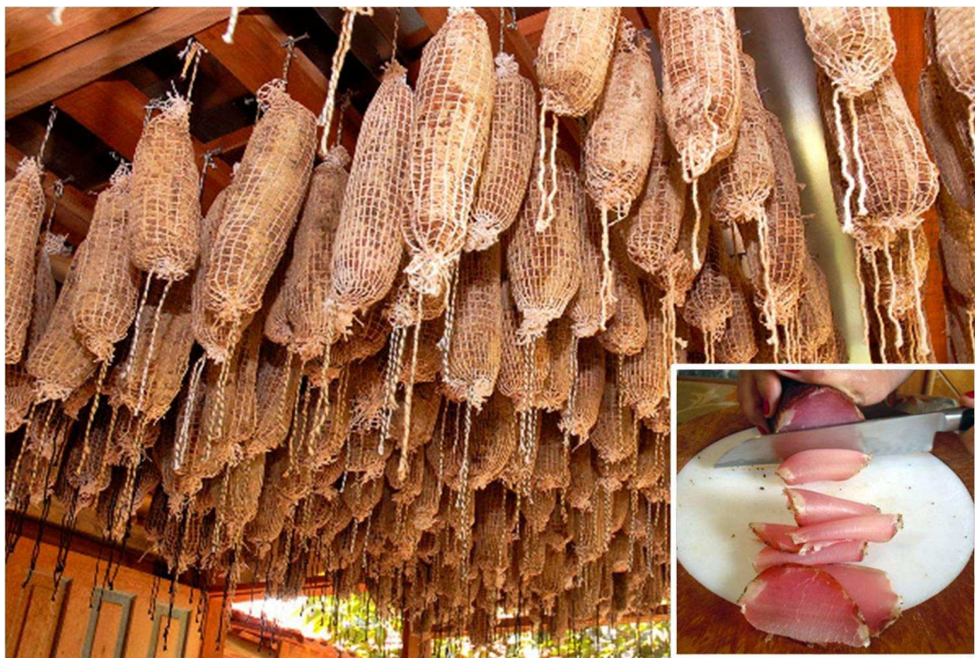
Figura 8 - Procedimento da cura na fabricação do socol (no detalhe o socol fatiado).