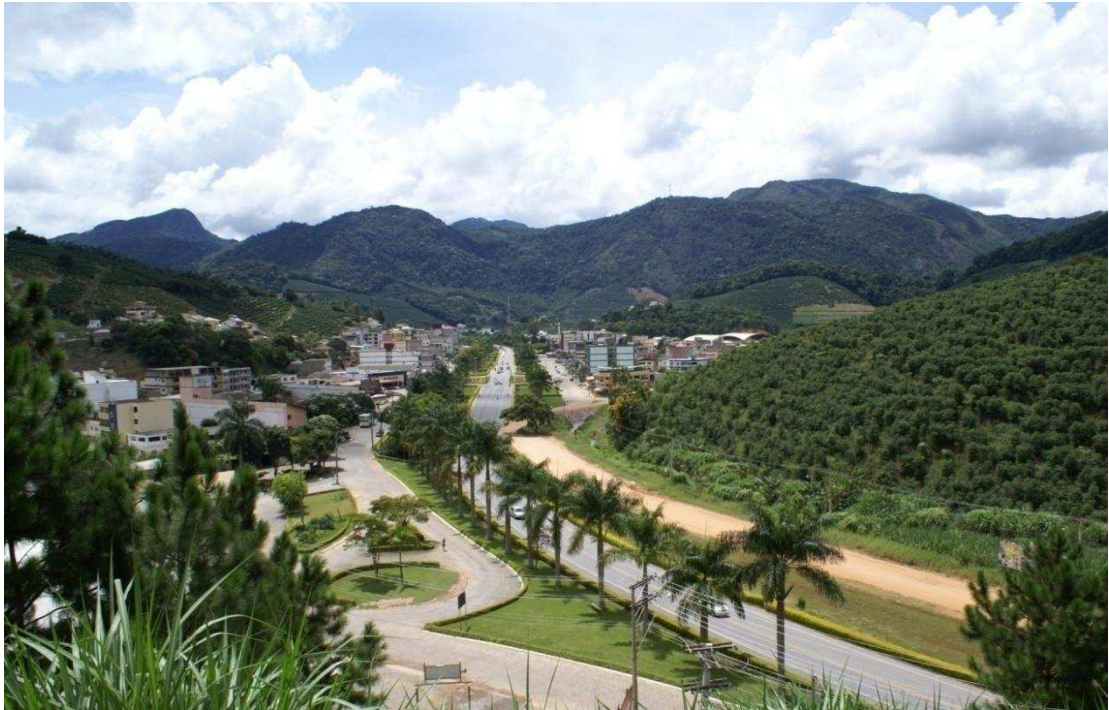
Figura 4 - Vista parcial de Venda Nova do Imigrante-ES.