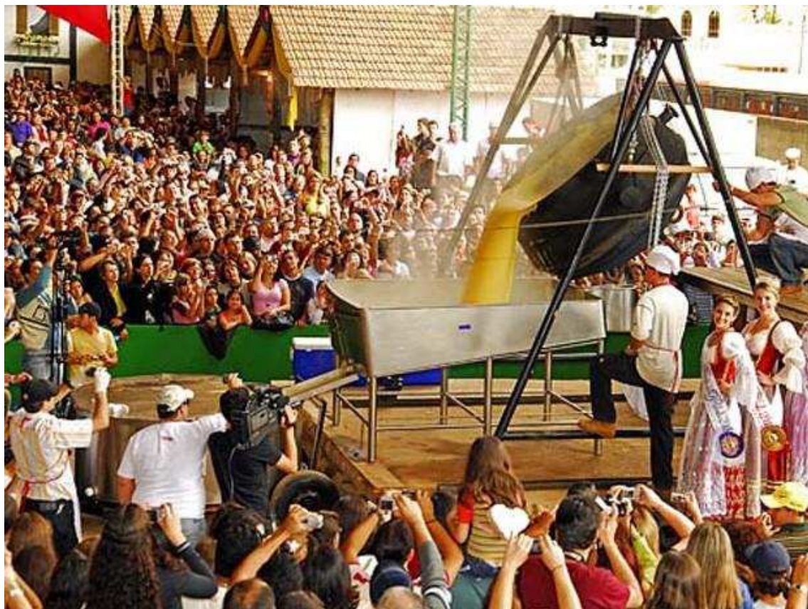
Figura 6 - Tombo da polenta durante a Festa da Polenta em Venda Nova do Imigrante.