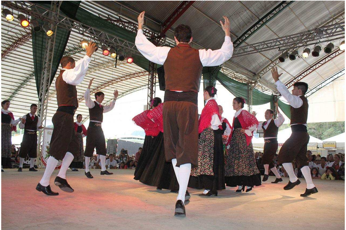
Figura 7 - Apresentação de dança tradicionalmente italiana.