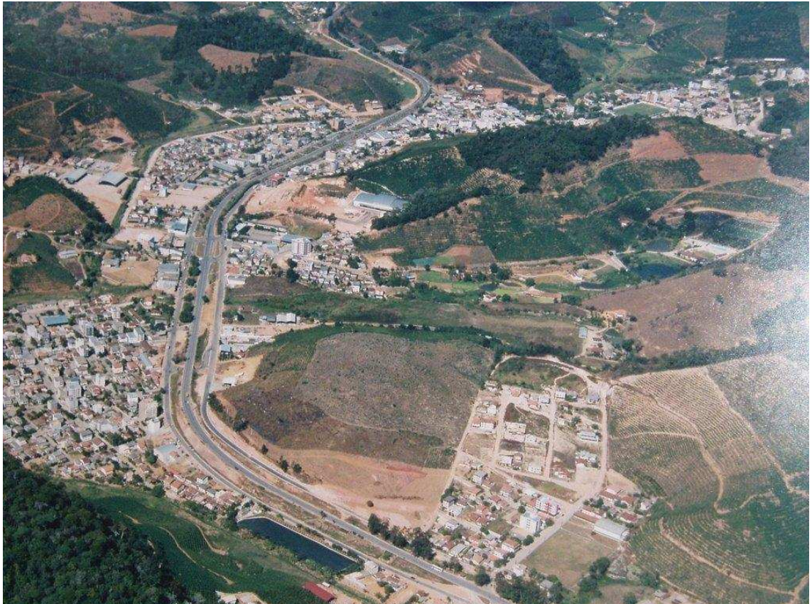
Figura 3 - Vista panorâmica de Venda Nova do Imigrante-ES.