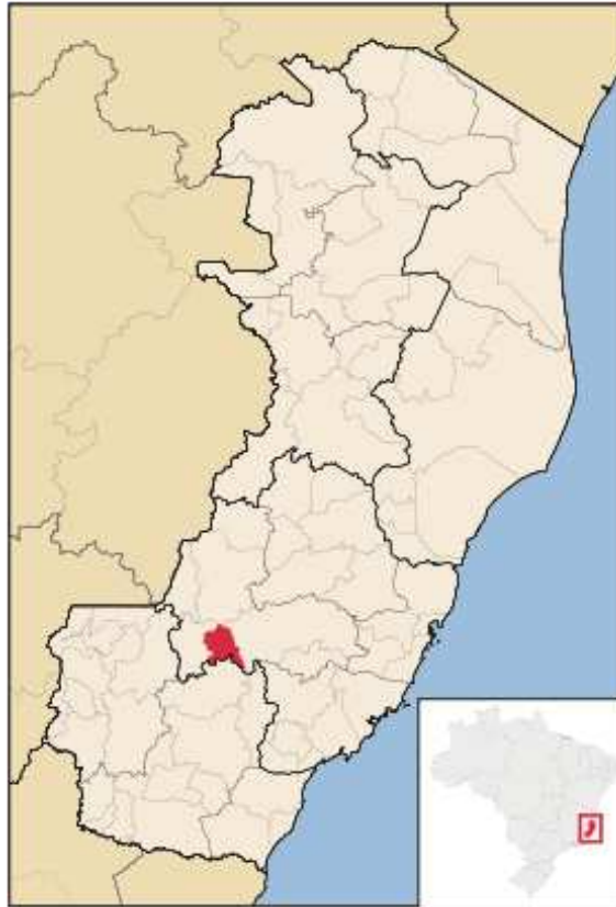
Figura 2 - Localização de Venda Nova do Imigrante no Espírito Santo.