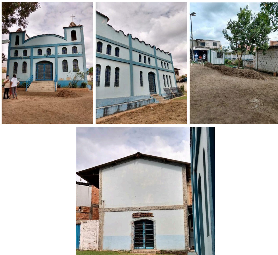
Figura 2 - Igreja Nossa Senhora do Rosário