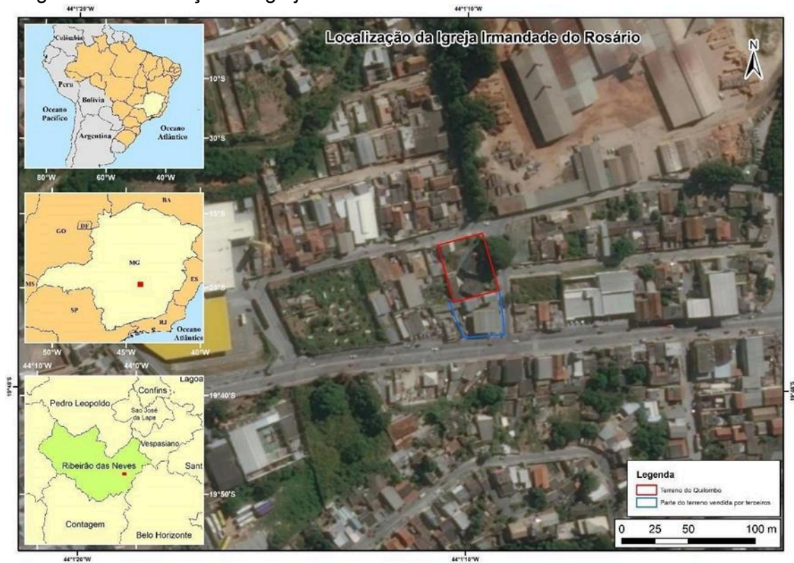
Figura 1 – Localização da Igreja Irmandade do Rosário

Organização: ASSIS, Neuman Otávio Freitas (2021).