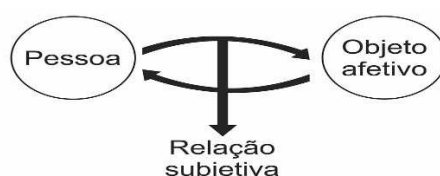
Figura 1: Esquema da investigação central do estudo

Assim, como esta pesquisa buscou investigar elementos subjetivos contidos no cotidiano das idosas institucionalizados, tornou-se relevante observar a maneira como as idosas se relacionavam com a equipe de cuidadores, com os visitantes, com os pares, ou consigo mesmas; como desfrutavam da intimidade na ILP; a forma como se disponibilizaram para participar do estudo e, ainda, como apresentaram o seu repertório vocal, através da oralidade, do silêncio, dos gestos e ações durante as entrevistas. Para que o indivíduo seja capaz de acessar os momentos com os quais já se identificou ou se identifica, a memória torna-se fator fundamental, já que é por meio das reminiscências e lembranças que se revive ou vive um momento ou sensação.