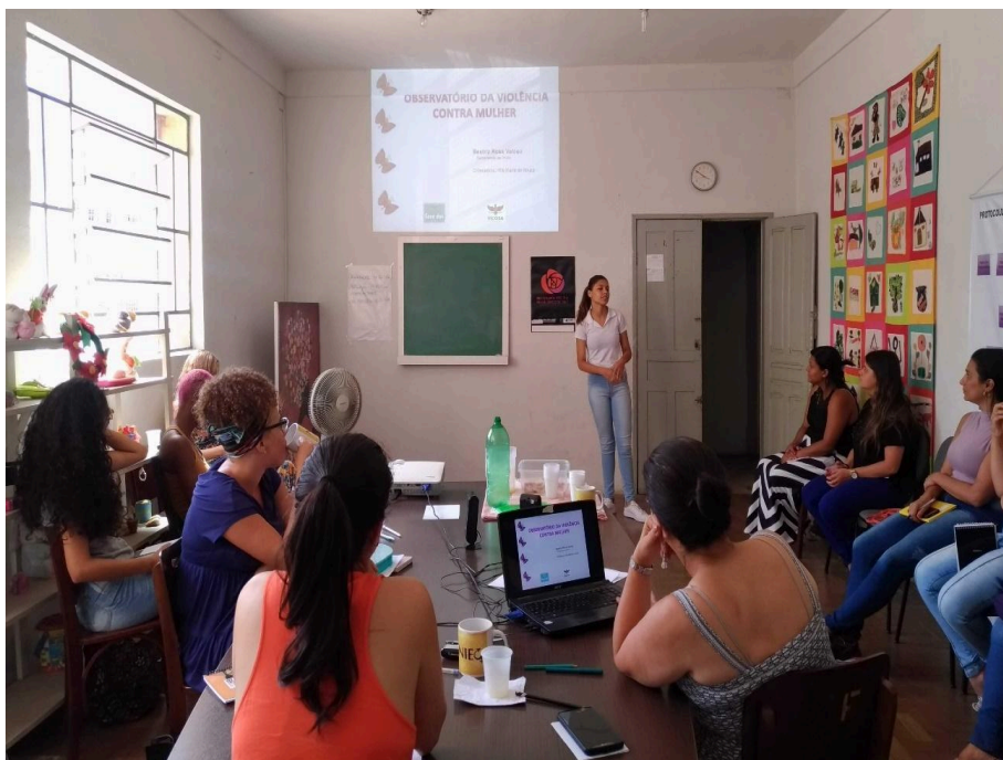
Figura 3 - Treinamento da Equipe do Programa Casa das Mulheres

Fonte: http://programacasadasmulheres.blogspot.com/ . Acesso em: 17 de fev. 2022