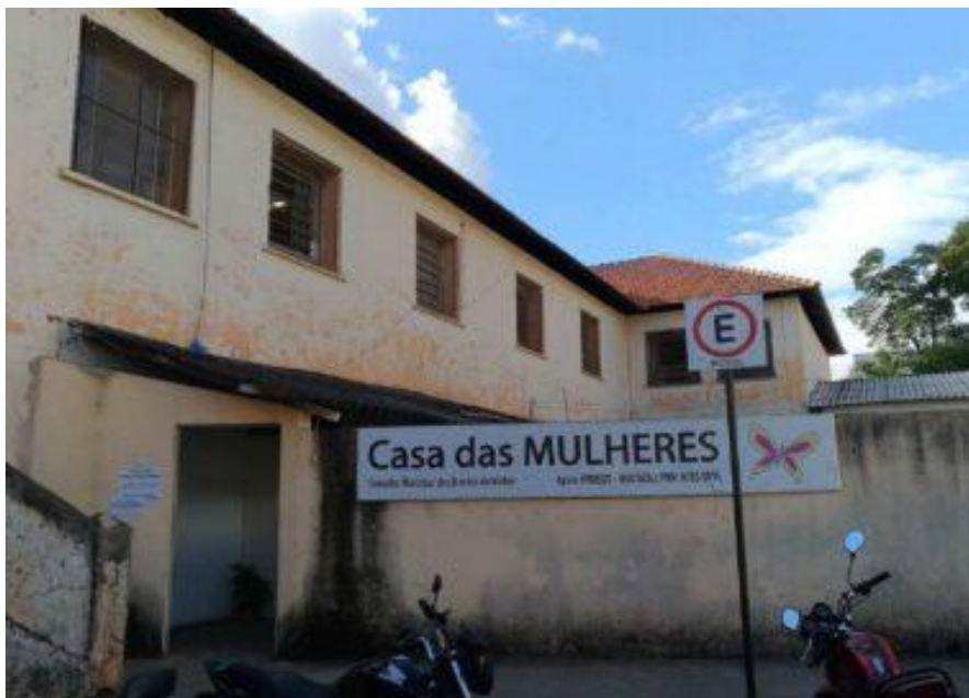
Figura 2 - Fachada do Programa Casa das Mulheres em Viçosa – MG