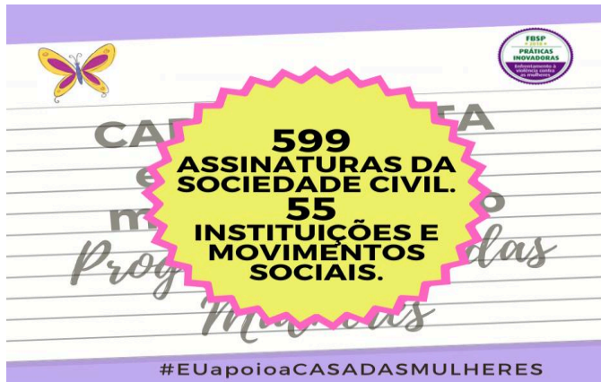
Figura 5 - Carta Aberta em Apoio a Casa das Mulheres