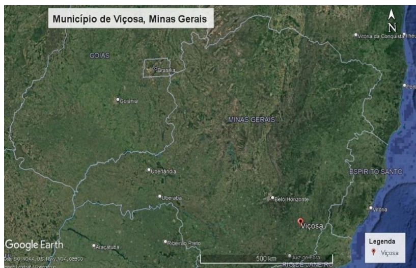
Figura 1 - Mapa da localização do Município de Viçosa, Minas Gerais