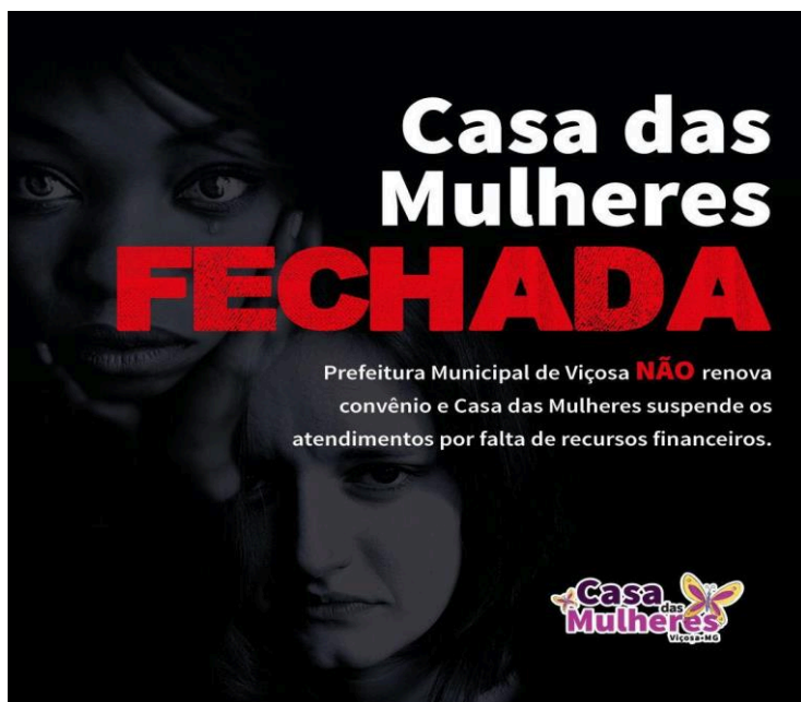
Figura 4 - Casa das Mulheres Fechada

Fonte: http://programacasadasmulheres.blogspot.com/ . Acesso em: 17 de fev. 2022