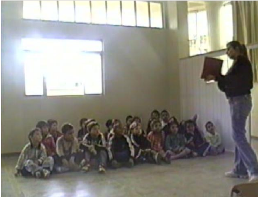
Figura 8 - A professora apresentando um dos cartazes utilizados para ilustrar a história à turma.

O fragmento 5, exposto anteriormente à Figura 8, nos mostra que o uso de um operador argumentativo, um dêitico, no caso o pronome “ esse ”, linha 71, ajuda a professora a direcionar o tópico da aula: a narrativa da história “O balãozinho teimoso”. Com o marcador linguístico expreso somado à exposição de um cartaz, conforme a Figura 8, com imagens da história, (é o balãozinho teimoso esse que tá< (1.5) pregado na cordinha ((mostrando a imagem aos alunos))) linhas 71 e 72, ela consegue voltar a atenção dos alunos para o cumprimento de uma ação integrante da atividade e controlar o tópico por ela “planejado” ( vamos ver o que aconteceu com os balõe zinhos :) ), linha 75. A presença de uma pausa maior, no meio da fala expressa na linha 72, em sua fala não proporciona um assalto a seu turno, e essa atitude das crianças se dá em função dos cartazes ilustrados apresentados por Márcia. Eles querem prestar atenção no momento em que ela os direciona para isso, linhas 71 e 72, (esse que tá< (1.5) pregado na cordinha ((mostrando a imagem aos alunos)). Silva (1999) argumenta que não só a escolha da história tem papel fundamental, mas também os materiais utilizados para tal finalidade. Ao inserir imagens