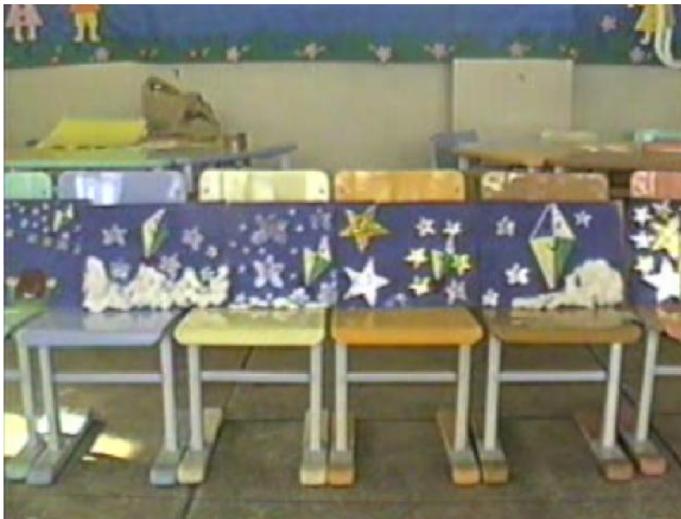
Figura 6 - Exposição do material usado para contar a história “O balãozinho teimoso”.