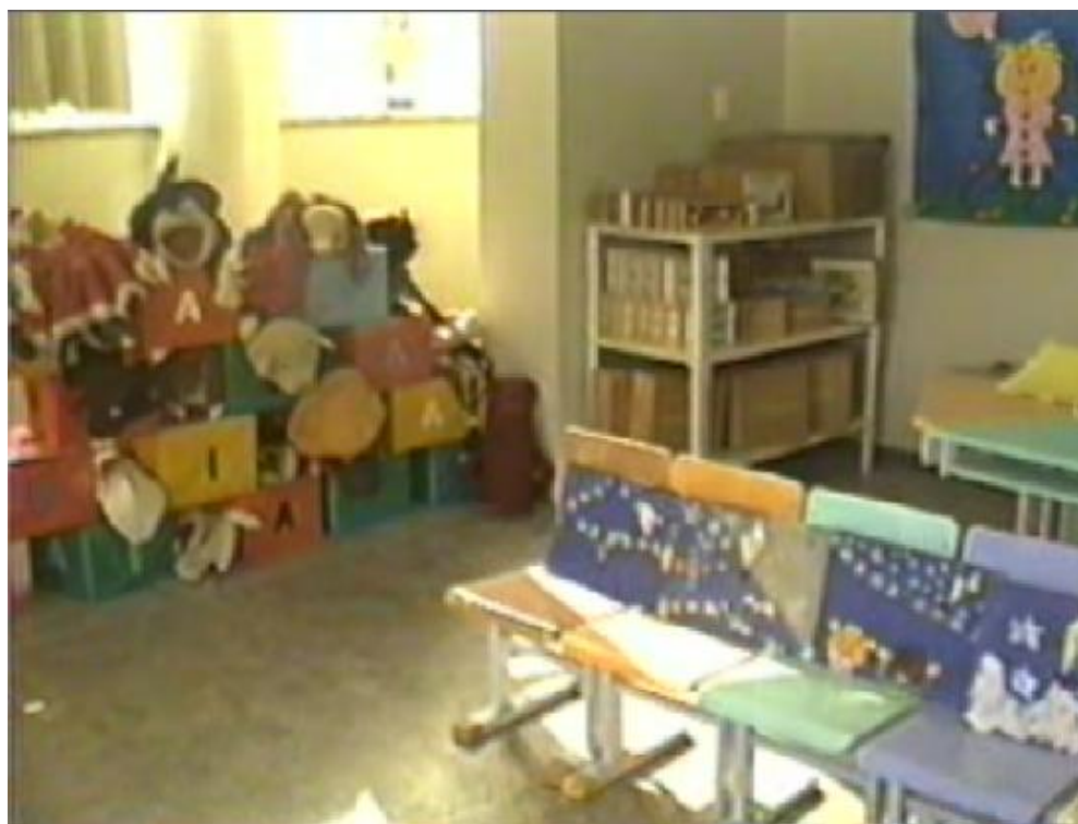
Figura 2 - Vista parcial da brinquedoteca, local das interações.

diversos brinquedos como bonecos e bonecas, fantoches, carrinhos, jogos educativos em madeira e papelão, peças de encaixe, livros interativos e outros. A sala é bem arejada, clara, e acomoda um número considerável de almofadas coloridas dispostas no chão, além de um tapete grande. Em uma das paredes, há um mural atrativo nas cores e bem decorado. Além desses itens, faz parte do recinto um espaço destinado à montagem de painéis e estruturas que possibilitem o trabalho com fantoches. A Figura 2 mostra uma imagem com vista parcial do local da interação.