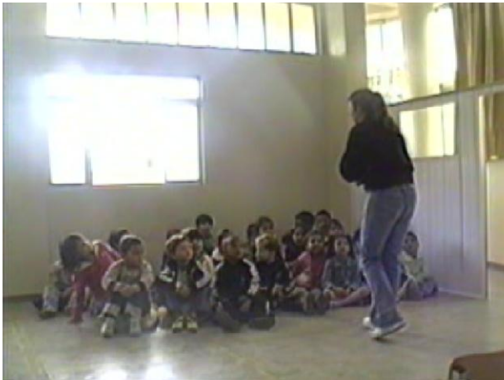
Figura 3 - A professora preparando as crianças para ouvir a história.