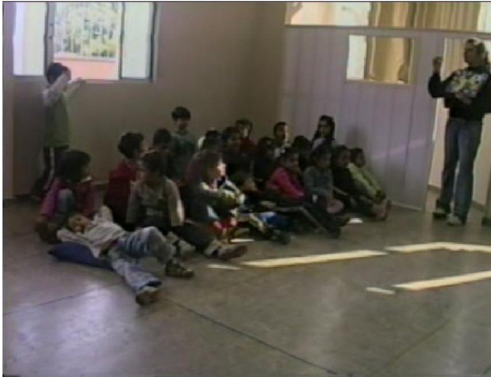
Figura 9 - Professora e alunos em interação no final da atividade: os questionamentos.