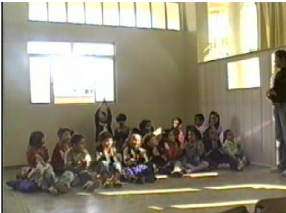
Figura 10 – O momento da avaliação: a professora fazendo perguntas sobre a história contada.