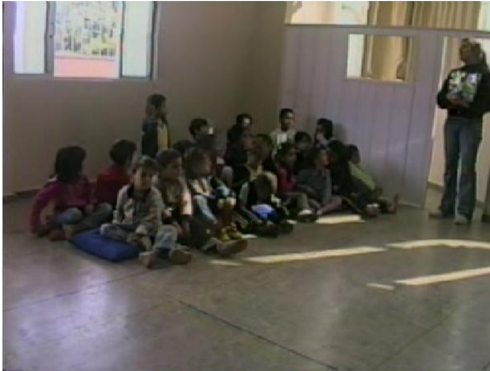
Figura 1 - Contadora de histórias (em pé) e as crianças (sentadas), ambas focos de nossa análise.

A faixa etária delimitada nos permitiu buscar subsídios para compreender comportamentos facilmente identificáveis dentro desta turma. Para isso, buscamos suporte dentro de reflexões da Psicologia Evolutiva que em detalhes procura entender as fases pelas quais passa o ser humano.