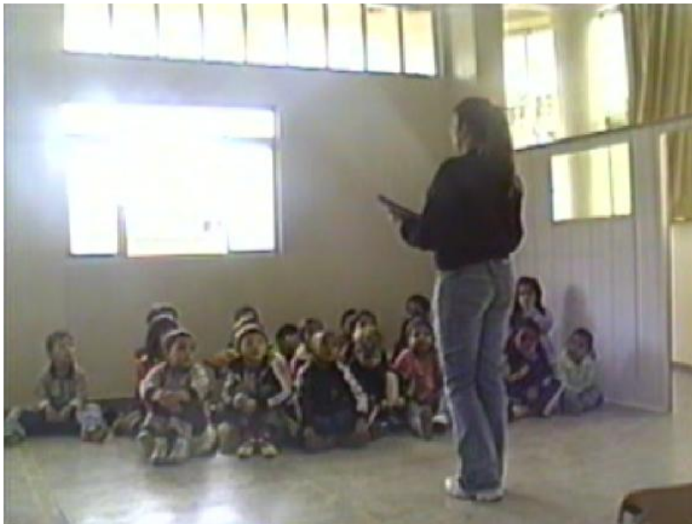
Figura 4 - Disposição espacial da professora e seus alunos durante a contação da história.