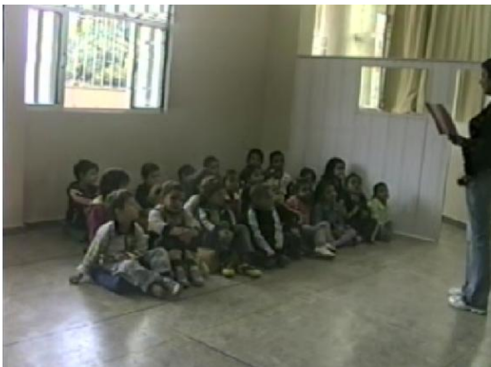
Figura 7 - A professora olhando para o cartaz e os alunos centrados em seu comando.

O mesmo tipo de controle também pode ser observado no fragmento 4, expresso a seguir.