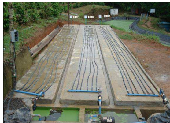
Figura 2. Bancadas experimentais dotadas de reservatórios com esgoto doméstico preliminar (EDP), esgoto doméstico secundário (EDS) e esgoto doméstico terciário (EDT), conjuntos motobomba, filtros de discos e válvulas reguladoras de pressão.

Este modelo de gotejador apresentava as características técnicas: não-autocompensante, vazão nominal de 1,7 L h -1 , faixa de pressão de serviço de 40 a 100 kPa, espaçamento entre gotejadores de 0,50 m, comprimento do labirinto de 177 mm, largura interna do labirinto de 1,7 mm e um único filtro secundário por gotejador (Figura 2).