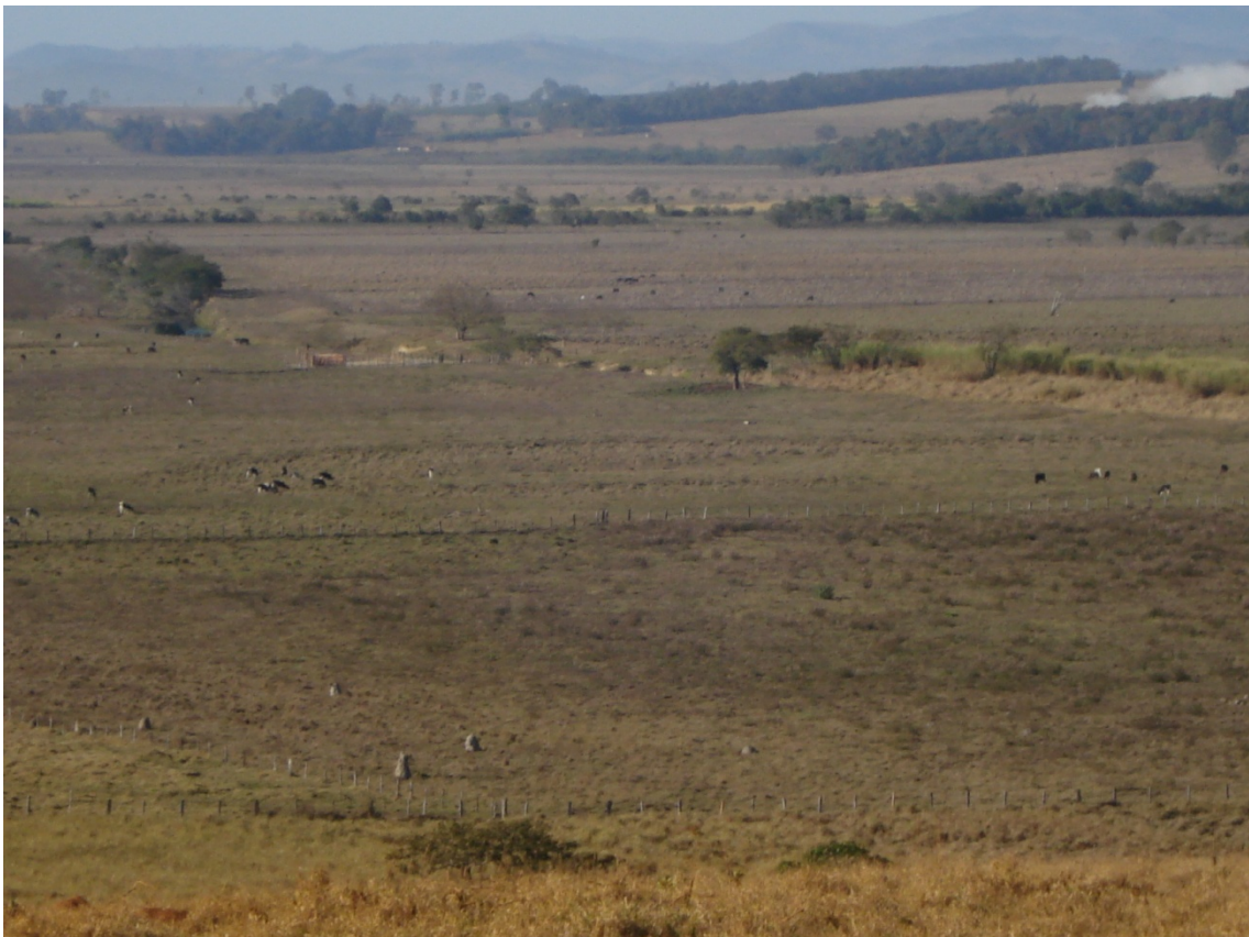
Vista parcial do Pântano atualmente