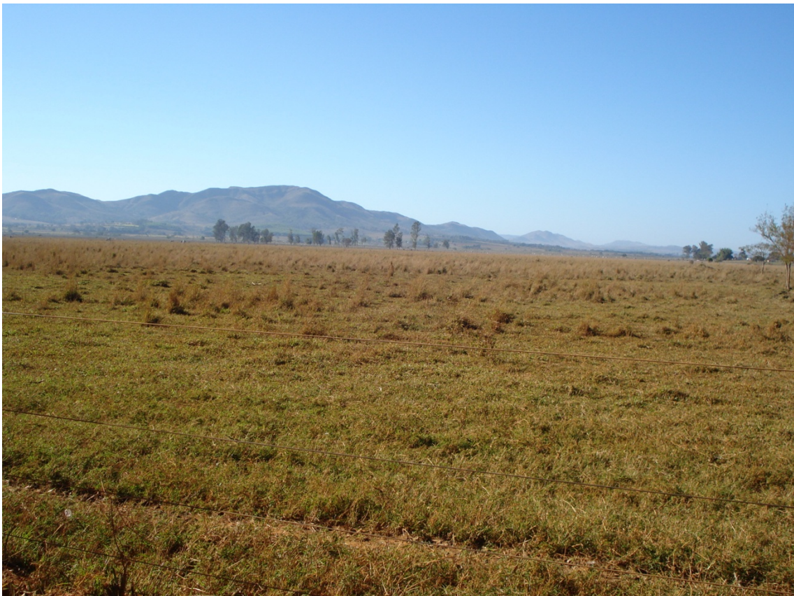
Vista parcial de pastagem no Pântano atualmente