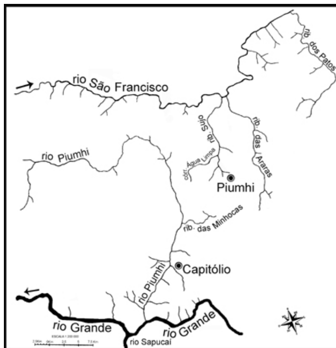
Figura 1 - Traçado original do rio Piumhi. Fonte: MOREIRA FILHO, O. "Uma transposição de rio esquecida." Revista Universidade Federal de Goiás . v. VIII, n.2, dez. 2006. pp. 77-82.

solucionar o problema, foi construído um segundo dique, próximo à cidade de Capitólio que também represou as águas do rio Piumhi, o qual passou a se isolar do rio Grande deixando de ser seu tributário. Até essa época o rio Piumhi nascia entre os municípios de Vargem Bonita e Piumhi, numa altitude de 930 metros e fluía em direção ao sul na margem esquerda da cidade de Capitólio, onde encontrava a foz no rio Grande, a 760 metros de altitude. A figura a seguir ilustra a situação do rio até 1958: