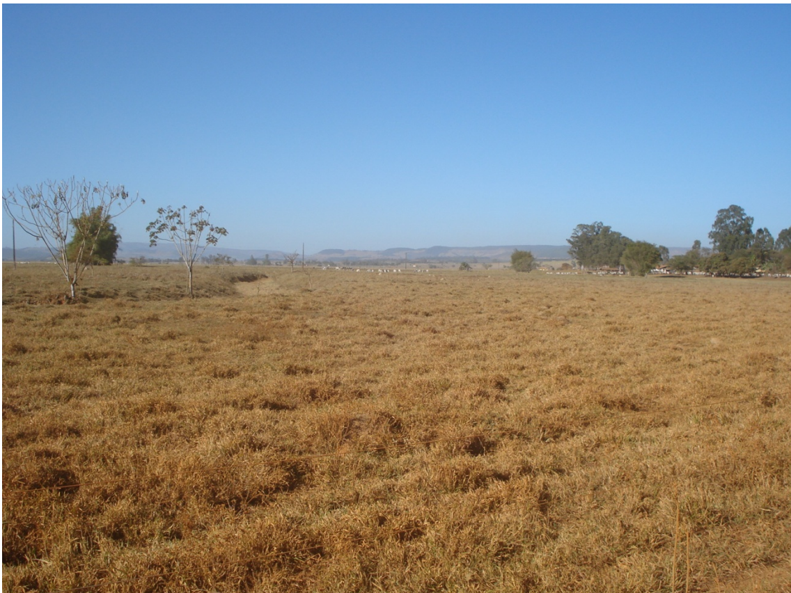
Vista parcial do Pântano atualmente