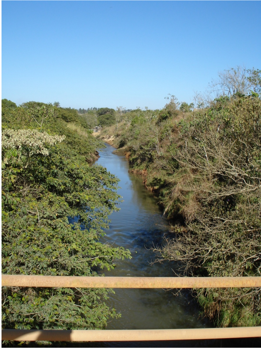
Vista parcial do rio Piumhi