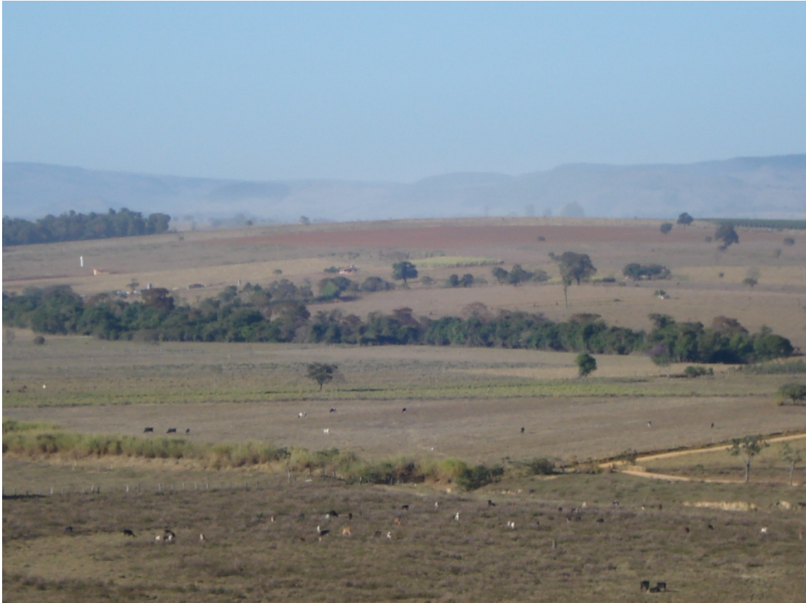
Vista parcial do Pântano atualmente