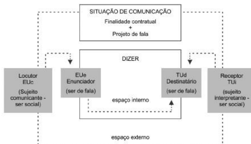
Figura 1 – Ato de linguagem e os sujeitos

Nessa perspectiva, podemos representar a encenação da linguagem por meio do quadro comunicacional. Na figura 1 temos essa representação, apontando o ato de linguagem e os sujeitos que o compõe.