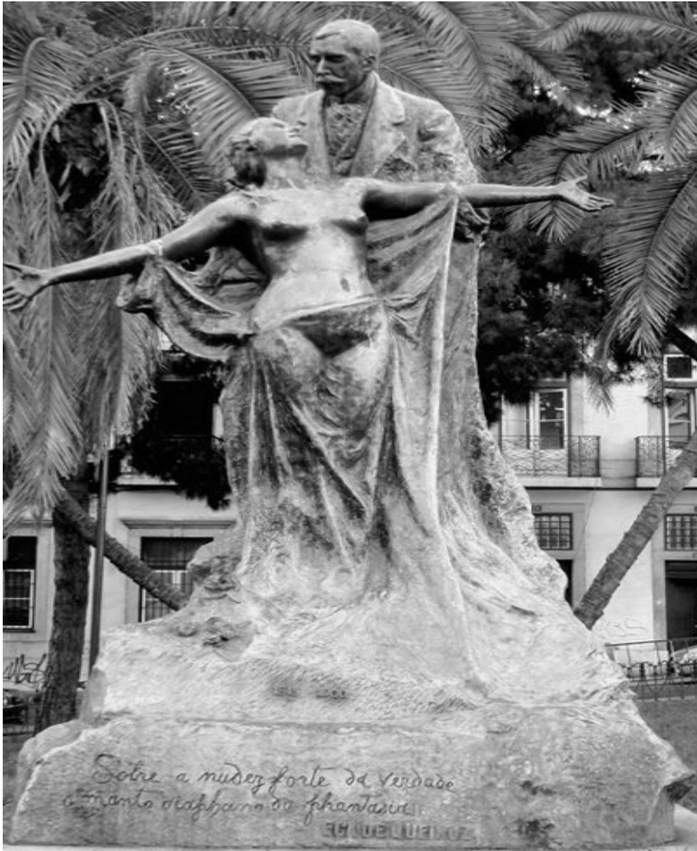
Fotografia 5 – Escultura de António Teixeira Lopes, em homenagem a Eça de Queirós, situada na Rua do Alecrim, em Lisboa. Nela contém a expressão “Sobre a nudez forte da verdade o manto diáfano da fantasia”, o subtítulo do romance A Relíquia . A obra foi inaugurada em 1903, três anos depois da morte do escritor.