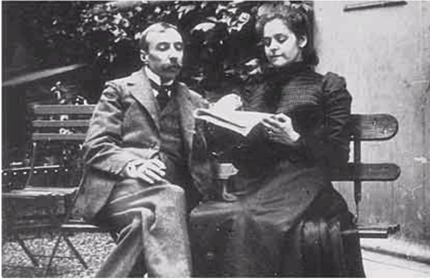
Fotografia 3 – Eça de Queirós e sua esposa D.ª Emília de Castro.