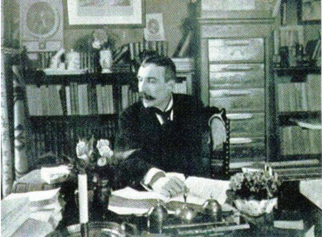
Fotografia 1 – Eça de Queirós em seu escritório em Paris.