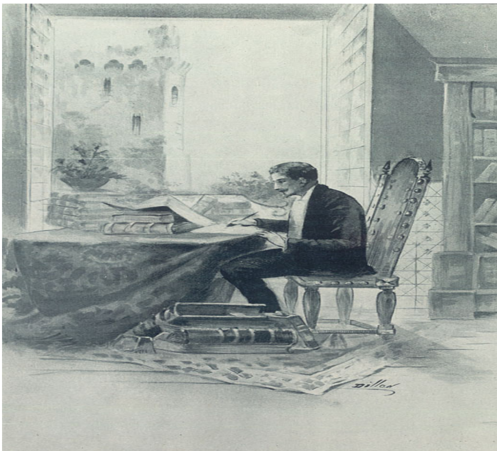
Fotografia 8 – Livraria de Gonçalo Ramires.