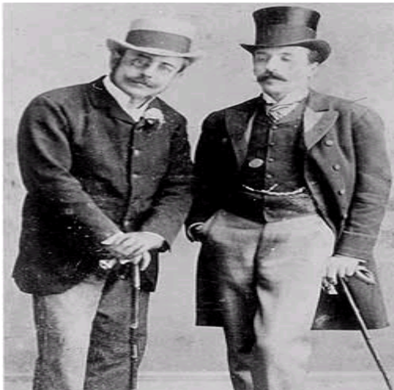
Fotografia 4 – Ramalho Ortigão e o amigo Eça de Queirós.