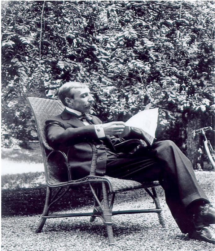
Fotografia 6 – Eça de Queirós em Neuilly, França, em 1893.

só espelha o evidente declínio de Portugal, como o tinha realizado em Os Maias – que igualmente retrata os costumes e a mentalidade da elite portuguesa do fim do século XIX –, mas, sobretudo, aponta caminhos sociais alternativos, como o trabalho sério e dedicado em colônias africanas. O romance ICR deixa claro, com isso, que para Eça o Portugal pós-Ultimato inglês tinha futuro, poderia sair da situação delicada em que se encontrava.