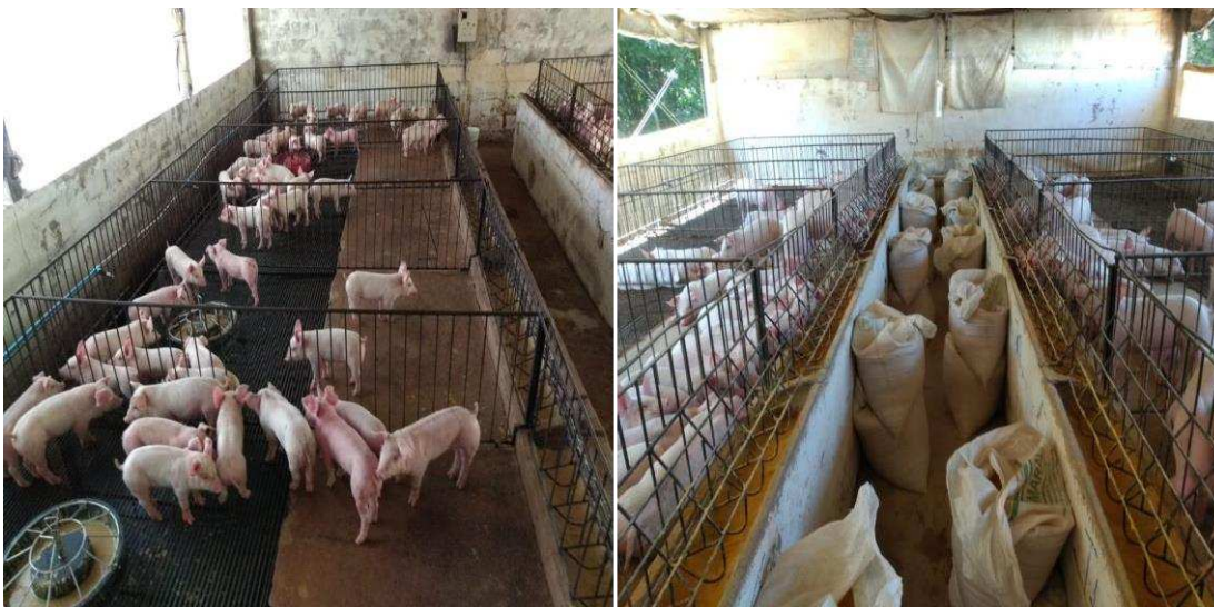
Figura 2 - Visão dos animais alojados nas baias experimentais.

Cada uma das gaiolas foi utilizada como unidade experimental, contendo 10 leitões em cada, sendo utilizadas 03 salas para distribuir os tratamentos e as repetições, conforme mostrado na Figura 2.