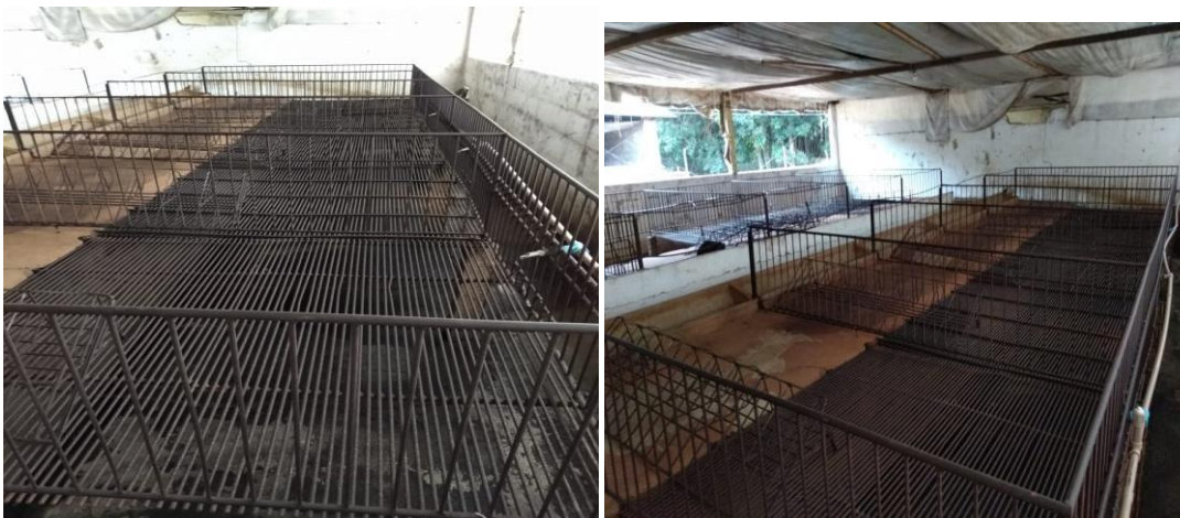
Figura 1 - Sala de creche, onde os animais foram alojados experimentalmente.