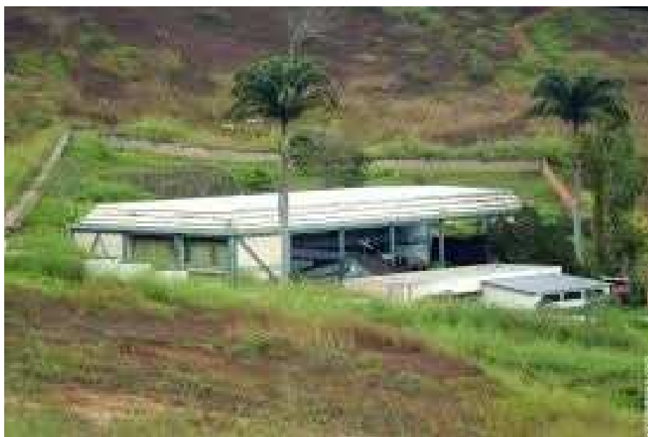
Figura 1 – Foto panorâmica da Escola Estadual Raul de Leoni. 8

A Escola Estadual Raul de Leoni está localizada na Rua Mario Dutra, s/nº, Bairro Santo Antônio, em um lugar conhecido como “Cantinho do Céu”, no município de Viçosa, MG (Figura 1). Foi criada em 1962, e possuía 929 alunos em 2013. Essa escola oferece do ensino fundamental ao ensino médio no período da manhã (entre 7h15 e 11h15) e no da tarde (entre 12h15 e 16h55).