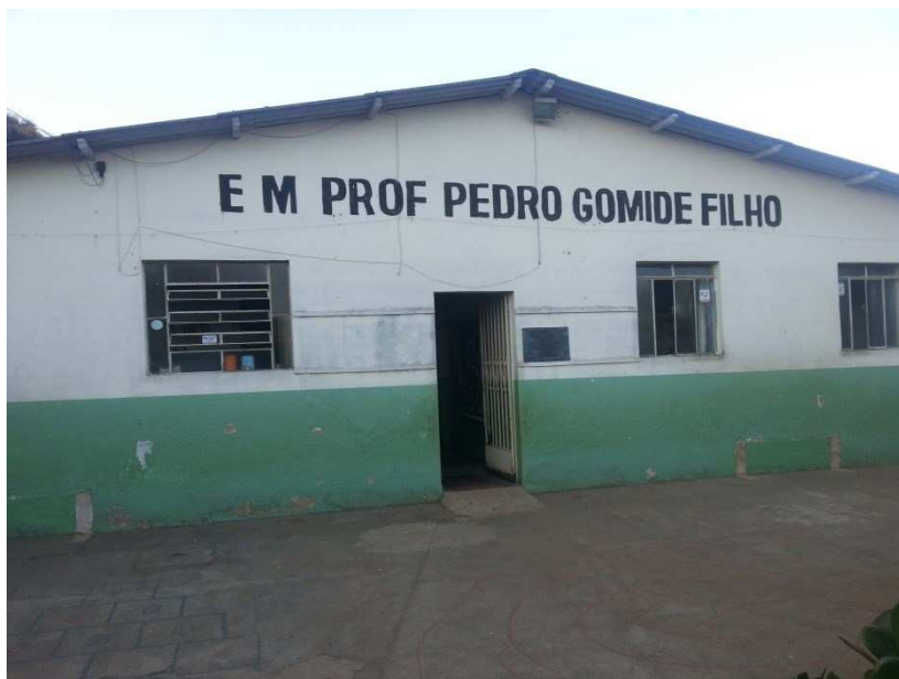
Figura 2 – Foto panorâmica da Escola Municipal Pedro Gomide Filho. 9