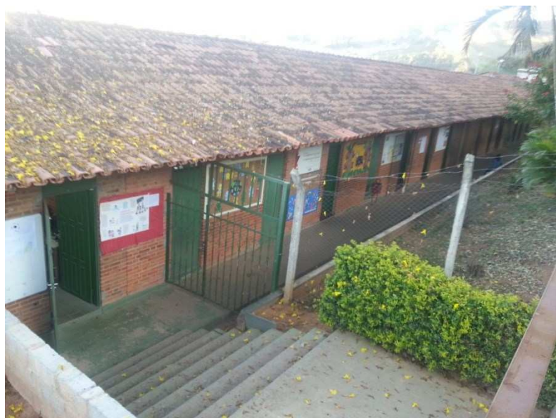
Figura 3 – Foto panorâmica da Escola Estadual Santa Rita de Cássia. 10