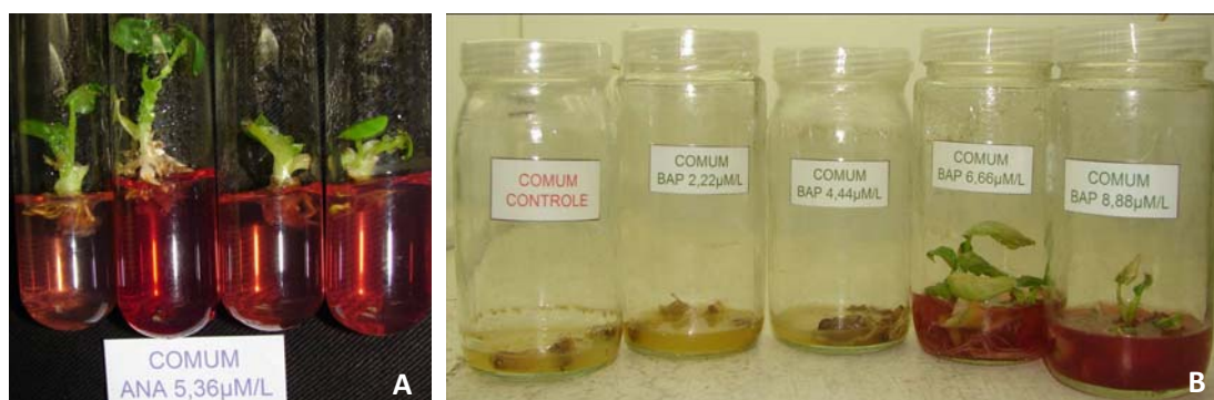
Figura 5. Cultivo in vitro de taioba, variedade Comum. A) Brotações em meio semi-sólido suplementado com ANA e B) em meio líquido suplementado com BAP.

Em relação à variedade Comum, detectaram-se plantas que exudaram substâncias no meio de cultivo, provocando a coloração vermelho-intenso. Este fato foi observado em plantas cultivadas em meio suplementado com ANA e BAP, nas três modalidades de cultivo (Figura 5).