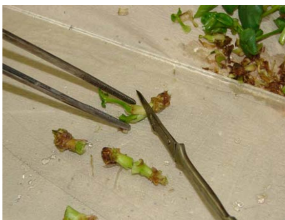
Figura 1. Brotos de taioba provenientes do cultivo in vitro em meio semi-sólido, sendo submetidos à remoção da parte aérea e sistema radicular.