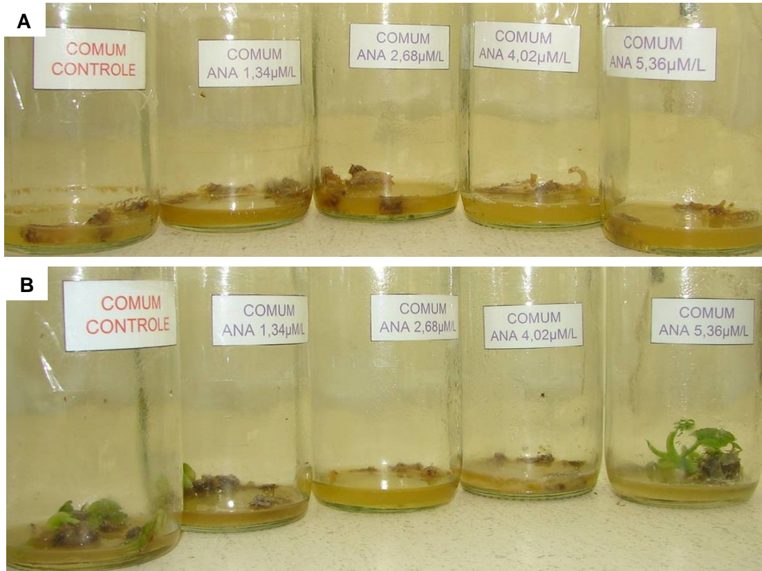
Figura 3. Variedade de taioba Comum aos 51 dias de cultivo in vitro em meio MS suplementado de diferentes concentrações de ANA. A) Meio líquido sob agitação; B) Meio líquido estacionário.