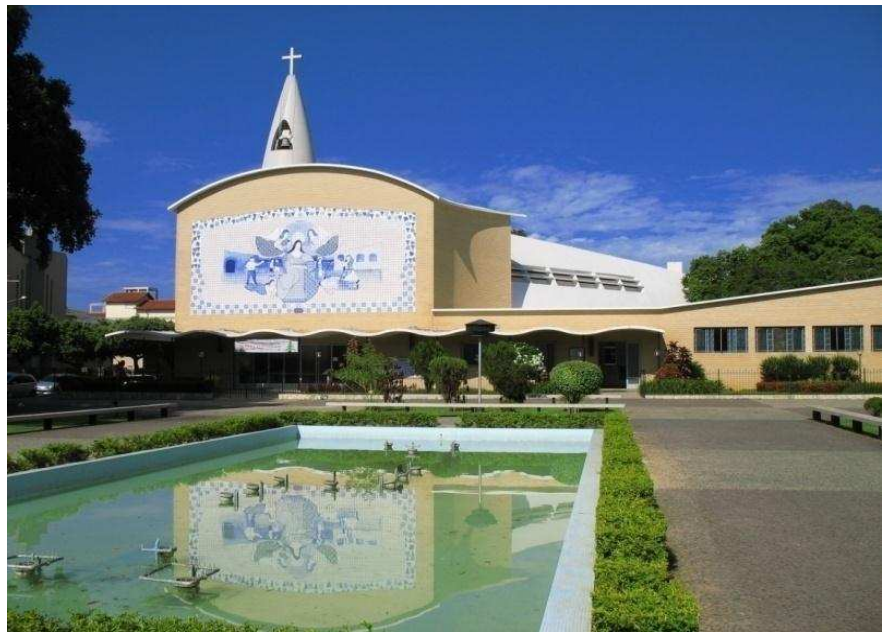
Figura 7 – Santuário de Santa Rita Fotos cedidas por Joaquim Branco (arquivo pessoal).