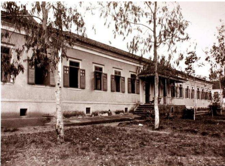
Figura 4 – Ginásio Municipal de Cataguases (antigo)