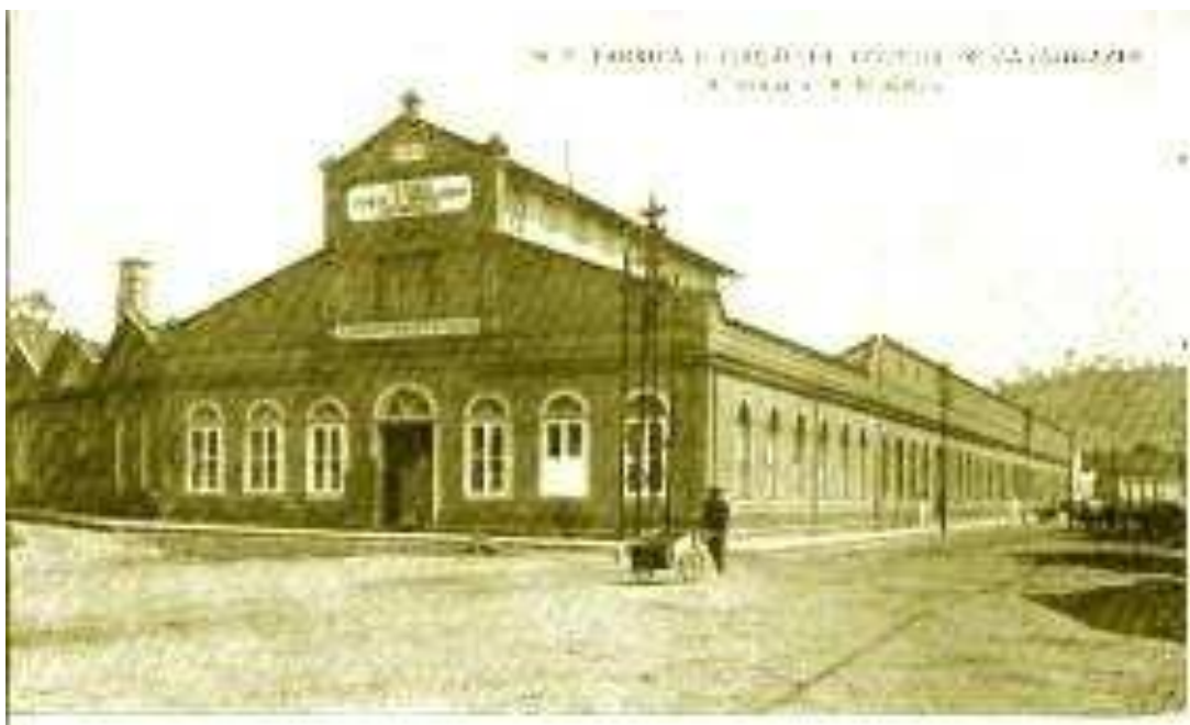
Figura 2 – Antiga “Indústrias Irmãos Peixoto”, Foto cedida por Joaquim Branco (arquivo pessoal).

aparecimento da imprensa”. Na inauguração da cidade, “tinha a Vila de Cataguases (...), 87 casas, quase choças, distribuídas, com extensos intervalos, por seis ruas e duas praças descalçadas e irregularmente aplainadas e construídas. A população não excedia de 450 almas”. Enquanto, em 1908, a cidade contava com “habitantes em número seis vezes maior (2.500 almas); 470 prédios, todos servidos, desde 1891, de excelente água potável encanada e esgotos, 5 praças, 14 ruas e 3 travessas” (p. 946). O que comprova, segundo Rezende, um progresso contínuo.