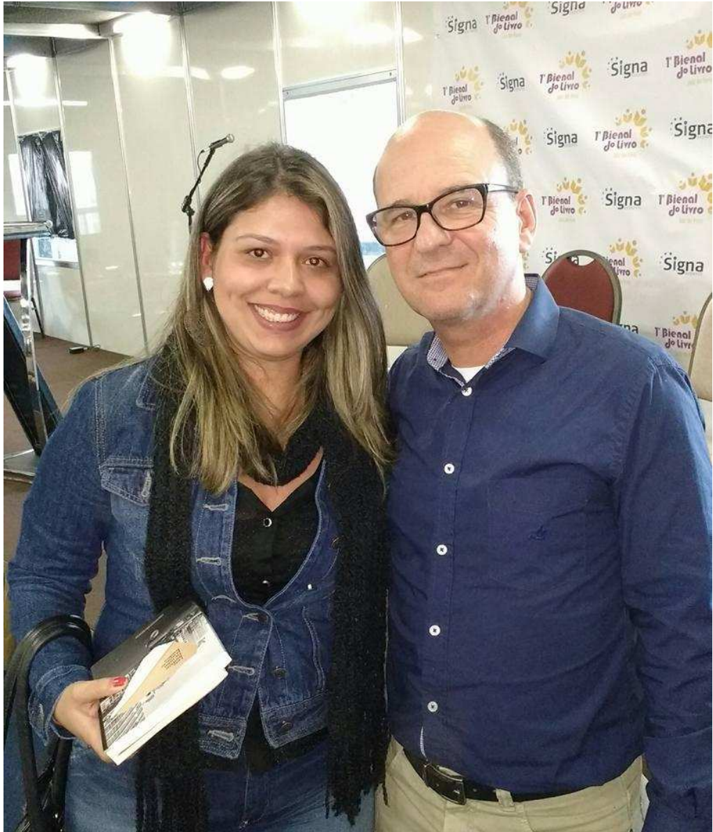
Encontro com Luiz Ruffato na 1ª Bienal do livro de Juiz de Fora, em junho de 2016.