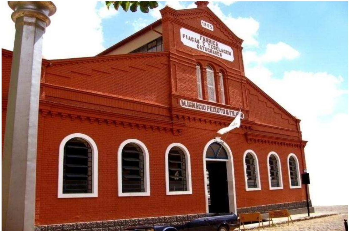
Figura 3 – Fábrica Fiação e Tecelagem Cataguases, antiga “Indústrias Irmãos Peixoto”, atual Supermercado Bahamas