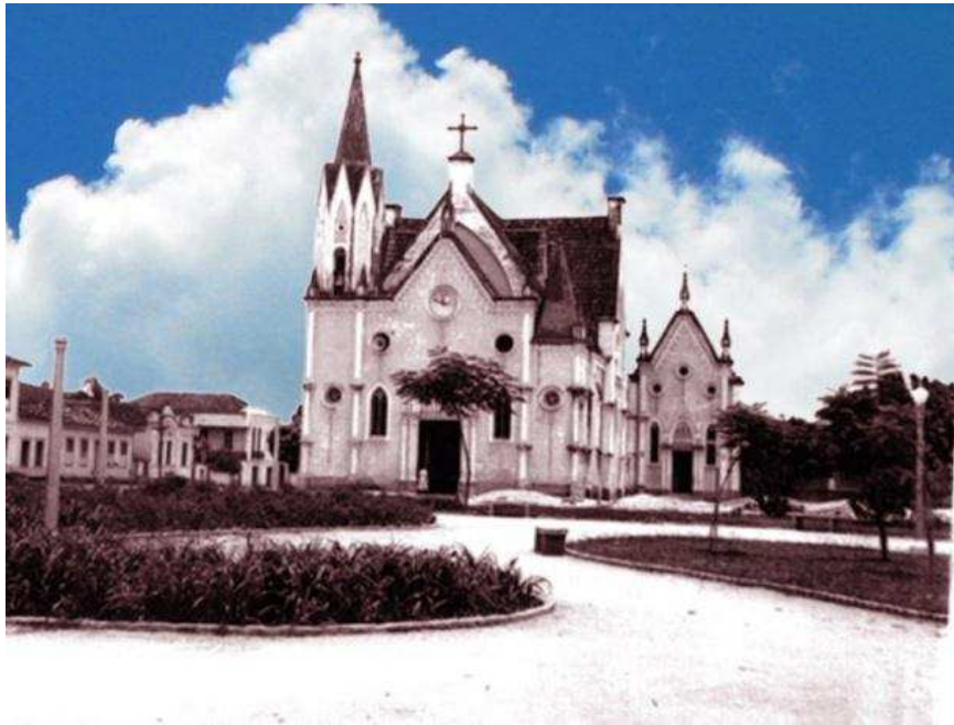
Figura 6 – Antiga Igreja de Santa Rita

Outro prédio que representa o espírito modernista na cidade é o Santuário Santa Rita de Cássia que foi remodelado conforme imagens a seguir. O novo projeto, de Edgar Guimarães do Vale, representa um avião bombardeado, em referência à Segunda Guerra Mundial e contém um painel de azulejos assinado pela pintora Djanira, em substituição ao estilo gótico do antigo prédio. No total, 16 bens localizados no centro da cidade foram, em 1994, tombados pelo IPHAN-MG e, portanto, fazem parte do Patrimônio Histórico Nacional.