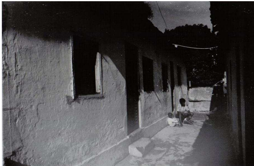
Figura 1 – Fotografia da casa em que nasceu Luiz Ruffato, no antigo Beco do Zé Lincoln, bairro Vila Teresa em Cataguases.

Até hoje descubro autores que li naquele ano. Acho que a bibliotecária do colégio era completamente maluca. O primeiro livro que ela me deu era de um autor soviético – em plena Ditadura! E, lá em Cataguases, nós temos um sotaque bem carregado, não tem como falar o nome do cara. Se alguém me perguntasse na rua quem era o autor daquele livro, ninguém ia entender nada. O nome dele era Anatoly Kuznetsov. O título do livro era “Babi Yar”, que falava sobre o massacre de judeus na Segunda Guerra Mundial, na região de Odessa. Esse foi o primeiro livro que eu li 13 .