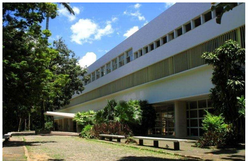
Figura 5 – Colégio Cataguases, projetado por Oscar Niemeyer