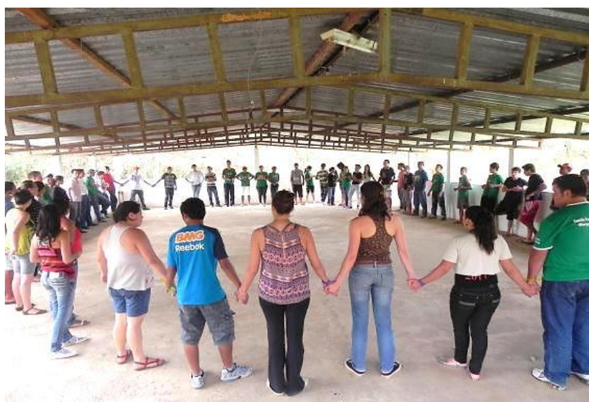
Figura 10 – Evento: “Semana Paulo Freire”. Metodologia utilizada: Técnica do Teatro do oprimido (2013)