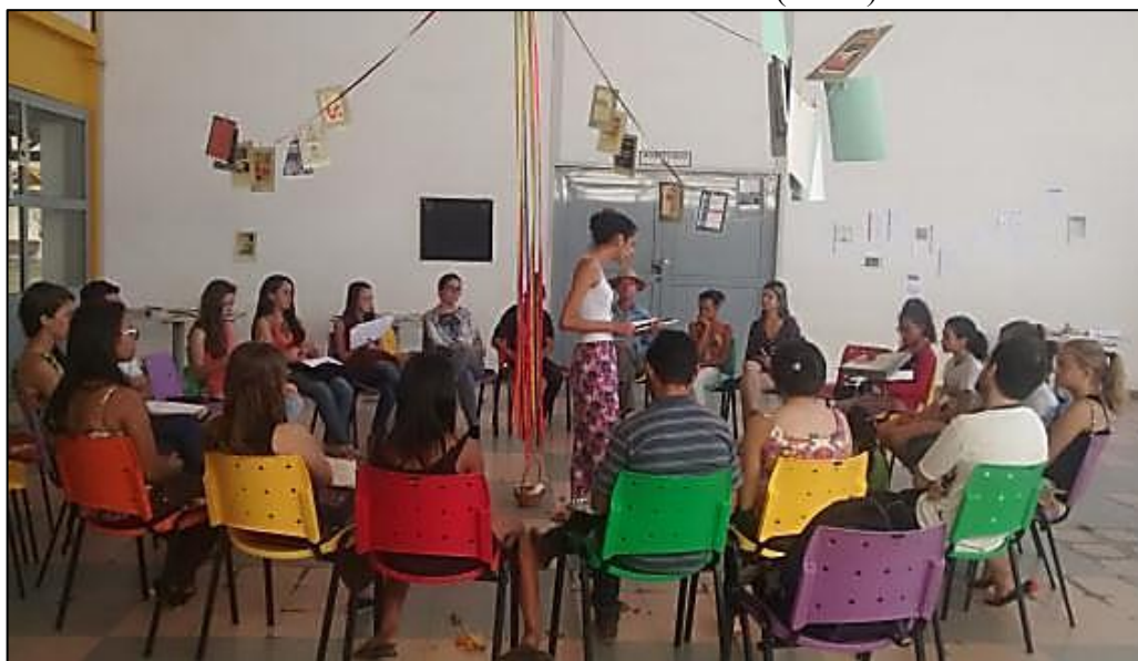
Figura 7 – Círculo de Cultura na Instalação Artístico-Pedagógica: (De) Lírios da Poesia e Paulo Freire / Troca de Saberes (2016 )

Segundo Romão (2006), o círculo de cultura caracteriza-se por “[...] reunir pressupostos filosóficos, teóricos e metodológicos para ser adotado como método que mobiliza os participantes do grupo a pensar sobre sua realidade dentro de uma concepção de reflexão-ação” (ROMÃO et al., 2006, apud CONTE, 2012, p. 9). Então, “os Círculos não deixam de se constituírem em momentos nos quais a comunidade reflete sobre suas práticas a partir de seu próprio resgate histórico” (SILVEIRA, 2014, p. 42).