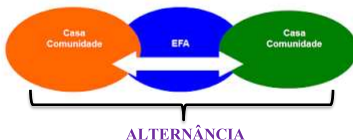
Figura 2 - Pedagogia da Alternância