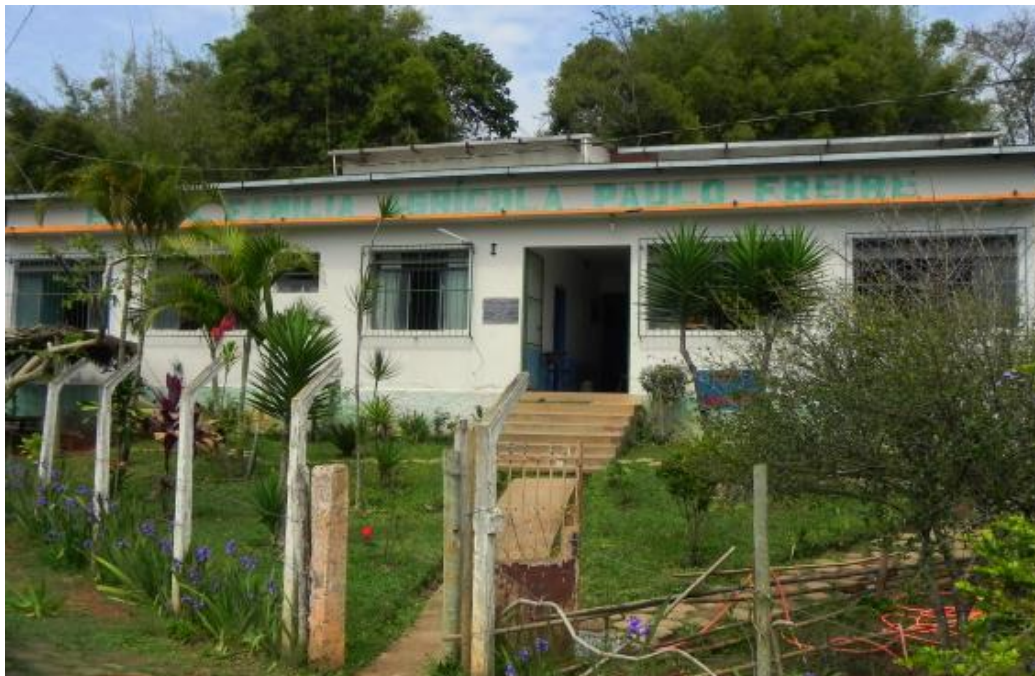
Figura 1 – Fachada da Escola de Família Agrícola Paulo Freire

forma de trabalho, isto é, as EFAS seguem os princípios fidedignos desse modelo de escola, entretanto, possui características próprias no jeito de executar seus instrumentos.