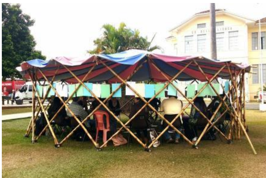
Figura 10 – Instalação Pedagógica: Cátedra Paulo Freire (2017)