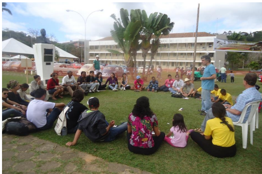
Figura 11 – Instalação Pedagógica: Educação Musical (2013)