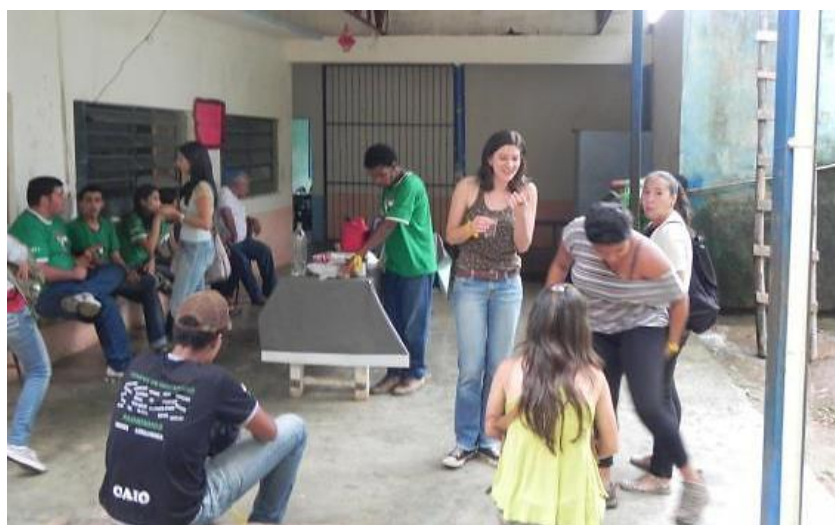
Figura 9 – Momento de intervalo na Semana Paulo (2013)

“Serões”, para o final do dia com dinâmicas e ambiências para realizar com os jovens