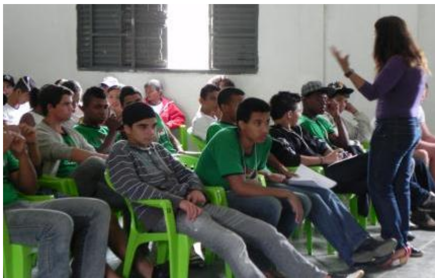
Figura 8 – Evento: Formação de Monitores na EFAP.

Nesse evento, nós estudantes da UFRV ajudamos na organização do evento, realizando as inscrições, organizando o espaço e na realização de algumas dinâmicas.