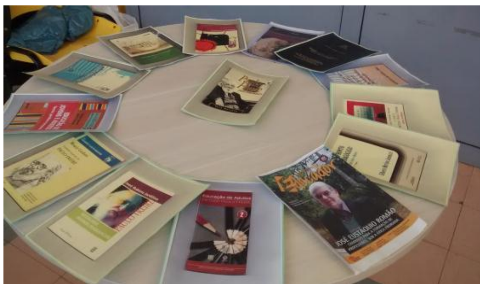
Figura 6 – Ambiência (B) da Instalação Artístico-Pedagógica: (De) Lírios Da Poesia E Paulo Freire / Troca de Saberes 2016