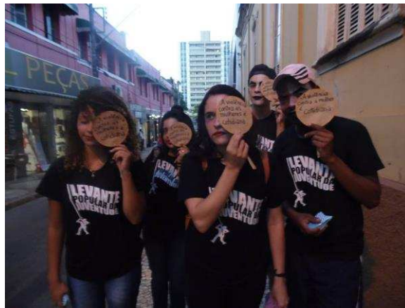
i) Intervenção teatral realizada pela célula Policultura sobre a violência contra as mulheres nas ruas e ônibus de Viçosa