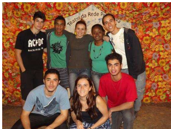
a) Fotografia tirada durante apresentação da peça Todo dia de Mulher em frente a Câmara Municipal de Viçosa