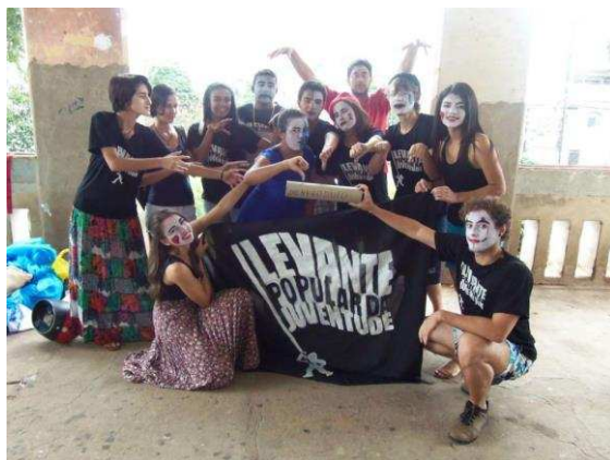
a) Fotografia de intervenção teatral durante o Ato pelas águas em Viçosa