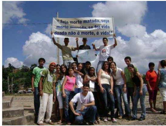
c) Fotografia tirada após as intervenções teatrais realizadas na Via Sacra da Juventude