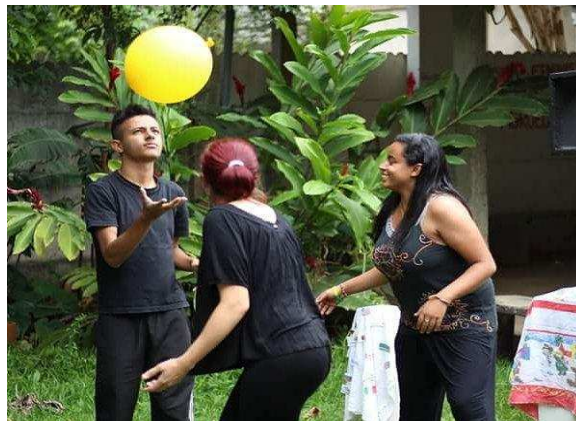
j) Fotografia de um ensaio do Policultura sobre a peça A crise brasileira