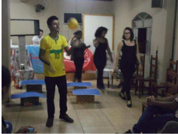
k) Apresentação da peça A crise brasileira , ainda em construção, na cidade de Piranga.