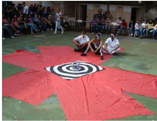
a) Intervenção teatral sobre o papel da mídia na criminalização da juventude.