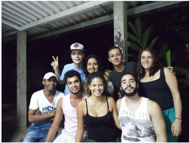
h) Fotografia de integrantes do Policultura após atividade de estudo e formação interna em TO