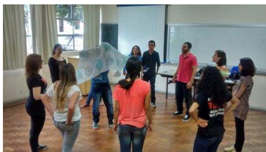
c) Fotografia de oficina de Introdução ao TO na UFV