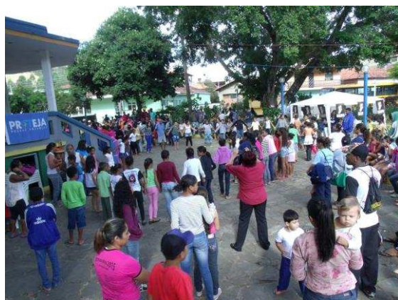
b) Fotografia de tarde de oficinas de TO em Amparo do Serra