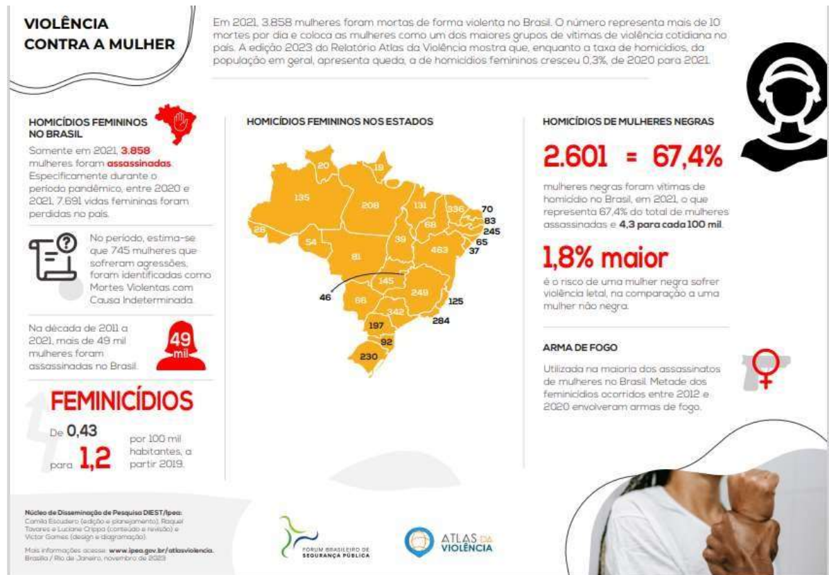
Imagem 1: mapa da violência contra a mulher