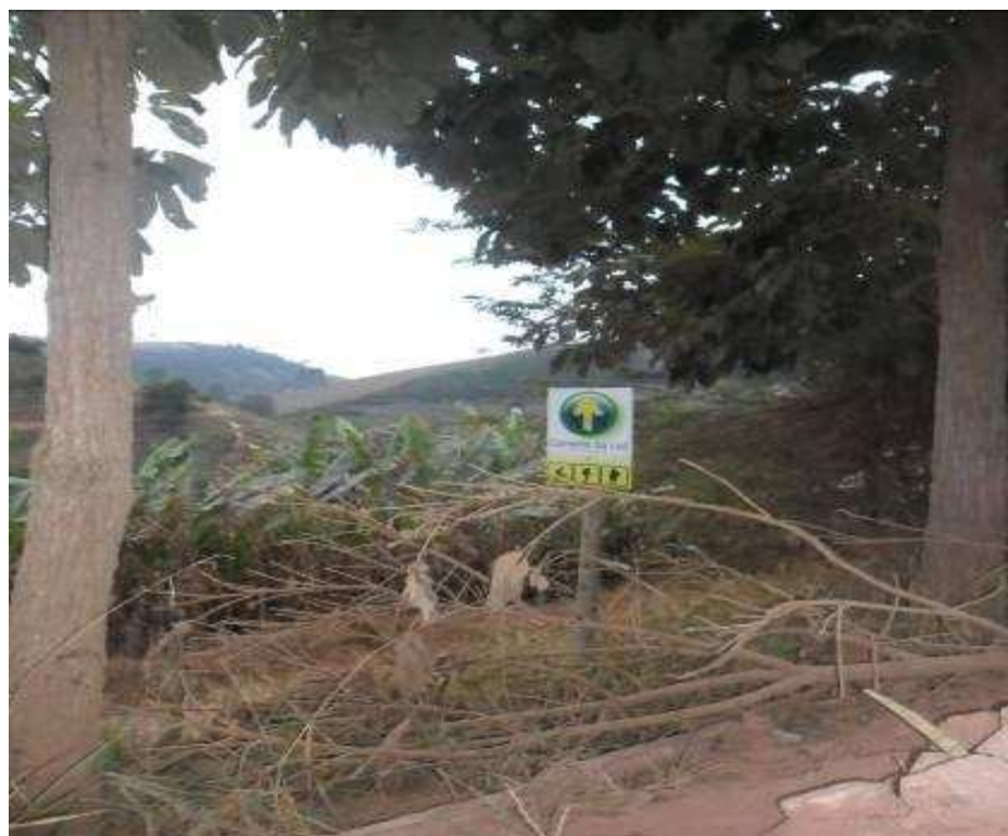
Foto 8 “Caminho da Luz” que passa pela comunidade Galiléia e segue rumo ao Pico da Bandeira, município de Caparaó – MG.