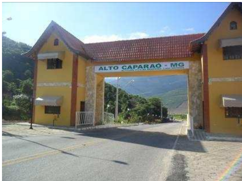
Foto 1 Portal de entrada da cidade de Alto Caparaó