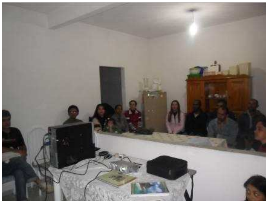
Foto 12 Reunião de base do STR Espera Feliz, Comunidade Quicé.

sociedade, inclusive no meio rural. Durante o trabalho de campo, em algumas reuniões presenciadas pela pesquisadora, pode-se verificar situações contraditórias: momentos em que houve a separação entre homens e mulheres, nos espaços físicos onde estava sendo realizado o encontro (situações flagrantes nas fotos 12, 13, e 14) e momentos em que havia o incentivo dos homens para que as mulheres pudessem se dedicar à reunião (fotos 15 e 16).