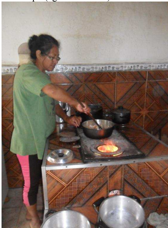
Foto 20 Sindicalizada do STR de Carangola (Comunidade Papagaio) prepara almoço durante a entrevista.