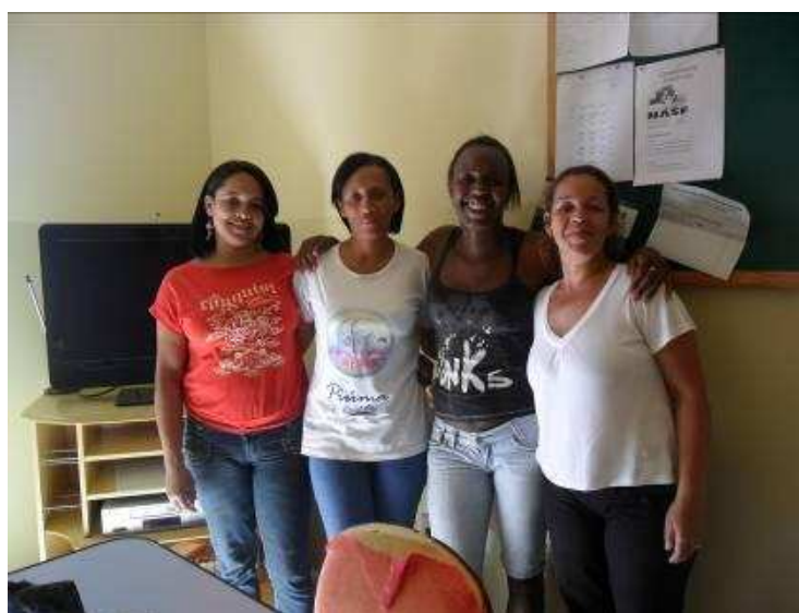
Foto 23 Equipe de ACS do Município de Caiana.

As informações das Secretarias Municipais de Saúde foram fundamentais para realizar as entrevistas assim como a atuação dos Agentes Comunitários de Saúde (ACS). Os ACS atuam nas regiões urbanizadas, periferias e no meio rural. Eles fazem visitas aos domicílios visando fazer um acompanhamento das pessoas do bairro que são atendidas pelo Programa de Saúde da Família. A importância dos agentes comunitários de saúde para a realização da pesquisa se deu pelo fato de eles terem facilitado a abordagem nos domicílios, fazendo a apresentação da pesquisadora a essas mulheres. Sem esse papel de intermediação seria praticamente impossível o recebimento da pesquisadora nas residências visitadas e aplicação dos questionários.