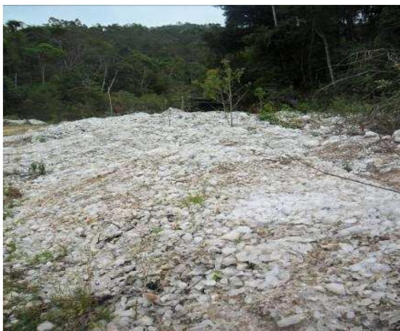
Foto 3 Cristais que ainda podem ser encontrados na entrada da Lavra São Roque, Caiana - MG.

O IBGE divulga estimativas do PIB 10 dos municípios baseado em três grandes setores de atividade econômica: agropecuária, indústria e serviços. A última pesquisa realizada no período de 2005-2009 está disponível no site do IBGE e demonstra que no município de Caiana o setor de serviços supera a produção agropecuária seguida pelo setor industrial. No setor agropecuário, a cafeicultura se destaca. Dados do censo agropecuário 2010 do IBGE apontam a produção de 3.180 toneladas de café em grão sendo esses dados coletados em estabelecimentos agropecuários com mais de 50 pés existentes em 31/12 daquele ano.