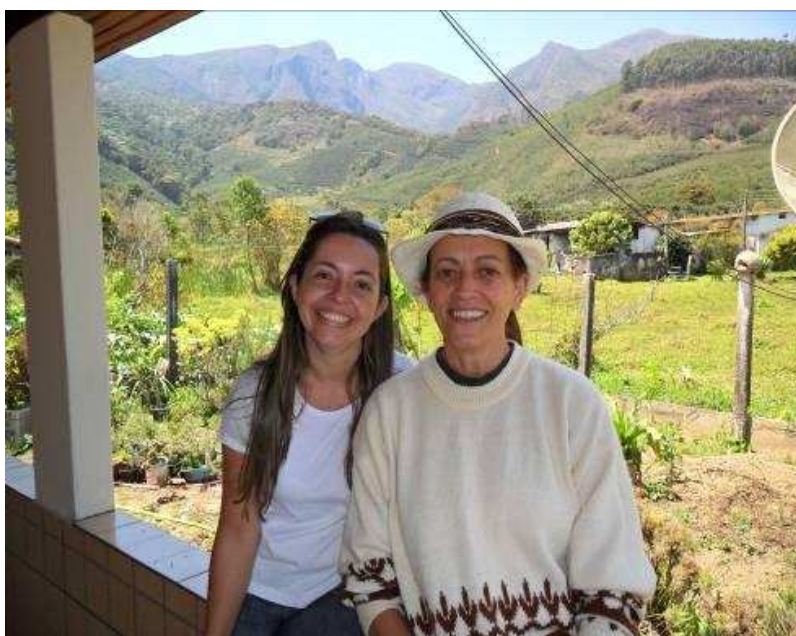
Foto 29 A pesquisadora (esquerda) e sindicalizada (direita) do município de Alto Caparaó.