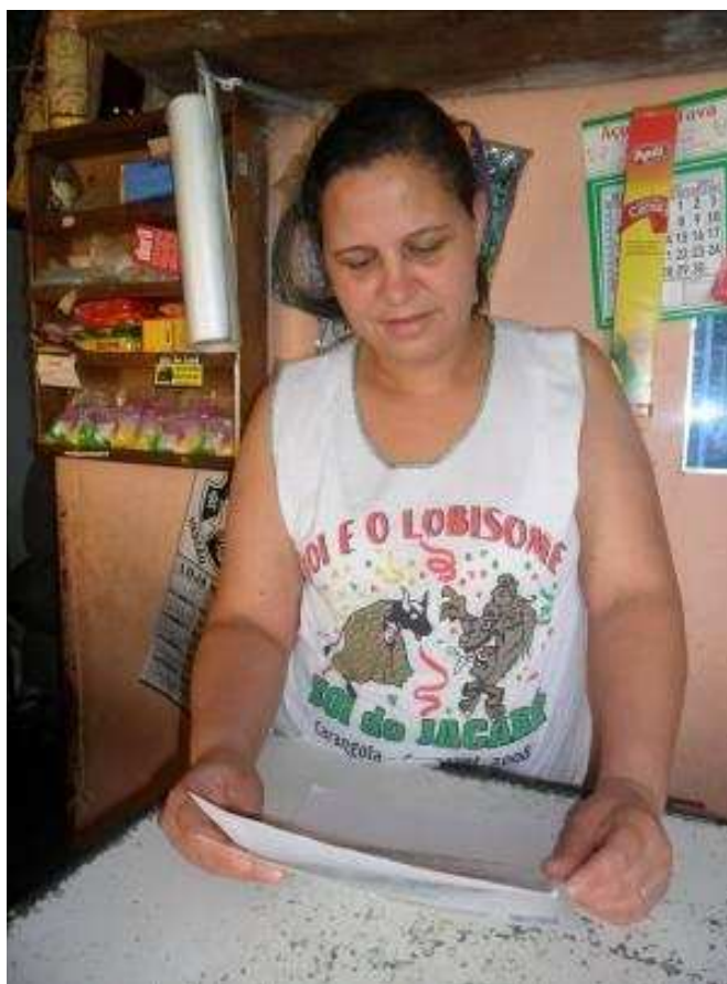
Foto 27 Entrevistada não sindicalizada do município de Carangola (bairro Triângulo) lê o termo de consentimento da pesquisa.

em cada um dos pontos de atendimento nos bairros, nas comunidades e nos distritos, nos cinco municípios pesquisados. Em alguns momentos, dentre as sorteadas para as entrevistadas, foram encontradas mulheres que eram sindicalizadas no STR da cidade. Quando isso aconteceu, a sorteada foi excluída e procedeu-se ao sorteio de outra para substituí-la. A informação sobre a filiação sindical era obtida já nos primeiros momentos da entrevista e a entrevistada era informada da exclusão de sua participação devido ao fato de representar outro grupo amostral da pesquisa, a de mulheres sindicalizadas.