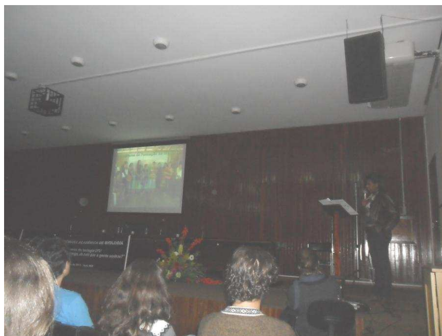
Foto17: Presidente do STR de Espera Feliz profere palestra no Departamento de Engenharia Florestal da Universidade Federal de Viçosa.

As sindicalizadas desta pesquisa não demonstraram dificuldades em dominar as “tecnologias de poder”. A pesquisadora acompanhou, durante o trabalho de campo, reuniões e palestras proferidas pelas presidentes dos STR estudados em diversos locais, desde comunidades rurais locais até auditórios como o da Universidade Federal de Viçosa (foto 17). Percebeu-se que as mesmas dominam o manuseio de instrumentos necessários a uma reunião, como data-show , notebook's e microfones bem como são desenvolturas e hábeis oradoras.