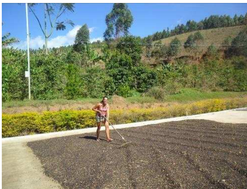
Foto 18 Sindicalizada do município de Espera Feliz (Córrego São Felipe) “roda o café” no terreiro durante a entrevista.

Para realizar as entrevistas em cada município investigado, contou-se com a colaboração de funcionários dos STR's que indicaram os locais e qual seria o melhor acesso, e até mesmo, por vezes, acompanharam nas visitas.