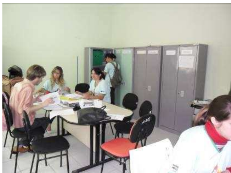
Foto 24 Equipe de ACS do Município de Alto Caparaó.