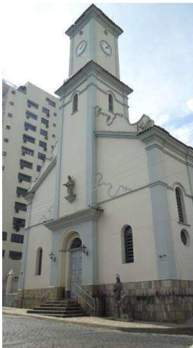
Foto 9 Igreja Matriz de Santa Luzia, município de Carangola – MG.

Localizada na mesorregião da Zona da Mata mineira, a cidade possui 32.296 habitantes, segundo o censo populacional 2010 do IBGE. A Zona da Mata é uma das 12 mesorregiões do estado de Minas Gerais, formada por 142 municípios que são agrupados em 7 microrregiões. Carangola está agrupada na microrregião de Muriaé e essas duas cidades representam os dois maiores municípios dessa região. Limita-se com as cidades de Caiana, Divino, Espera Feliz, Faria Lemos, Fervedouro, Pedra Dourada e São Francisco do Glória.