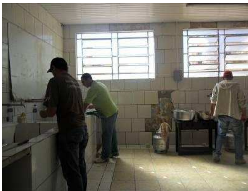
Foto 16 Sindicalizados do STR de Espera Feliz preparando o almoço para a reunião das mulheres associadas realizada no Educandário Sacramentino (Seminário).