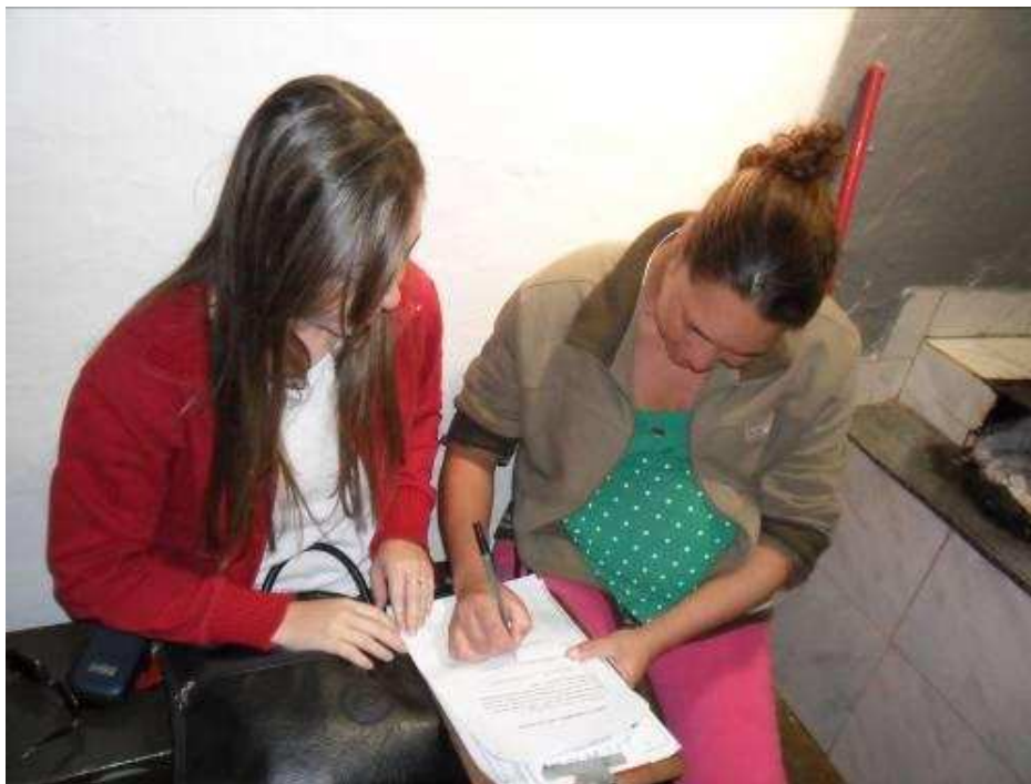
Foto 22 Entrevistada não sindicalizada do município de Alto Caparaó (Comunidade Renê Rabelo).

Posteriormente foi dividido proporcionalmente o tamanho da amostra encontrada ( n ) para cada município, como realizado no cálculo amostral das sindicalizadas.