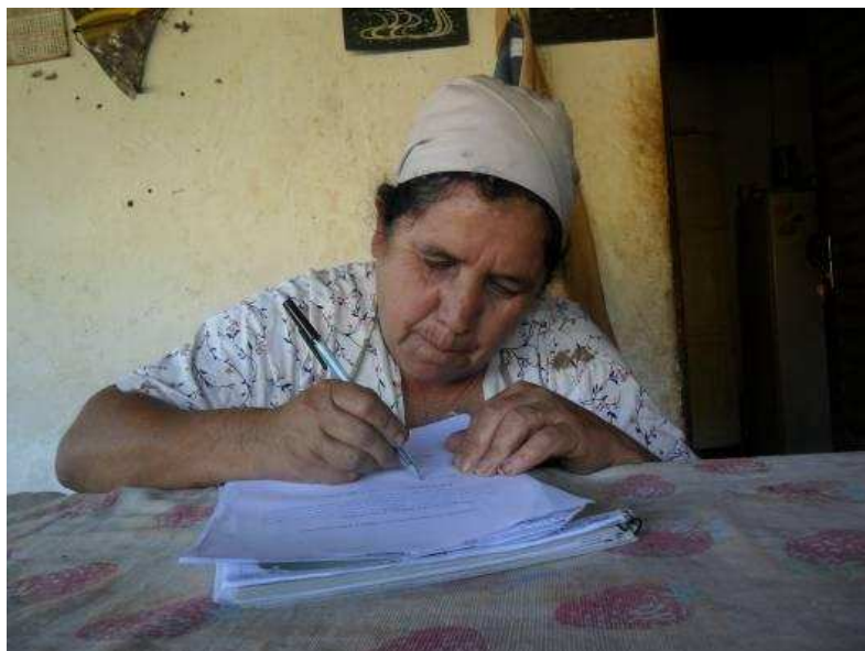
Foto 28 Entrevistada sindicalizada do Município de Carangola (Comunidade Conceição) assina o termo de consentimento da entrevista.