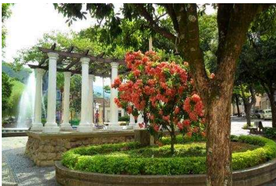
Foto 10 Praça Coronel Maximiano, Coreto principal, município de Carangola – MG.

Na primeira metade do século XIX Carangola teve seus primeiros núcleos de povoamento que contava, sobretudo, com índios Puris-Coroados vindos do litoral. A região que compreendia, geograficamente, o município em meados do século XIX era imensa: alcançava os municípios de Mariana, Pomba, Visconde do Rio Branco, Ubá e Muriaé. Nessa região estabeleceram-se grandes fazendeiros, antes do início da formação do povoado, na década de 1840. Carangola foi desmembrada do município de Muriaé pela Lei Provincial n.º 2500 de 12/11/1878 e, em 07 de janeiro de 1882, ocorreu a instalação do primeiro governo municipal. Nessa época em que a cidade foi emancipada, ela compreendia os distritos de Tombos do Carangola, São Mateus, São Sebastião da Barra, Alto Carangola, São Francisco do Glória, Espera Feliz e Divino do Espírito Santo do Carangola. Na imensa área que constituía o município, em 1882, ocorreram sucessivos desmembramentos que hoje formam 12 municípios.