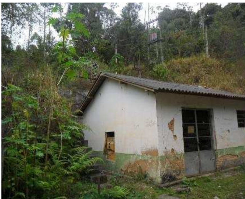
Foto 5 Instalações da casa de máquinas da Lavra São Roque que hoje estão desativadas e abandonadas, município de Caiana (MG).