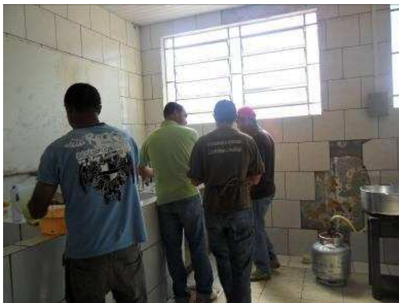
Foto 15 Sindicalizados do STR de Espera Feliz preparando o almoço para a reunião das mulheres associadas realizada no Educandário Sacramentino (Seminário).

mobilizaram para fazer o almoço, possibilitando a participação das mulheres na reunião (fotos 15 e 16):