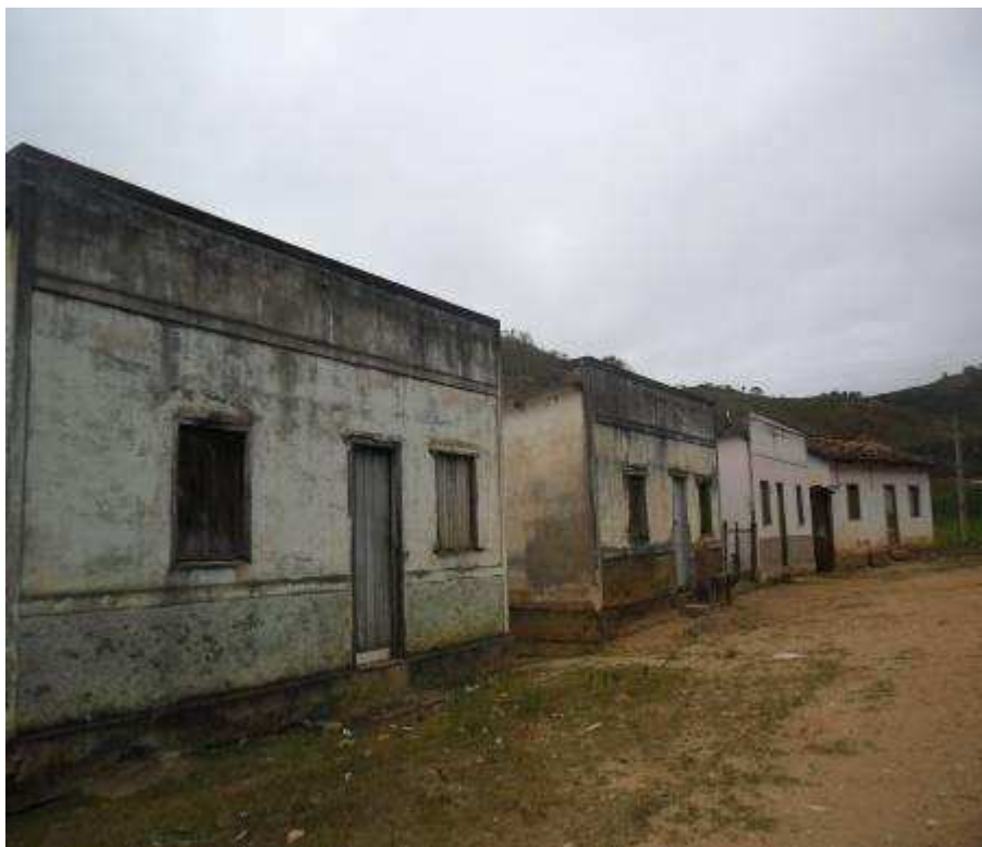
Foto 6 Pequena vila onde se instalavam os trabalhadores da Lavra São Roque hoje ocupadas por trabalhadores rurais da região, Caiana – MG.