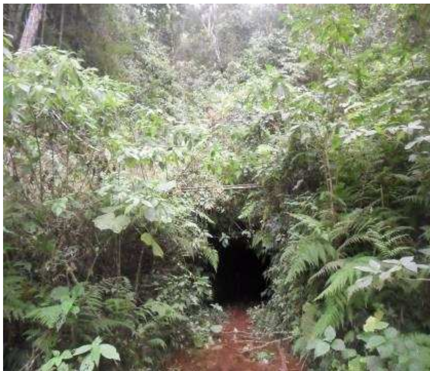
Foto 4 Entrada da Lavra São Roque, município de Caiana – MG.