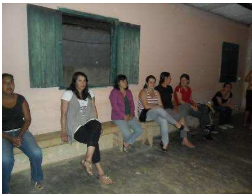
Foto 13 Reunião de base do STR Carangola, Comunidade Cafarnaum