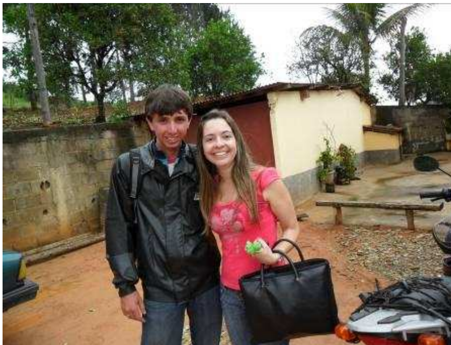
Foto 26 ACS acompanha uma entrevista realizada na Comunidade Serra da Galdina (município de Carangola).