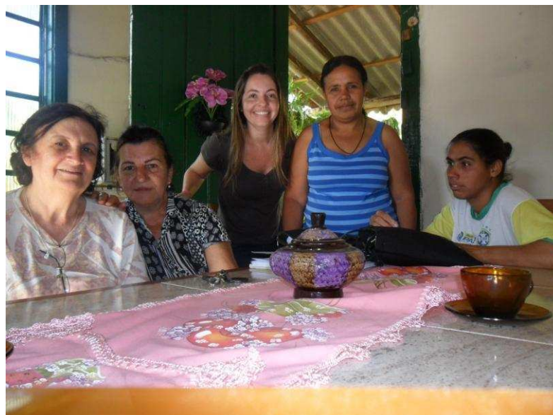
Foto 21 Grupo de mulheres sindicalizadas do STR de Carangola em reunião na comunidade Ponte Alta.