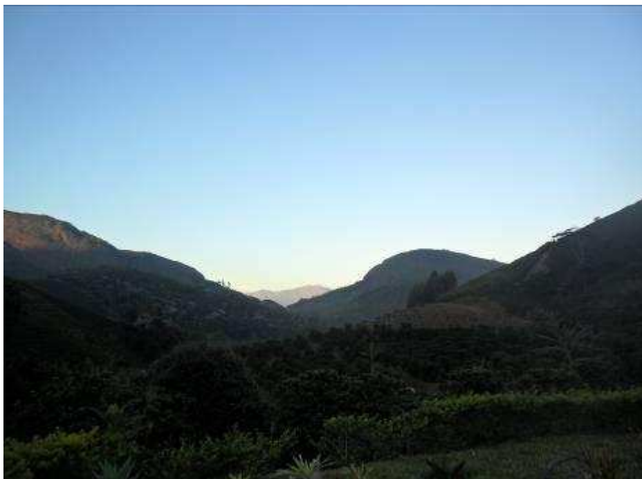
Foto 7 Serra da comunidade Grumarim, município de Caparaó – MG.