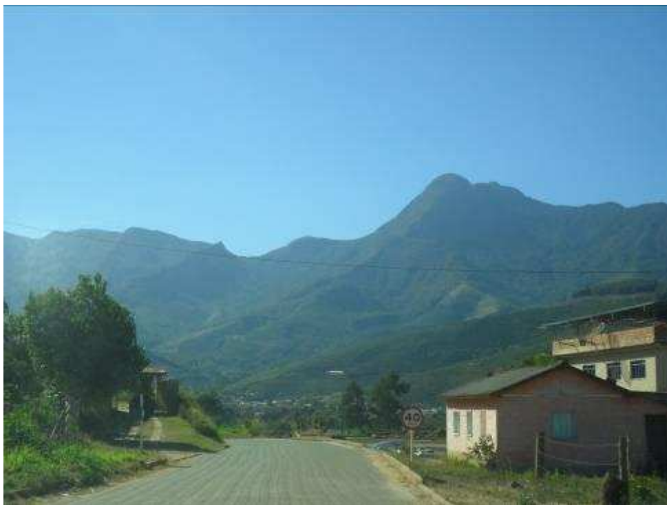
Foto 11 Comunidade de Paraíso, divisa do município de Espera Feliz com o Estado do Espírito Santo.