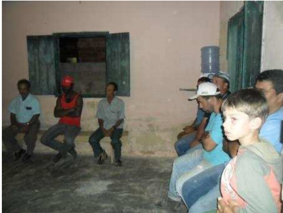
Foto 14 Reunião de base do STR Carangola, Comunidade Cafarnaum

Em ambas situações emerge a dicotomia entre os papéis sexuais exercidos na sociedade e que parece, como destaca Nicholson (1987) reificadora da distinção público/privado percebendo-a como rígida e atemporal: a mulher não se agrupa aos homens pois não se vê capaz de participar de decisões que dizem respeito ao mundo público, restrito aos homens. Na outra situação, os homens realizam o serviço doméstico de preparar o almoço para que as mulheres possam deixar o espaço privado – resignado a elas – e participar do mundo público, ou seja, das reuniões do STR.