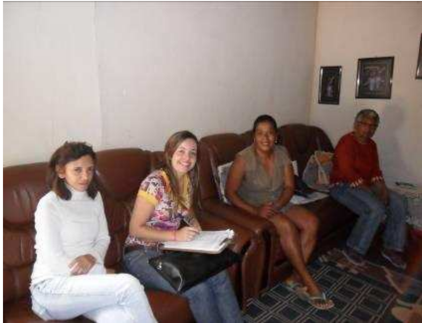
Foto 25 ACS acompanha uma entrevista realizada na Comunidade Lacerdina (município de Carangola).