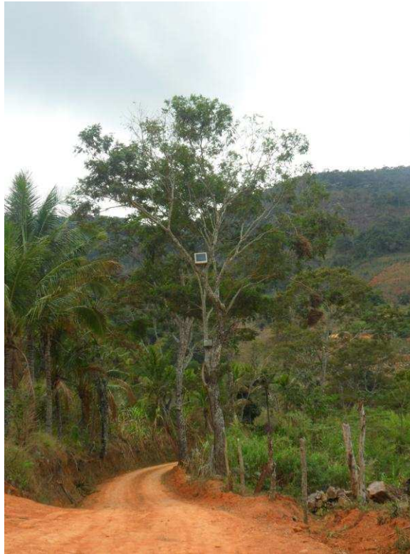
Foto 19 Árvore “sinalizada” com um monitor e um televisor indicava o caminho para a casa de uma das entrevistadas. Comunidade Papagaio (Município de Carangola).