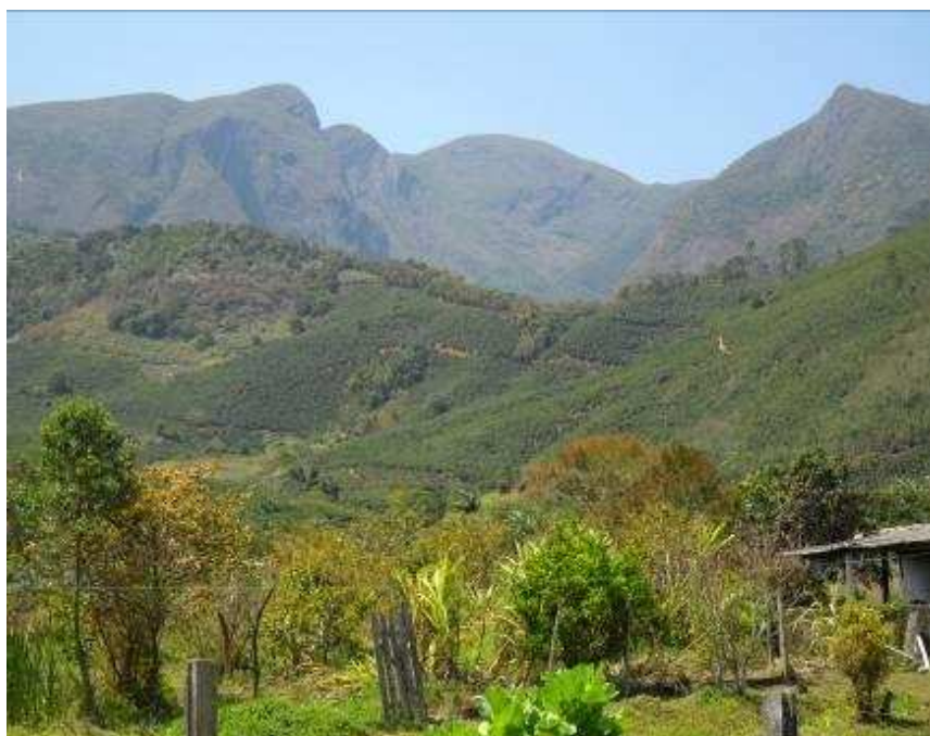
Foto 2 Ao fundo a formação rochosa denominada “Face de Cristo”, município de Alto Caparaó.

Em 1982, pela Lei nº 8.2855, o Distrito de Caparaó Velho passou a se chamar Alto Caparaó e através do plebiscito popular realizado em 1995, emancipou-se do Município de Caparaó. A região apresenta alguns fatos históricos relevantes, como a chamada Guerrilha de