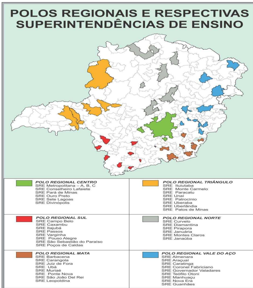
Figura 1 – Localização dos Polos Regionais e respectivas SREs de Minas Gerais.