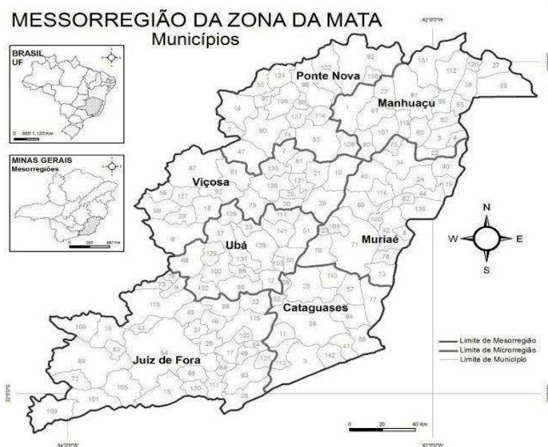
Figura 1: Localização da mesorregião Zona da Mata, Minas Gerais, Brasil.

microrregiões (Cataguases, Juiz de Fora, Manhuaçu, Muriaé, Ponte Nova, Ubá e Viçosa) e cento e quarenta e dois municípios, conforme Figura 1 (IBGE, 2010).