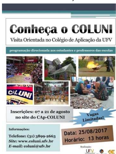
Figura 3 – Cartaz do “Conheça o Coluni” em 2017