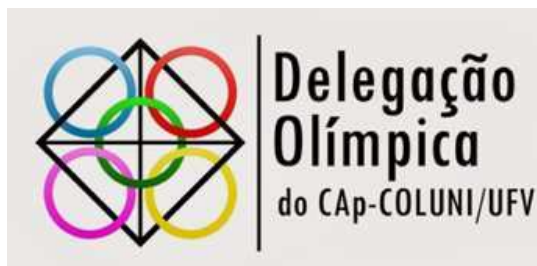
Figura 4 – Logotipo da Delegação Olímpica