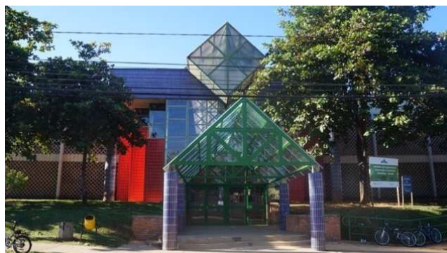
Figura 1 – Frontispício do edifício do CAP-Coluni