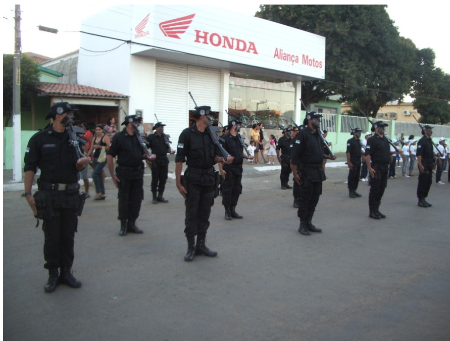
Figura 11: Grupo Tático de Operações Especiais da Polícia Militar se prepara o desfile. Pesquisa de campo, 2009.

Com eles, uma miscelânea de personagens e carros alegóricos, puxados por tratores, ganharam as ruas. Ali estavam: índios, escravos, bailarinos, indianas, dançarinos do maracatu-rural, soldados romanos, figuras religiosas, cangaceiros, dentre centenas de outros personagens que proporcionaram um desfile com mais de seis horas de duração.