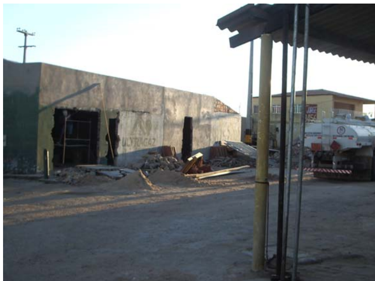
Figura 6: A Cabrobó passa por um acelerado processo de crescimento econômico. Pesquisa de campo, 2009.

passagem pela cidade, não me senti observado, ninguém perguntou de que família eu sou, quem são meus parentes e pouca gente quis saber o que eu estava fazendo no município 42 .