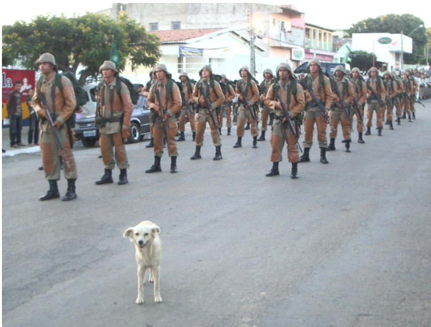
Figura 10: Pelotão do Exército Brasileiro compõe o desfile de mais de seis horas. Pesquisa de campo, 2009.