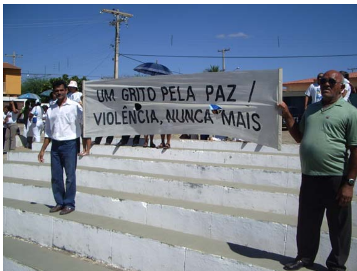
Figura 1: Moradores da cidade pedem paz. Pesquisa de campo, 2009

O sol bate, cada vez mais, com menos piedade, procuro uma sombra. A procissão volta a caminhar, contorna todo o centro da cidade e segue rumo ao bairro Sub-Estação. Mais algumas quadras de caminhada e todos dão as mãos e rezam um Pai Nosso.