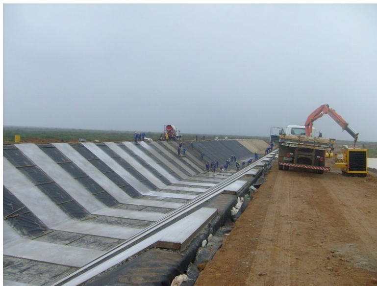
Figura 8: Construção do canal de transposição das águas do Rio São Francisco. Pesquisa de campo, 2009.

Se ainda existe essa forma comum de controle social na localidade, pelo menos para os que chegam de fora no município, está enfraquecida. Diante da circulação de tantas pessoas e da mudança da rotina local é muito difícil saber sobre as incursões de estranhos, que há pouco tempo eram sempre objeto de observação e julgamento de outros moradores. O mesmo não posso dizer com relação ao controle do trânsito dos próprios moradores no local, que pressuponho não ter sido modificado do mesmo modo.