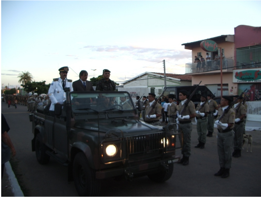
Figura 9: Desfile de comemorativo em Cabrobó: autoridades abrem a solenidade. Pesquisa de campo, 2009.