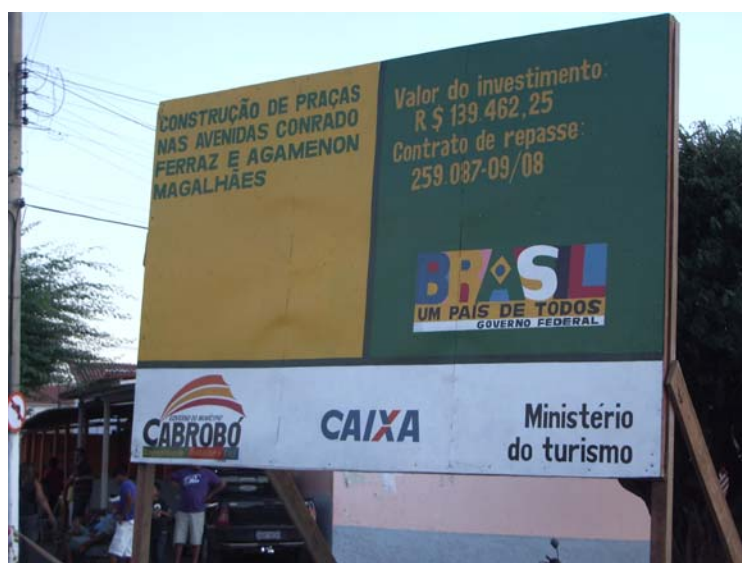
Figura7: A cidade recebe as contrapartidas do governo federal. Pesquisa de campo, 2009.