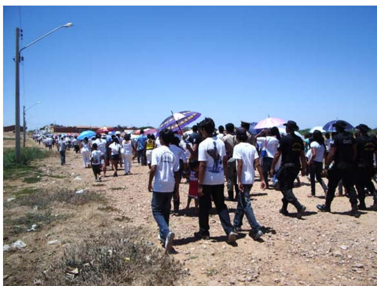
Figura 2: Romeiros seguem em passeata. Pesquisa de campo, 2009