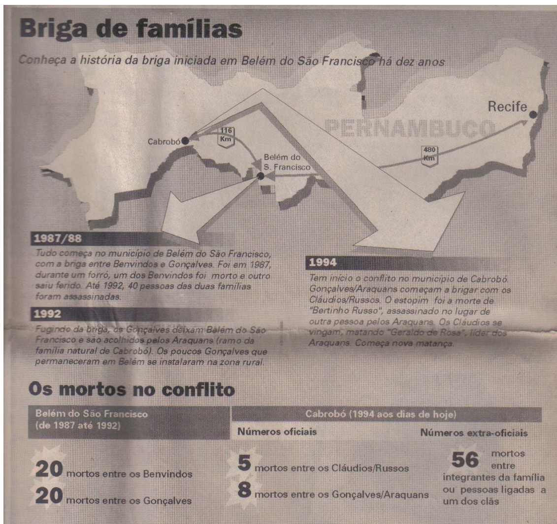
Figura 3: Jornal do Commercio. Cidades, Recife, 2 de março de 1997.