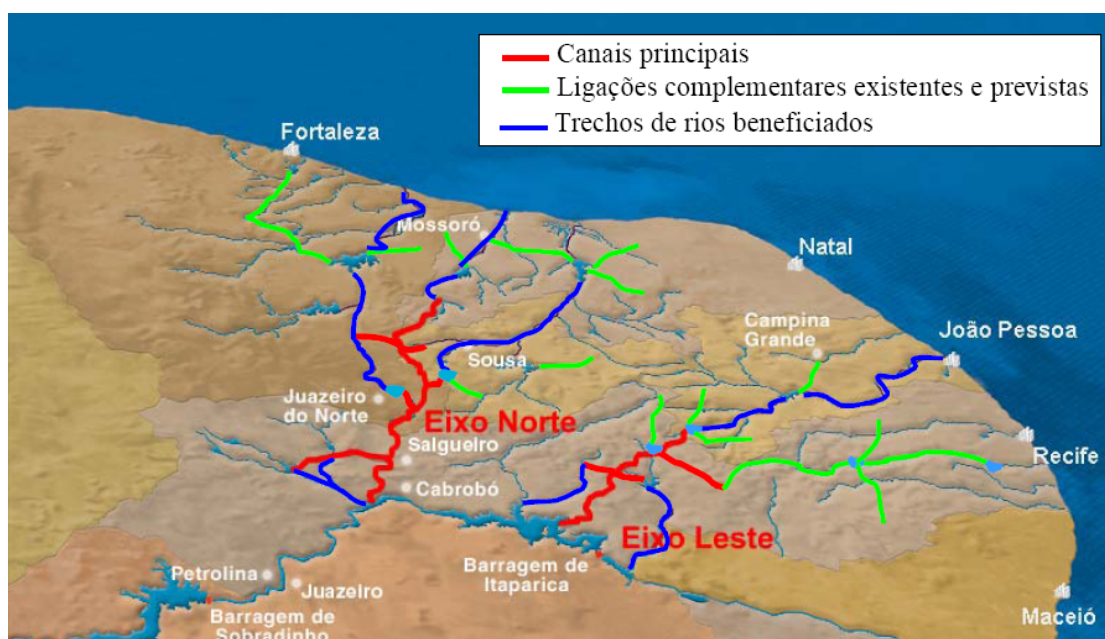
Figura 5 – Plano de Integração do Rio São Francisco com as Bacias Hidrográficas do Nordeste

Ao todo, ainda segundo o Ministério da Integração Nacional, serão construídas nove estações de bombeamento de água, uma delas com mais de 280 metros de elevação, 30 barragens, 27 aquedutos e mais de 600 km de canais, gerando mais de 5 mil empregos diretos. O projeto está dividido em 14 lotes cujas obras mobilizam 10 consórcios, num total de 74 empresas executoras e ainda cerca de 800 soldados do exército 40 .