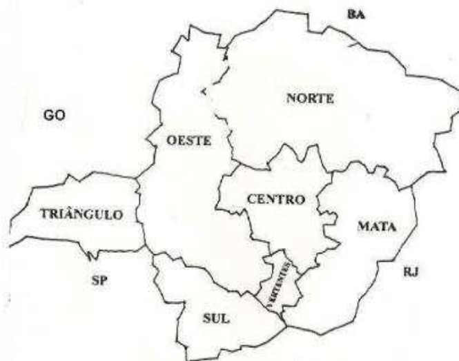
Principais Regiões de Minas Gerais (1889/1930)