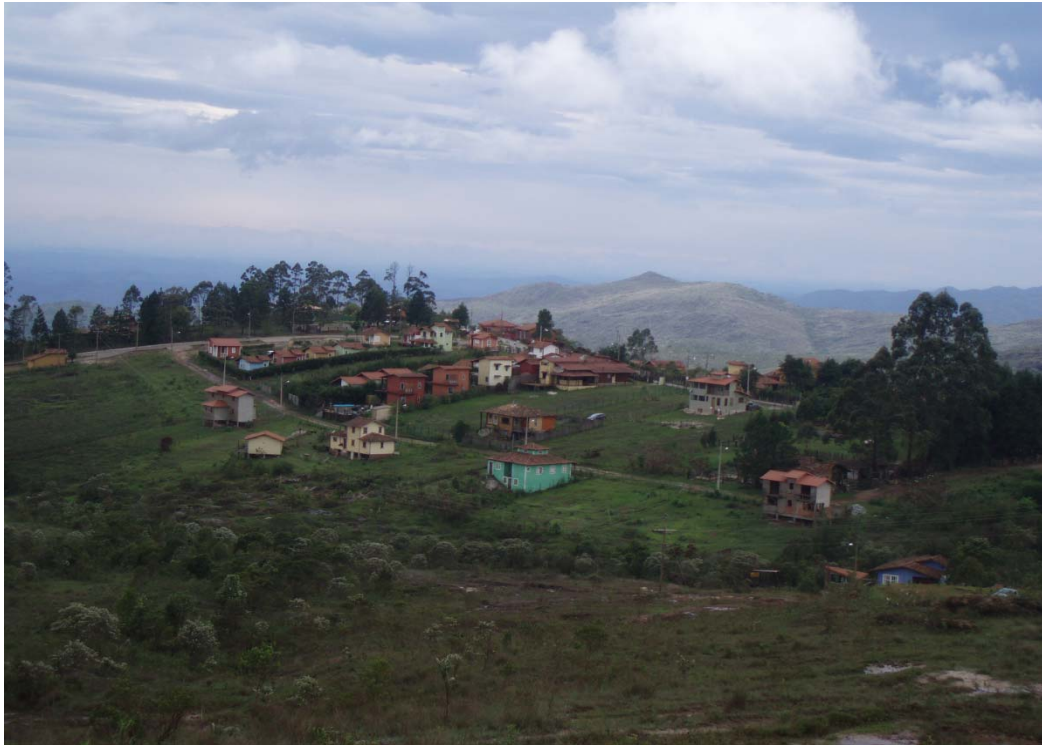
Figura 5: Vista parcial da área central do Distrito. Residências de nativos.