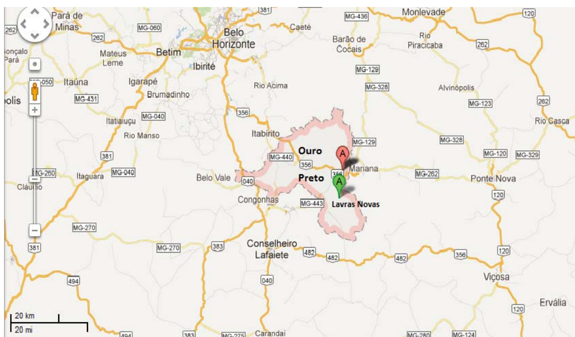
Figura 1: Mapa de localização do Município de Ouro Preto e do Distrito de Lavras Novas