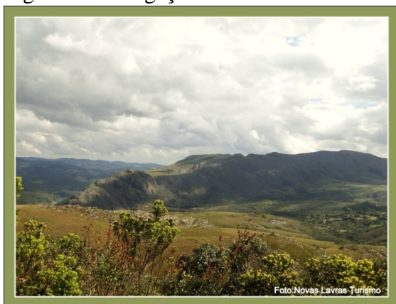
Figura 6: Divulgação

televisivos. Além disso, o distrito conta com um site próprio para a divulgação do turismo local (CHAVES, 2011). Também a criação de uma página no site de relacionamento Facebook ajuda na divulgação dos atrativos oferecidos por Lavras Novas. A página é uma iniciativa do Receptivo Turístico local para divulgar fotos e um pouco da cultura do distrito (Receptivo Lavras Novas Turismo, 2012). Como é comum à atividade turística o forte apelo aos imaginários sociais a linguagem e as imagens ganham espaço nos discursos de divulgação da atividade. É preciso construir um conjunto de referências simbólicas que despertem no turista o desejo de visitar o lugar. Assim, a imagem de Lavras Novas está ancorada no jogo simbólico que mistura simplicidade e sofisticação, representada pelas luxuosas pousadas e ambientes rústicos, porém requintados, oferecidos pelos bares e restaurantes do distrito. As nossas observações, apoiadas nas entrevistas, nos mostraram que a simplicidade se torna um produto turístico e alimenta as representações sociais daqueles que se apegam às imagens que demonstram uma vida simples como mulheres que ainda buscam água na bica em latas que transportam na cabeça e se vestem de forma típica, com vestido, calça e toucas feitas de meia calça para deixar os cabelos mais lisos, também nas vacas e cavalos que são criados soltos pelas ruas, tratados como parte da vida da comunidade. O bucólico se tornou um forte convite à visitação do distrito.