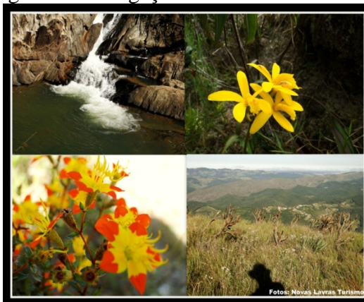
Figura 7: Divulgação