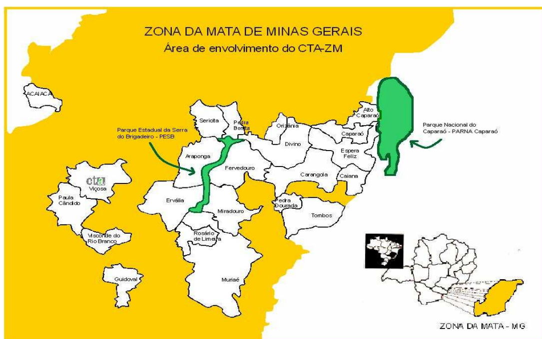
Figura 1 – Área de abrangência do Centro de Tecnologias Alternativas da Zona da Mata.

Na última década têm sido crescentes a articulação, mobilização e parceria dos sujeitos do campo com instituições de ensino na difusão de experiências em agroecologia. Nesse contexto, o CTA-ZM, em parceria com a UFV e as organizações e movimentos sociais/sindicais do Campo, tem ampliado suas iniciativas, com o objetivo de dar visibilidade às experiências em agroecologia na Zona da Mata de Minas Gerais, tendo como base os conhecimentos das famílias agricultoras (CTA-ZM, 2013). Assim, vários projetos têm sido implementados e executados na área de abrangência do CTA-ZM (Figura 1), com os objetivos de dar visibilidade às práticas agroecológicas em curso na região, potencializar novas parcerias na difusão da agroecologia e, assim, compartilhar os diversos saberes engendrados nesse movimento.