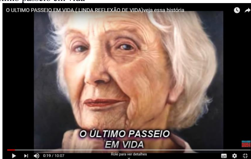
Figura 9 - O último passeio em vida