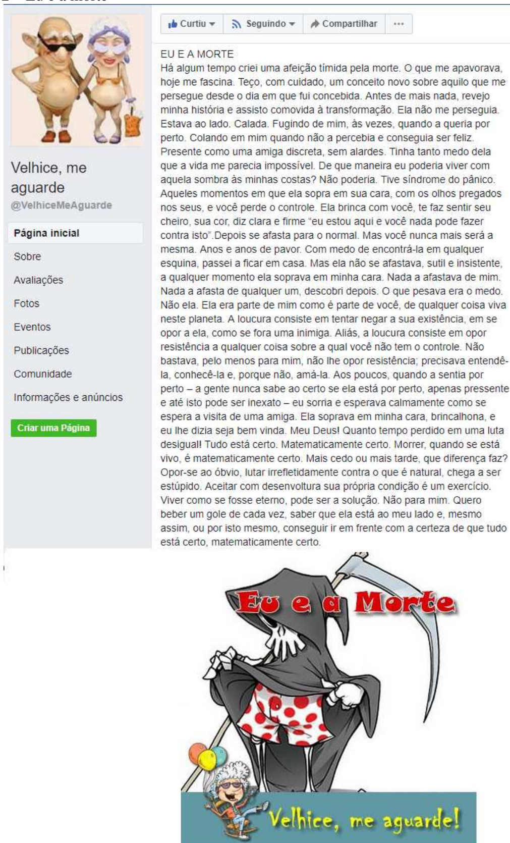
Figura 2 – Eu e a morte