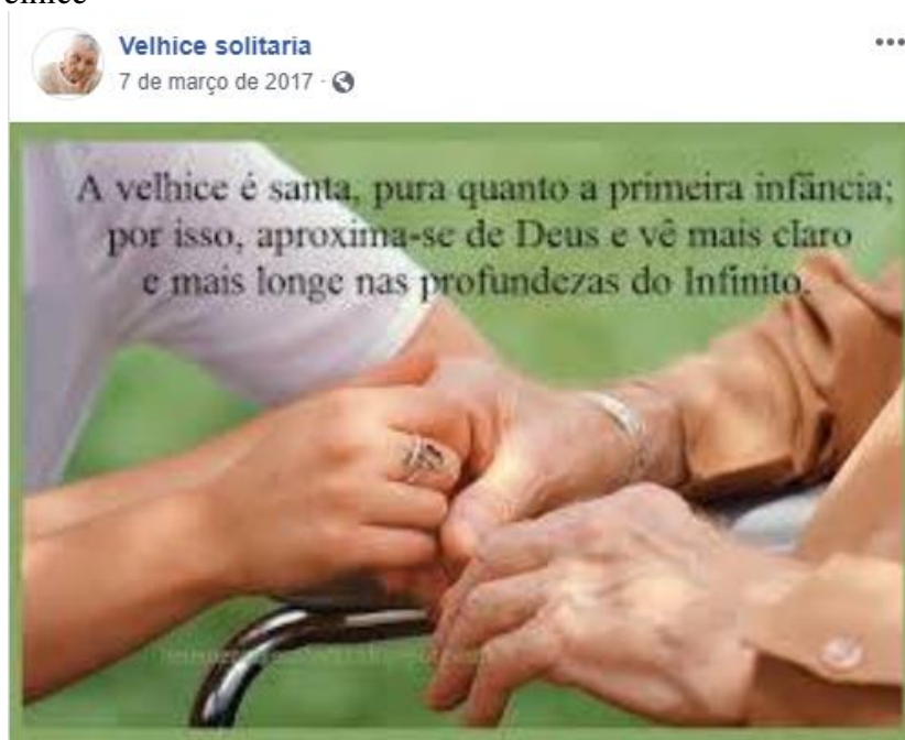
Figura 7 – A velhice