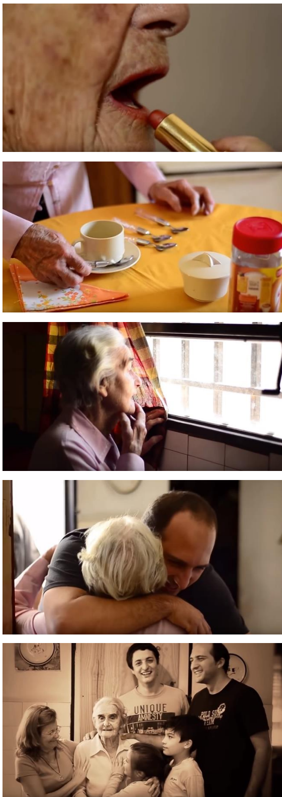
Figura 10 - O Vídeo que fez o mundo chorar/Ser mãe

Fonte: Página “Velhice solitária” (FACEBOOK, 2017).