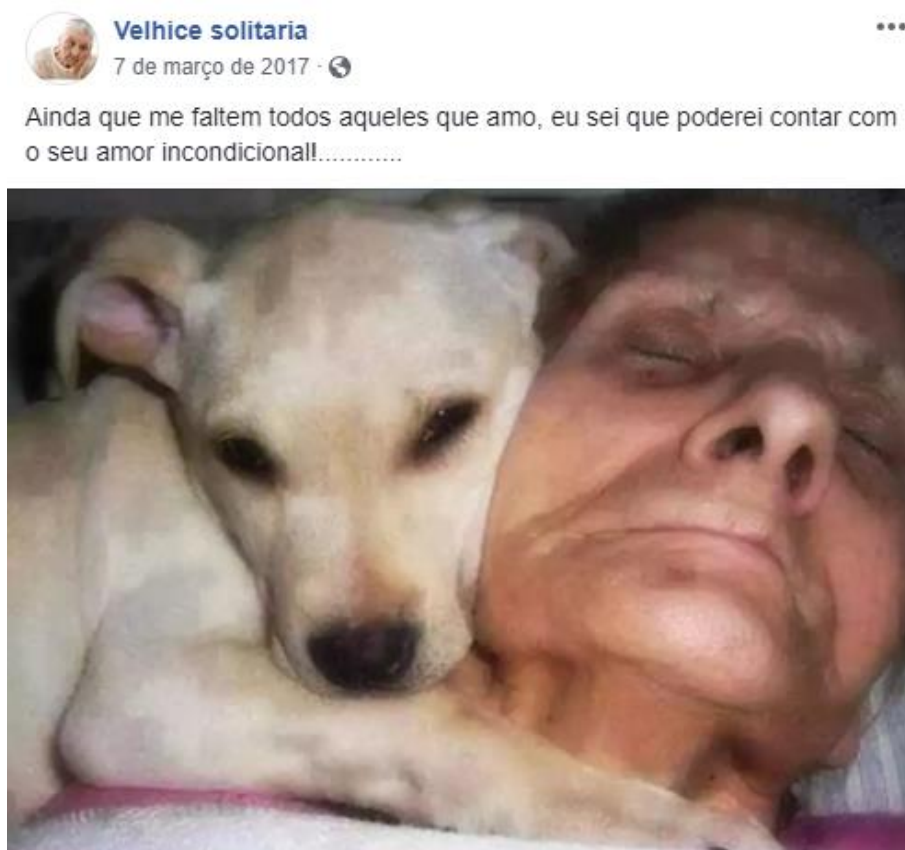
Figura 6 – Amor incondicional