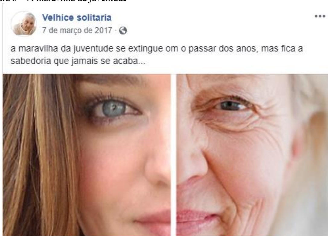
Figura 5 – A maravilha da juventude