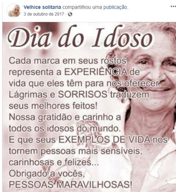
Figura 8 – Dia do idoso