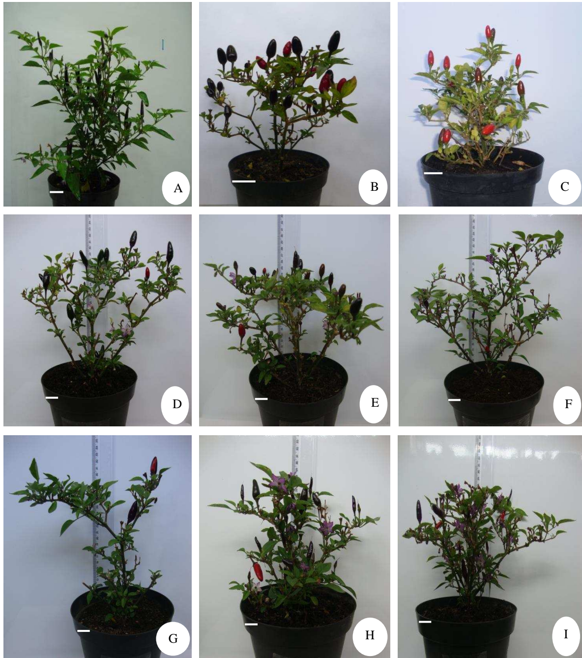
Figura 3 – Diferentes classes fenotípicas observadas em pimenteiras ornamentais ( Capsicum annuum ). A = Genótipo 28 ( F_2 ); B = Genótipo 18 ( RC_1 ); C = Genótipo 20 ( RC_1 ); D = Genótipo 21 ( RC_1 ); E = Genótipo 22 ( RC_1 ); F = Genótipo 1 ( RC_2 ); G = Genótipo 5 ( RC_2 ); H = Genótipo 14 ( RC_2 ); I = Genótipo 16 ( RC_2 ); Barras = 1cm.