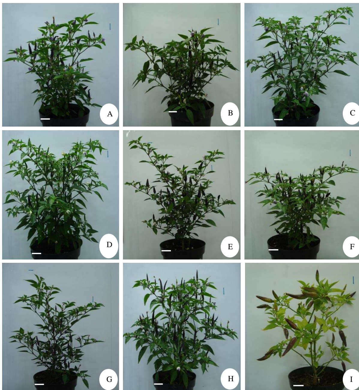
Figura 2 – Diferentes classes fenotípicas observadas em pimenteiras ornamentais ( Capsicum annuum ). A = Genótipo 2 ( F_2 ); B = Genótipo 7 ( F_2 ); C = Genótipo 8 ( F_2 ); D = Genótipo 16 ( F_2 ); E = Genótipo 17 ( F_2 ); F = Genótipo 20 ( F_2 ); G = Genótipo 23 ( F_2 ); H = Genótipo 27 ( F_2 ); I = Genótipo 44 ( F_2 ); Barras = 1cm.