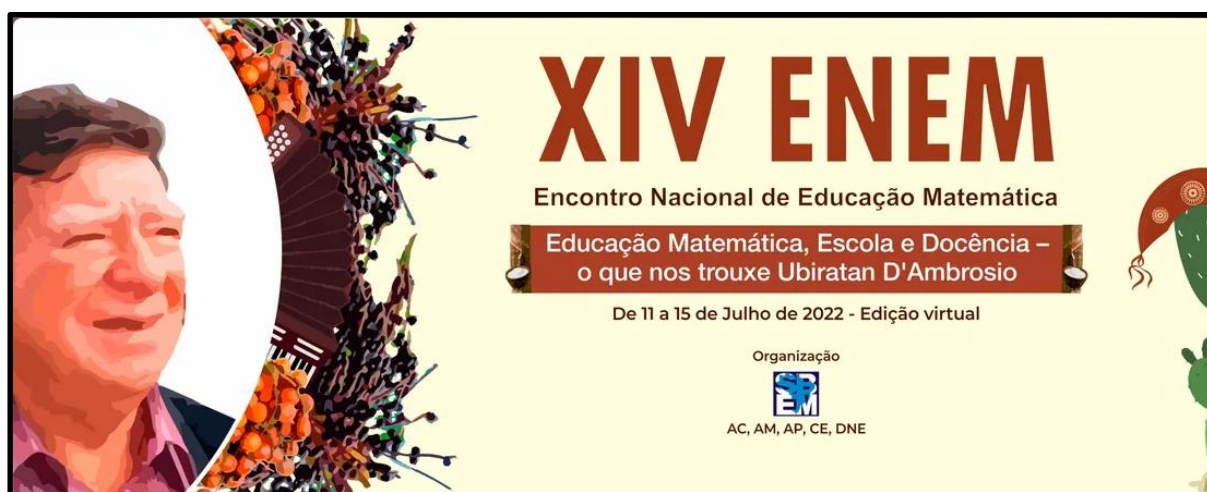
Figura 2: Imagem de divulgação do XIV Encontro Nacional de Educação Matemática