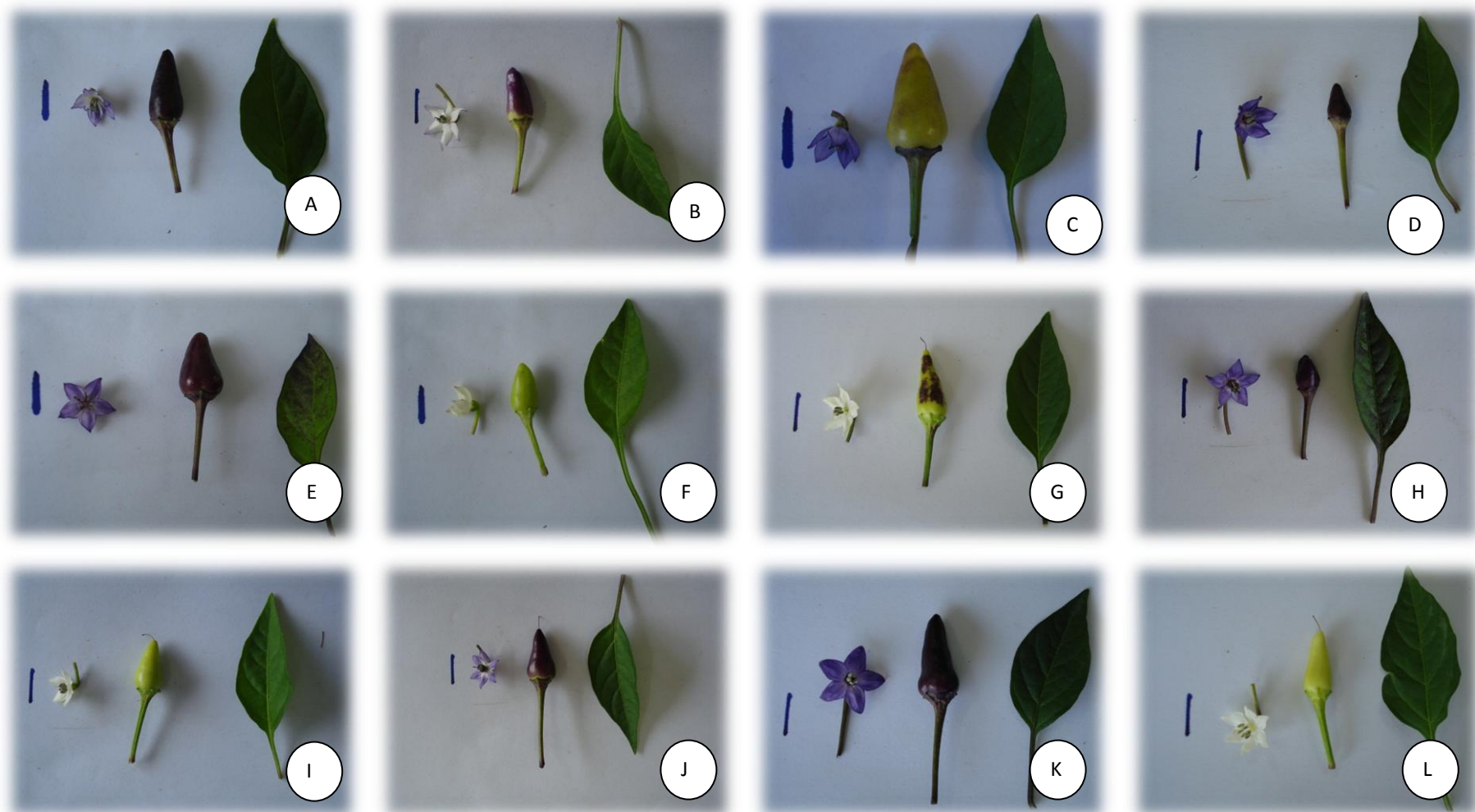
Figura 3- Classes fenotípicas dos genitores K (P1) e L (P2), J (F 1 ), e de A a I classes fenotípicas observadas na geração F 2