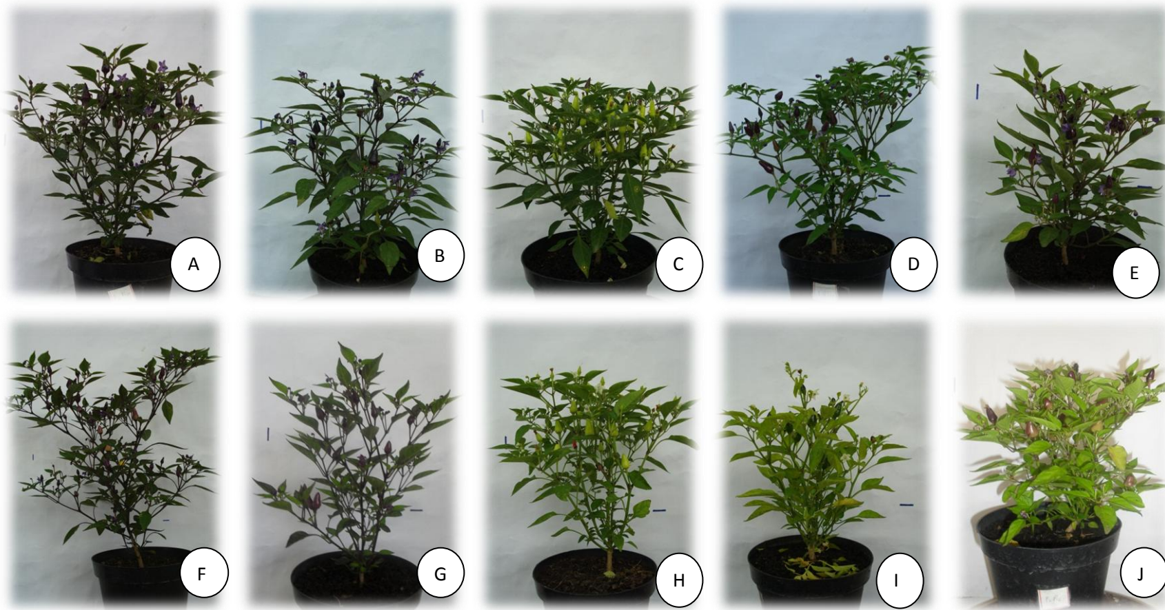
Figura 2- Genótipos representando as diferentes classes fenotípicas observadas na geração F 2 .