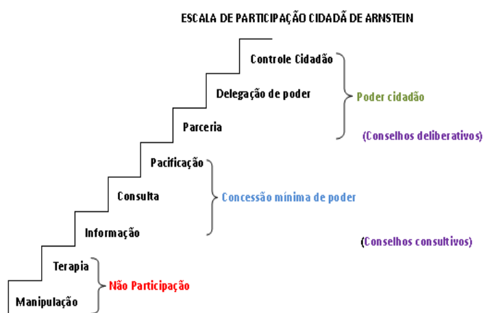
Figura 3 - Escada de Participação Cidadã de Arnstein (2002)

executados e quais benefícios estarão disponíveis, constatou-se que os representantes das associações do CMDRS de Luz estariam nos níveis de participação 3 (informação) e 4 (consulta). Nestes níveis, segundo Arnstein (2002), há uma mínima concessão de poder, que permite àqueles desprovidos de poder ouvir e serem ouvidos. No entanto, se a informação for apenas via mão única, ou seja, dos técnicos para os cidadãos, e se a solicitação de opinião, a consulta, não estiver interligada a outros meios de participação, não se consegue garantir que as opiniões dos sem poder sejam aceitas pelos que detêm o poder.