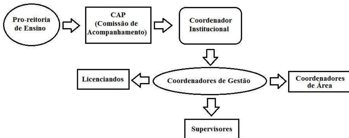
Figura 1 – Estrutura organizacional do PIBID-UFV

O desenho definido para o PIBID-UFV e a sua configuração pode ser ilustrado do seguinte modo: