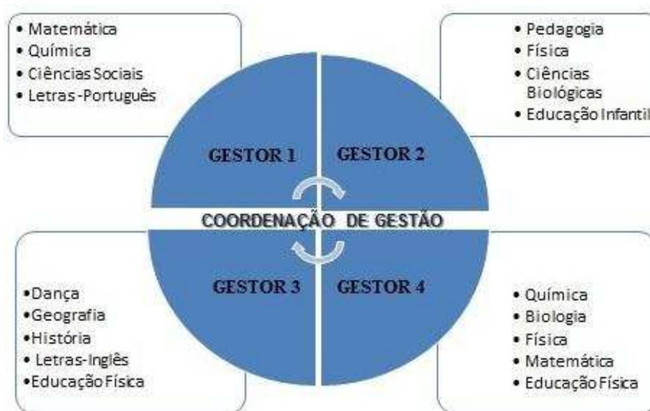
Figura 2 – Organização do trabalho dos coordenadores de gestão do PIBID-UFV

Apresentando aquela configuração antes descrita, com o trabalho da coordenação de gestão do PIBID-UFV dividido entre quatro gestores, podemos assim ilustrar sua organização: