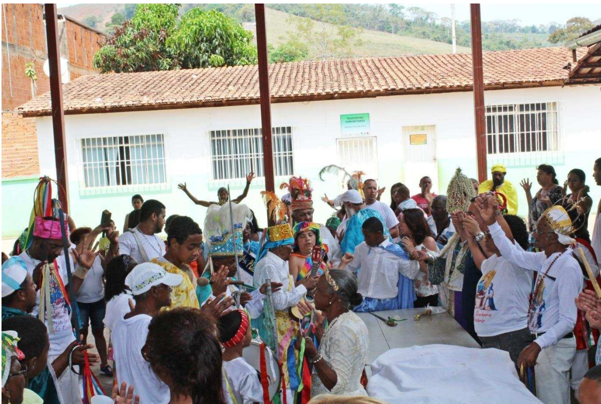
Imagem 11: Almoço coletivo entre os Congadeiros e comunidade