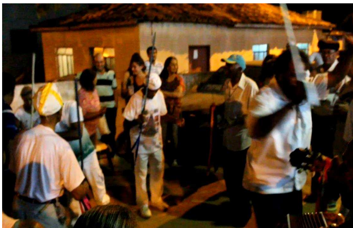
Imagem 13: Roda dos Congadeiros e giro com a espada.

Neste momento, os homens se afastaram do mastro colorido, e começaram a dançar em roda com as espadas voltadas ao céu, realizando giros em torno do próprio corpo, e depois voltavam ao centro da roda, olhando uns aos outros. Observa-se na imagem a seguir, o congadeiro à direita realizando um giro com o braço direito estendido, segurando a espada.