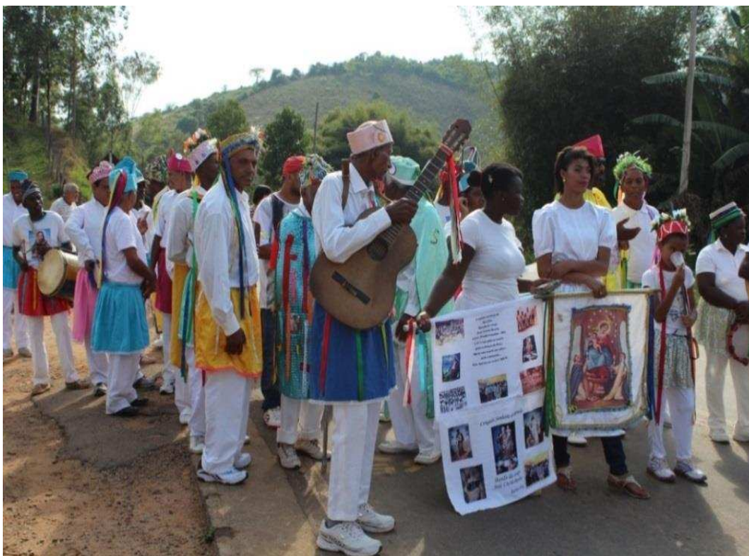
Imagem 7: Preparação para a procissão dos Congadeiros de SMA-MG

Depois disso, a procissão foi iniciada e as imagens de Nossa Senhora do Rosário, São Benedito e Santa Efigênia foram carregadas por alguns dos integrantes. Os músicos levaram seus instrumentos, e os demais participantes, vestidos com as roupas características e objetos do Congado, seguiram o cortejo.