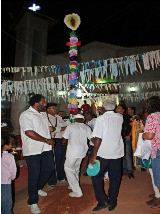
Imagem 1: Congadeiros ao redor do mastro