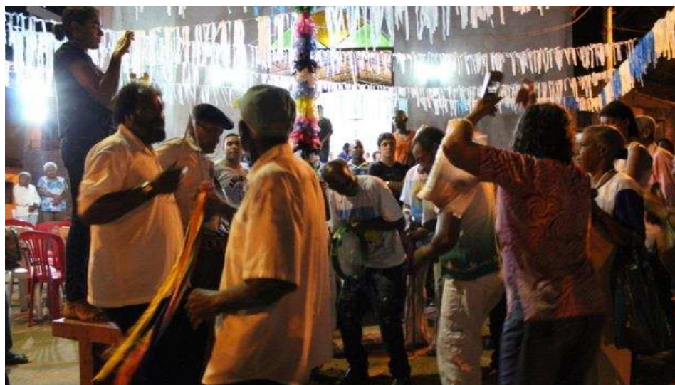
Imagem 5: Apresentação do lado de fora da igreja Senhora do Rosário em volta do mastro.

Após a missa, já do lado de fora da igreja, os Congadeiros colocaram o mastro e dançaram ao redor, batendo as espadas e tocando os instrumentos.