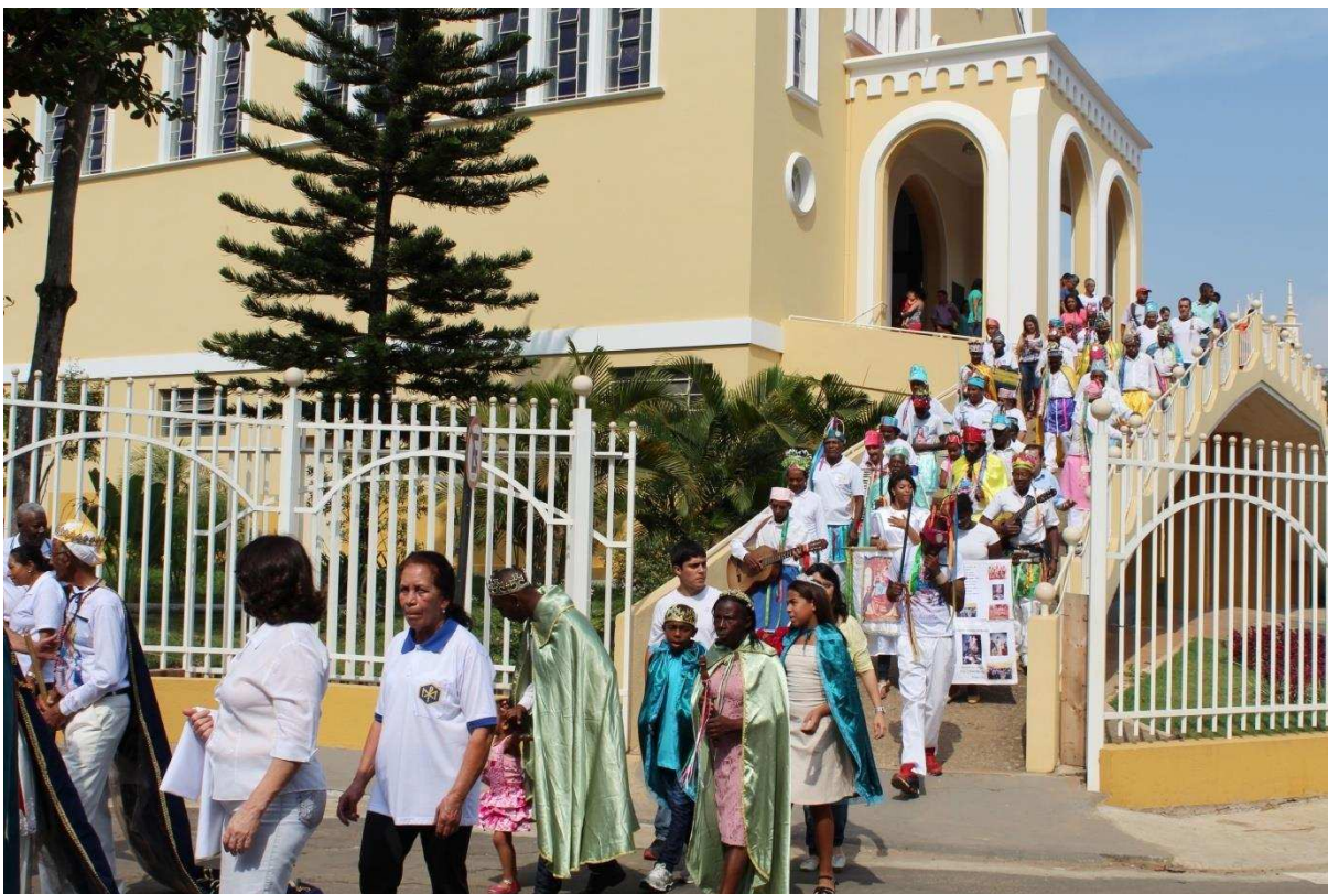
Imagem 9: Congadeiros e comunidade na procissão