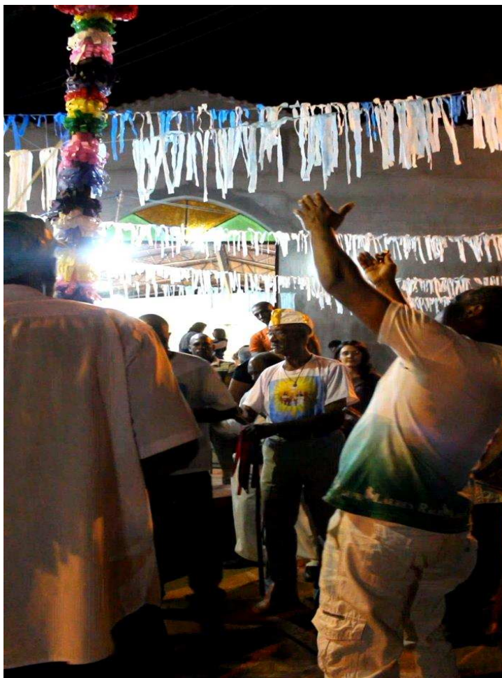
Imagem 12: Mastro erguido e dança em volta dele com os comandos do capitão.