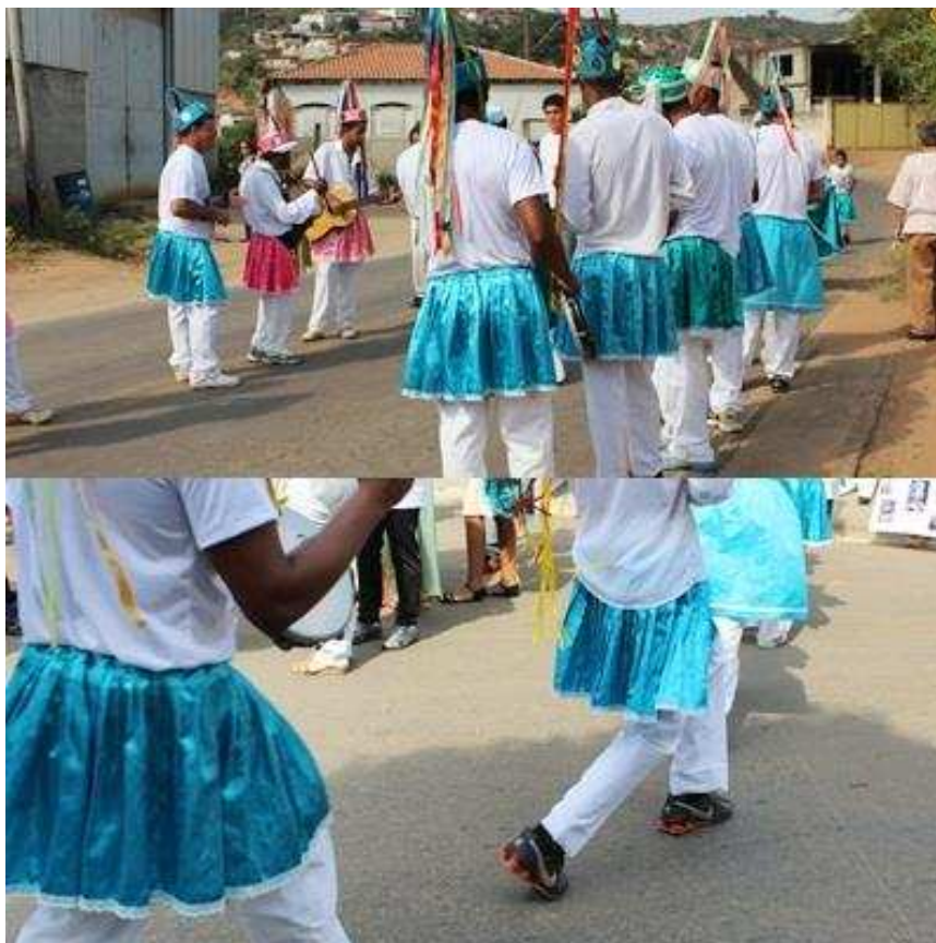
Imagem 16: Dança na rua: Fileiras e batidas dos pés.