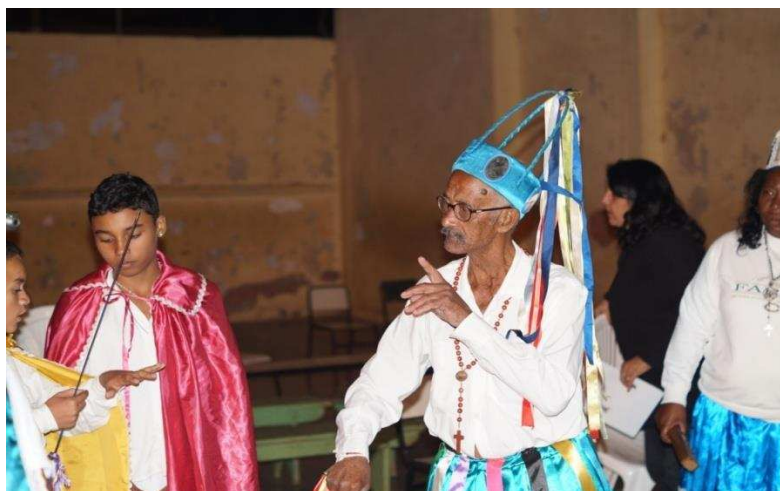
Imagem 19: A gestualidade presente no corpo do idoso e seus ensinamentos aos jovens.

A falta de fé e os meios de comunicação são destacados como possíveis motivos para o desinteresse dos jovens da região em participar. No entanto, a perda da tradição pode estar ameaçada, devido ao desinteresse dos mesmos por outros motivos. Destaco também a falta de paciência que os jovens muitas vezes apresentam, ou seja, com as informações rápidas no mundo contemporâneo, os jovens tendem a não terem paciência para parar e ouvir histórias de seus antepassados. Nesse caminho, a oralidade também se perde.