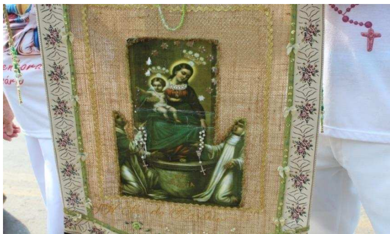
Imagem 2: Nossa Senhora do Rosário carregada pelos Congadeiros