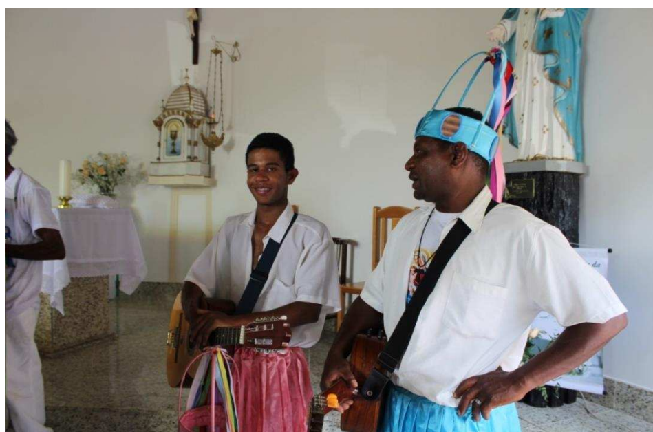
Imagem 2: Pai e filho, Violeiros do Congado de São Miguel do Anta-MG.

Tem 32 anos que participo. Ah, eu era da dança, mas o companheiro não quis mais, passou pra crente. E a turma começou a vacalhar muito, eu larguei. Veio de Cachoeiro uma turma e insistiu e eu disse ah, não vou participar não, mas ai eu entrei e pretendo sair só quando Deus lembrar de mim. O que eu puder fazer eu vou fazer, porque aqui não existia comemorar o dia 13 de maio não. No dia 13 de maio tem a comemoração da libertação da escravidão (Rei, 89 anos).