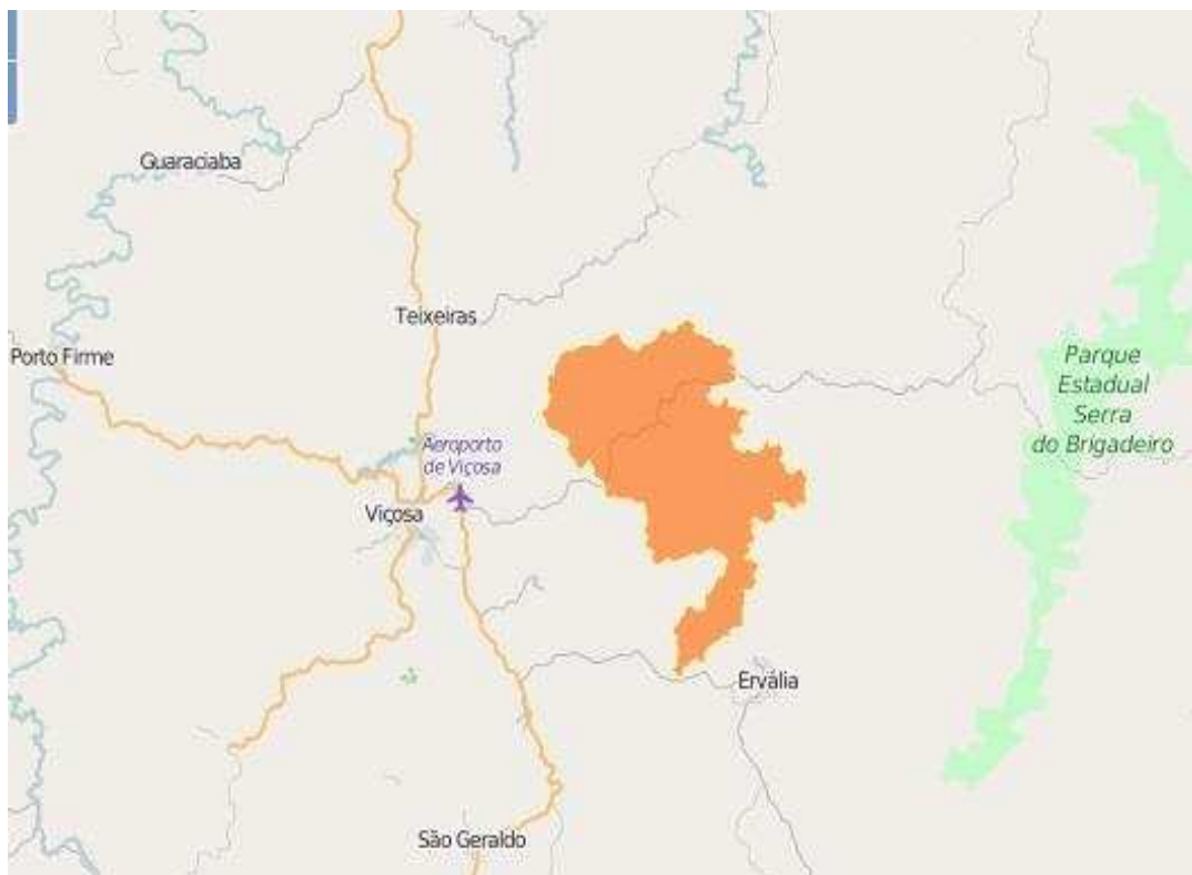
IMAGEM 1: Mapa da cidade de São Miguel do Anta-MG e cidades vizinhas.