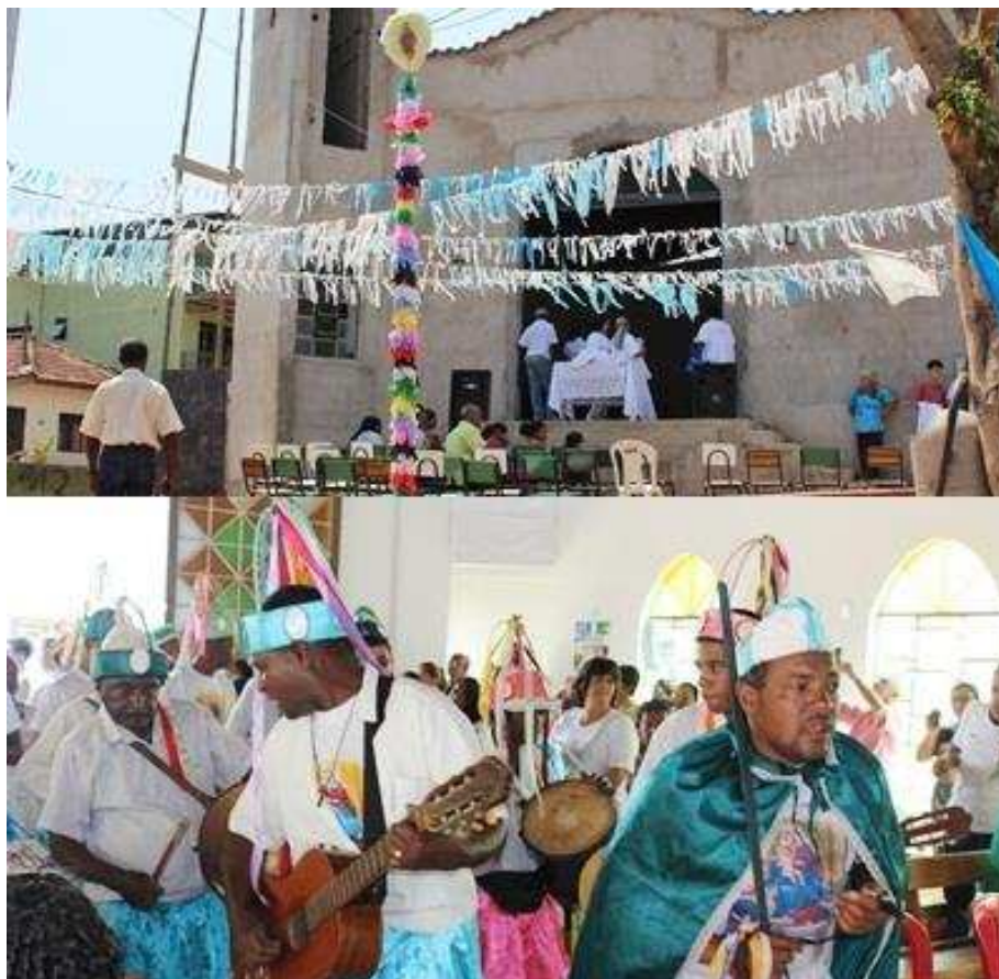
Imagem 17: Igreja do Rosário de SMA e os Congadeiros com seus adereços.