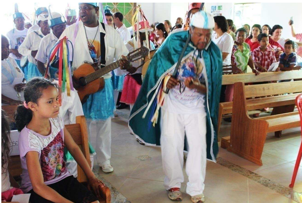
Imagem 12: Entrada na igreja do Rosário com o Capitão puxando os versos