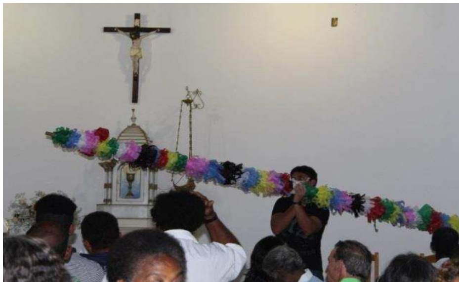
Imagem 4: Mastro dentro da igreja de Nossa Senhora do Rosário em SMA-MG.

Ao iniciar a missa, os Congadeiros entraram na igreja com o mastro colorido e com a imagem de Nossa Senhora do Rosário nas mãos. Após a celebração, o mastro foi posicionado do lado de fora e a comunidade pode observar a apresentação dos Congadeiros ao redor do mastro, momento em que eles dançaram e cantaram.