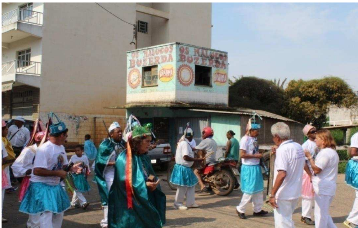
Imagem 10: Congadeiros caminhando de “costas” pedindo permissão para passar na encruzilhada

Nessa caminhada, esta ação é reproduzida desde os mais velhos a crianças. Nota-se uma criança na foto abaixo, realizando a mesma movimentação da caminhada, imitando os mais velhos.