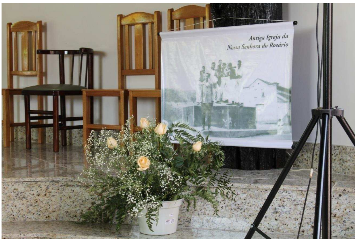
Imagem 10: O pôster destaca a antiga igreja do Rosário da cidade de SMA