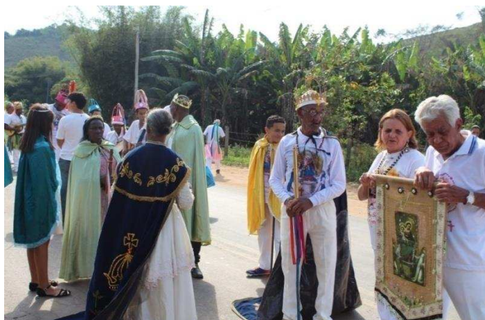
Imagem 18: Participação dos brancos no Congado, com a imagem de NSR.

Meu pai não era dançador porque na época do meu avô o branco não dançava Congado porque o Congado é uma dança de negro, uma dança de escravos que foi criado na África então o branco não dançava. Por exemplo, meu pai tinha uma cor mais clara, então pelo meu avô meu pai já não servia porque ele era claro e não dançava, aí veio os filhos e saíram tudo escuro, que é minha mãe negra, descendente de escravos, aí veio desde os mais velhos, meu irmão mais velho, as irmãs mais velhas acompanhavam e carregavam o estandarte e depois passava para as irmãs mais novas e assim para os irmãos que vinha depois (Violeiro, 46 anos).