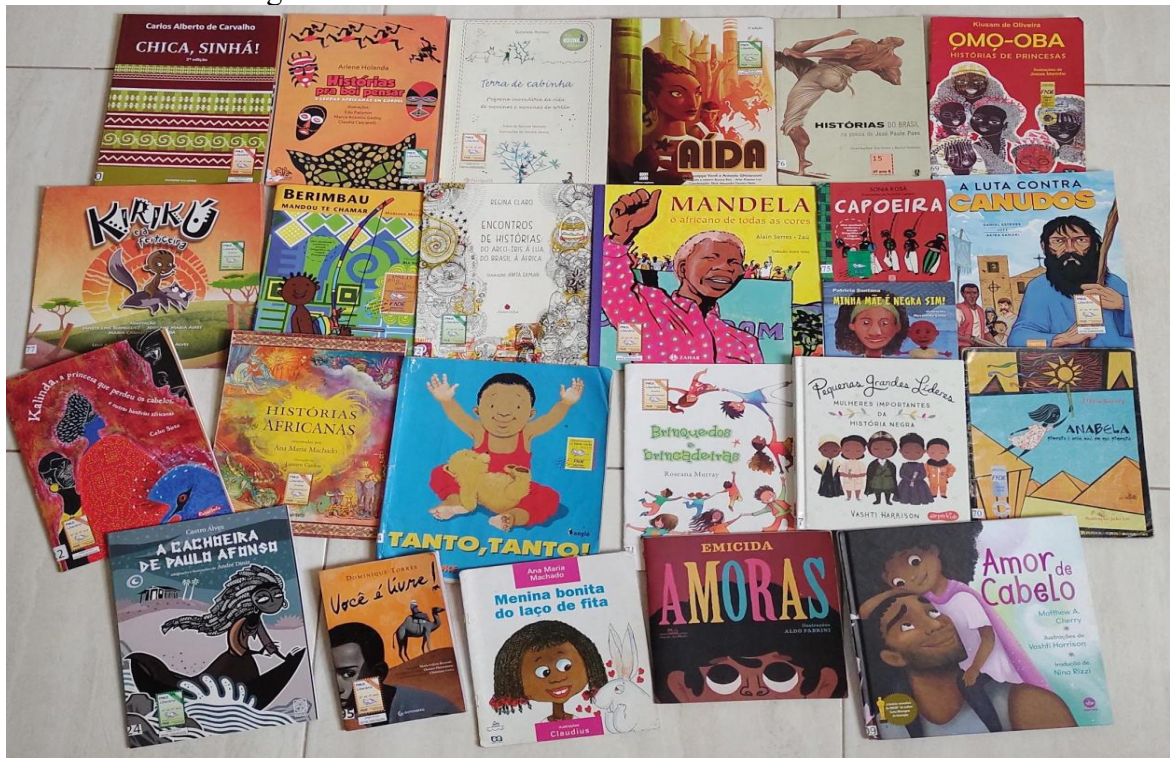
Figura 1- Livros selecionados na biblioteca da escola.