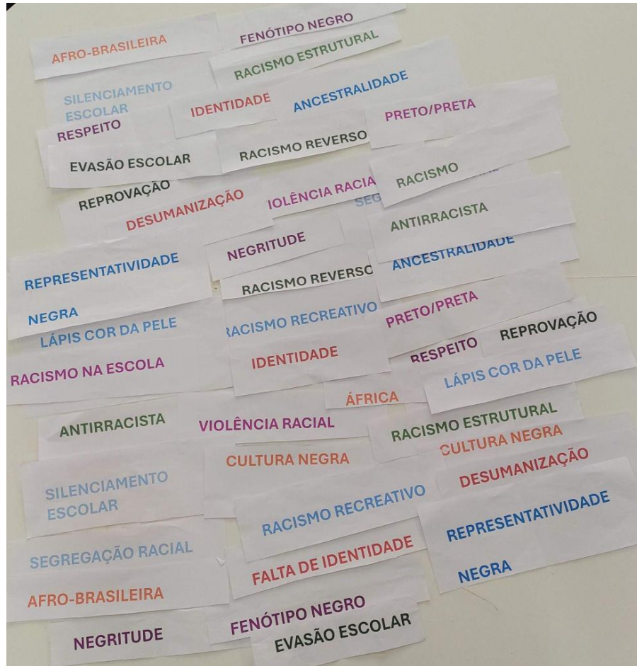
Figura 2 - Palavras geradoras usadas na primeira roda de conversa de conversa.

trabalho. Os(as) participantes foram informados(as) de que, mesmo não tendo escolhido as palavras desejadas, eles poderiam se expressar a qualquer momento. Observamos, contudo, que nem todos os presentes se expressaram possivelmente por não se sentirem à vontade ou por não se interessarem pela temática.