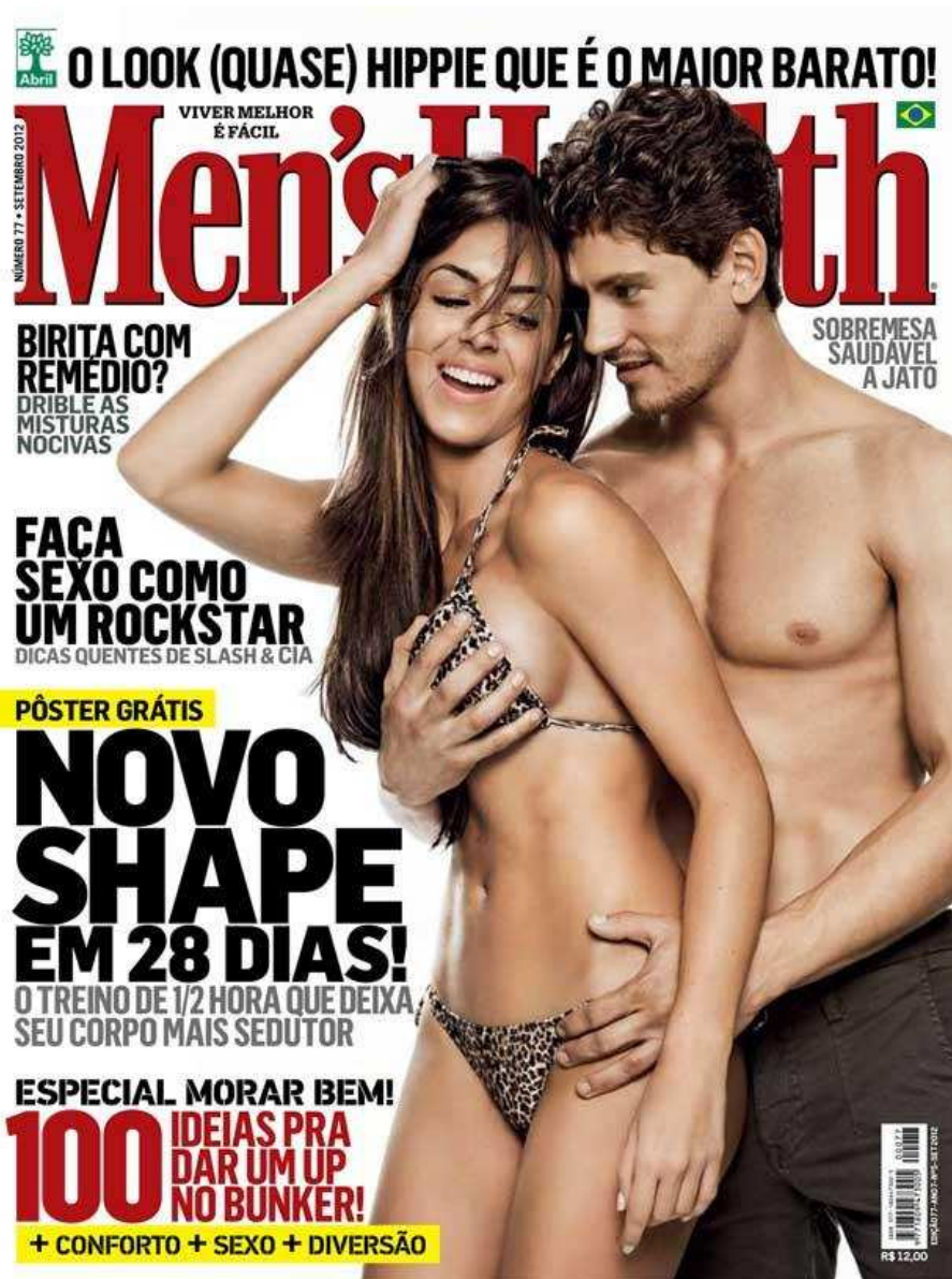
Figura 4. Capa da revista Men's Health em setembro de 2012