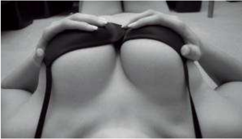
Figura 7. Conquiste o peito dela

Fonte: Men's Health (2012, nº 70, p.90).