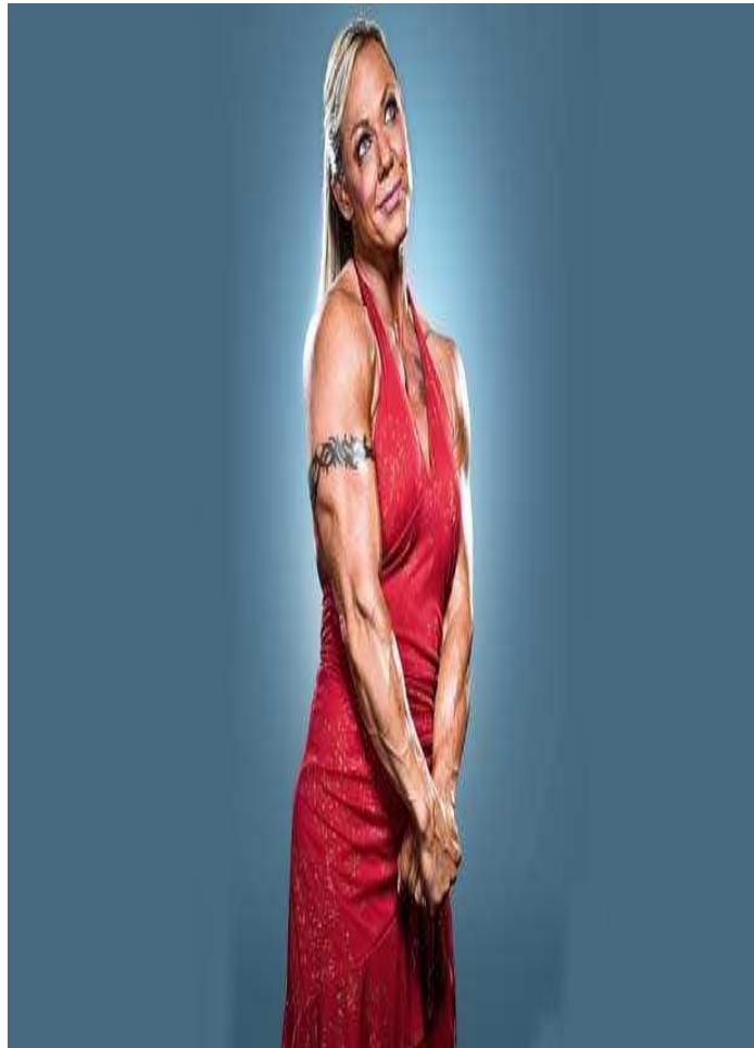
Figura 3.Loucademia MH

Fonte. Men's Health (nº 83, março de 2013, p. 122).