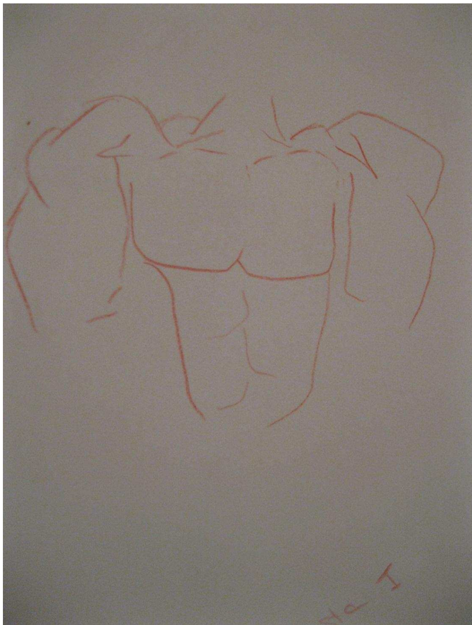
Figura 2. Desenho corporal feito em 12/07/2013

Partindo dessa constatação, quando lançarmos um olhar sobre as representações atuais sobre o corpo masculino, podemos inferir ser recorrente sua associação com músculos inflados, como mencionado na Men's Health e também ilustrado por um dos nossos informantes, técnico de informática, 25 anos, 1, 80 m de altura e 83 kg (Figura 2).