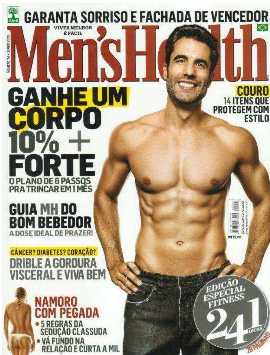
Figura 9. Capa da revista Men's Health em junho de 2012