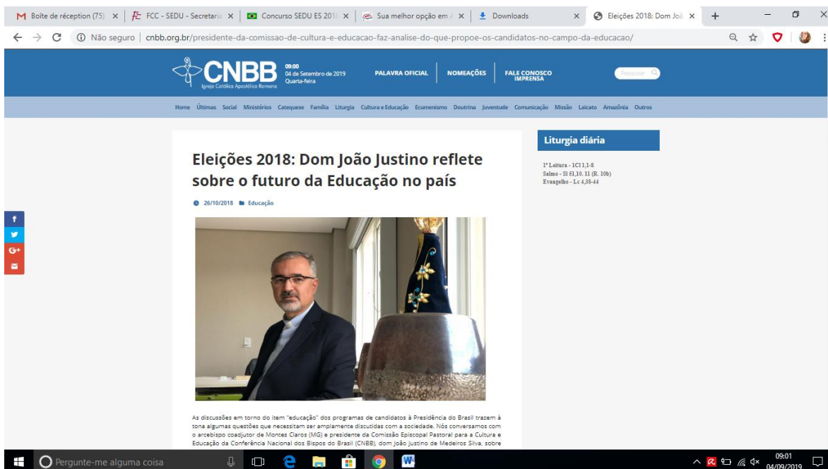
Figura 3 - Configuração da página da CNBB

apresentar ou não imagens. Vale ressaltar que essas geralmente cumprem o papel de fazer apenas uma referência ao que está sendo debatido no artigo, tendo função meramente ilustrativa. A seguir, podemos observar como é configurada a página.