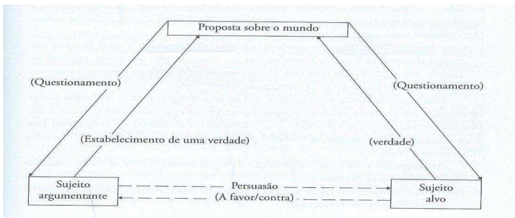
Figura 2 - O Contrato de Comunicação. (Charaudeau, 2010, p.205)

A partir dele, podemos perceber que para Charaudeau há três elementos essenciais na encenação argumentativa: o sujeito argumentante, uma proposta sobre o mundo e um sujeito alvo. O sujeito argumentante fará uma proposição sobre o mundo, um estabelecimento de uma verdade, que provocará um questionamento em alguém quanto à legitimidade da mesma, estabelecendo assim uma relação entre esses sujeitos.