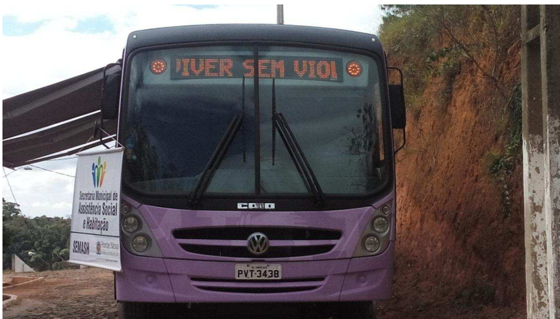
Figura 2.0 - Unidade Móvel de atendimento às Mulheres em Situação de Violência