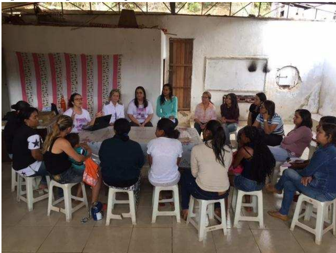
Figura 3.0 - Viagem ao município 4