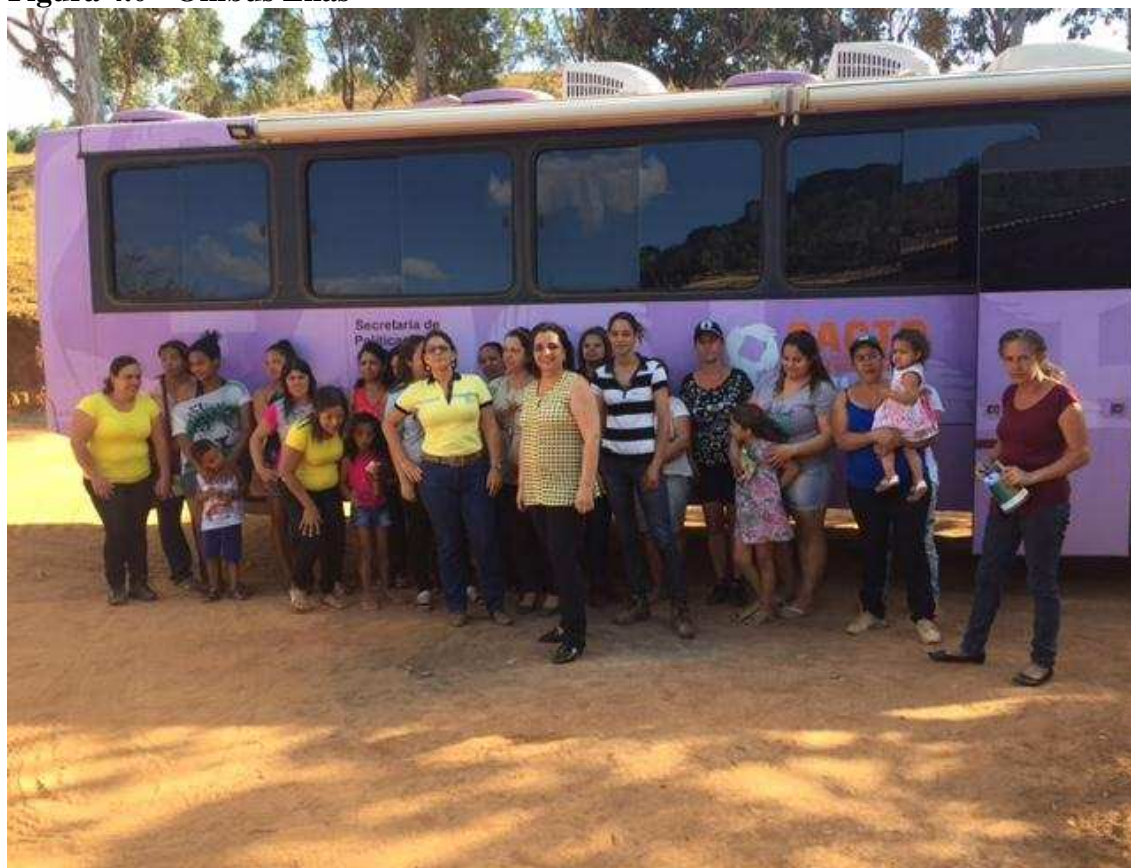
Figura 4.0 - Ônibus Lilás