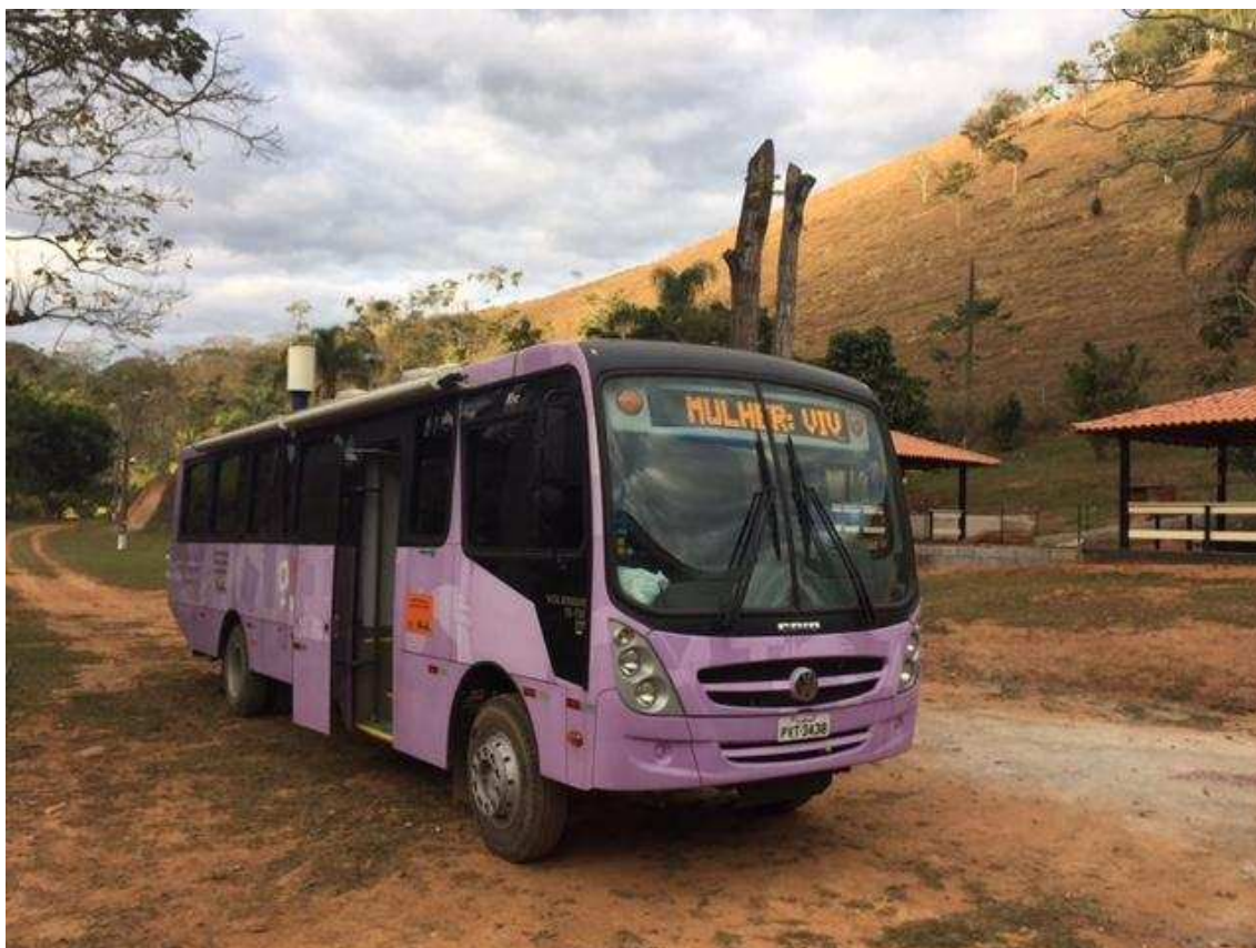
Figura 1.0 – Unidade Móvel de atendimento às Mulheres em Situação de Violência