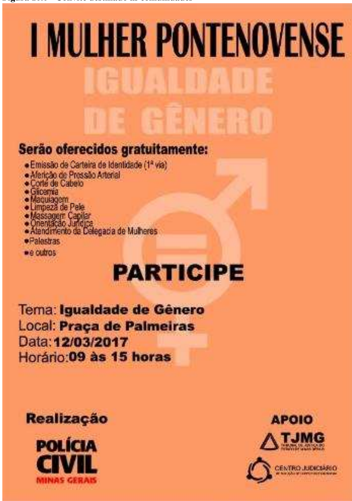
Figura 10.0 - Convite destinado as comunidades