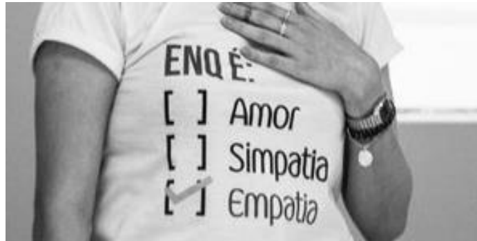
Figura 1. Instagram. Disponível em: https://www.instagram.com/p/BjBUOdoFq2u/

do outro. Assim, Catarina defendia a ideia de que quando um estudante faz um ato de compreensão e acolhimento e outros estudantes veem aquela ação, isto gera um sentimento de coletividade maior entre os discentes.