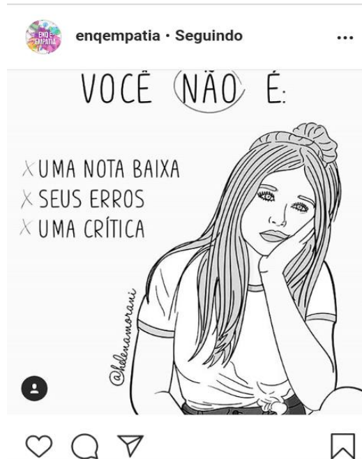
Figura 3. Instagram Disponível Em: https://www.instagram.com/P/Brtbzfrba_W/