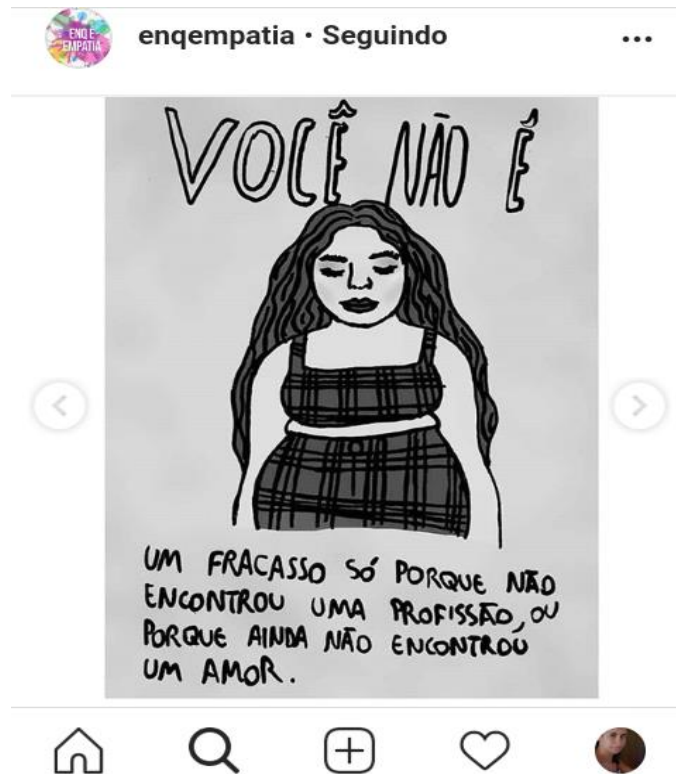
Figura 2. Instagram Disponível em: https://www.instagram.com/p/Bx2jp9hh7FG/