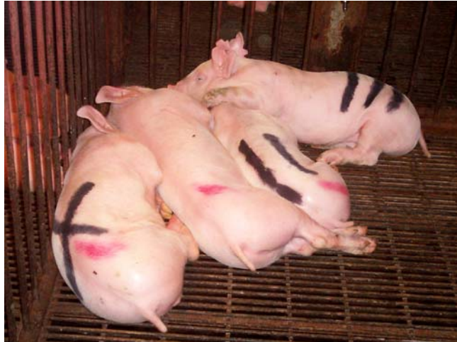
Figura 3 – Marcação individual realizada durante o período experimental durante o período experimental.

Os animais e as sobras de ração foram pesados ao desmame (início do experimento), aos 28 e aos 35 dias de idade.