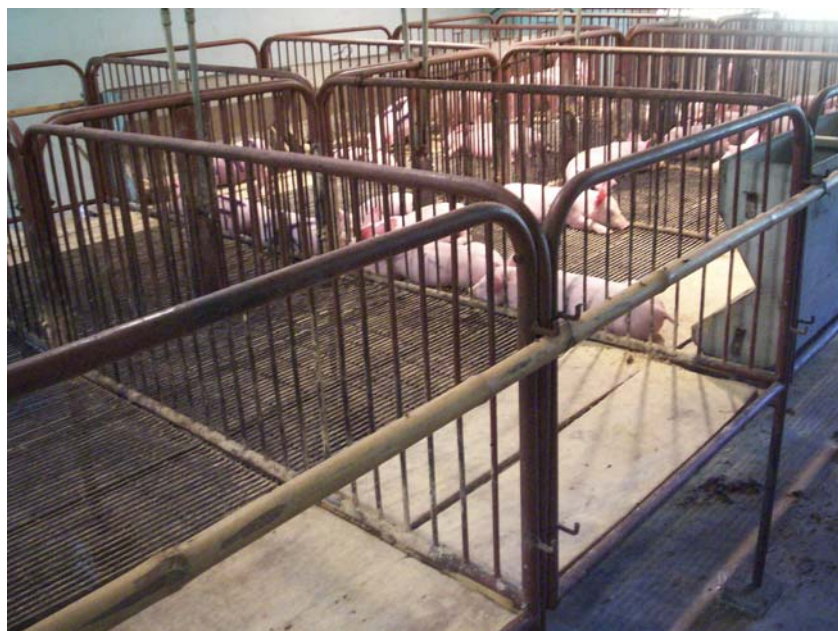
Figura 1 – Vista parcial da gaiola utilizada para a acomodação dos animais durante o período experimental.

de piso constituído de madeira e 1 m inteiramente vazado. As gaiolas foram de laterais gradeadas. O tipo de gaiola pode ser visualizado na figura 1.