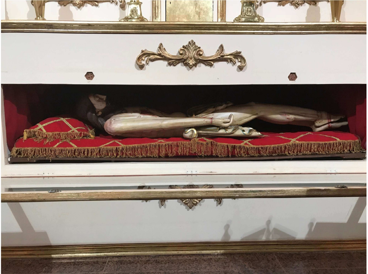
Imagem de Nosso Senhor Morto: 06 de abril de 2018.