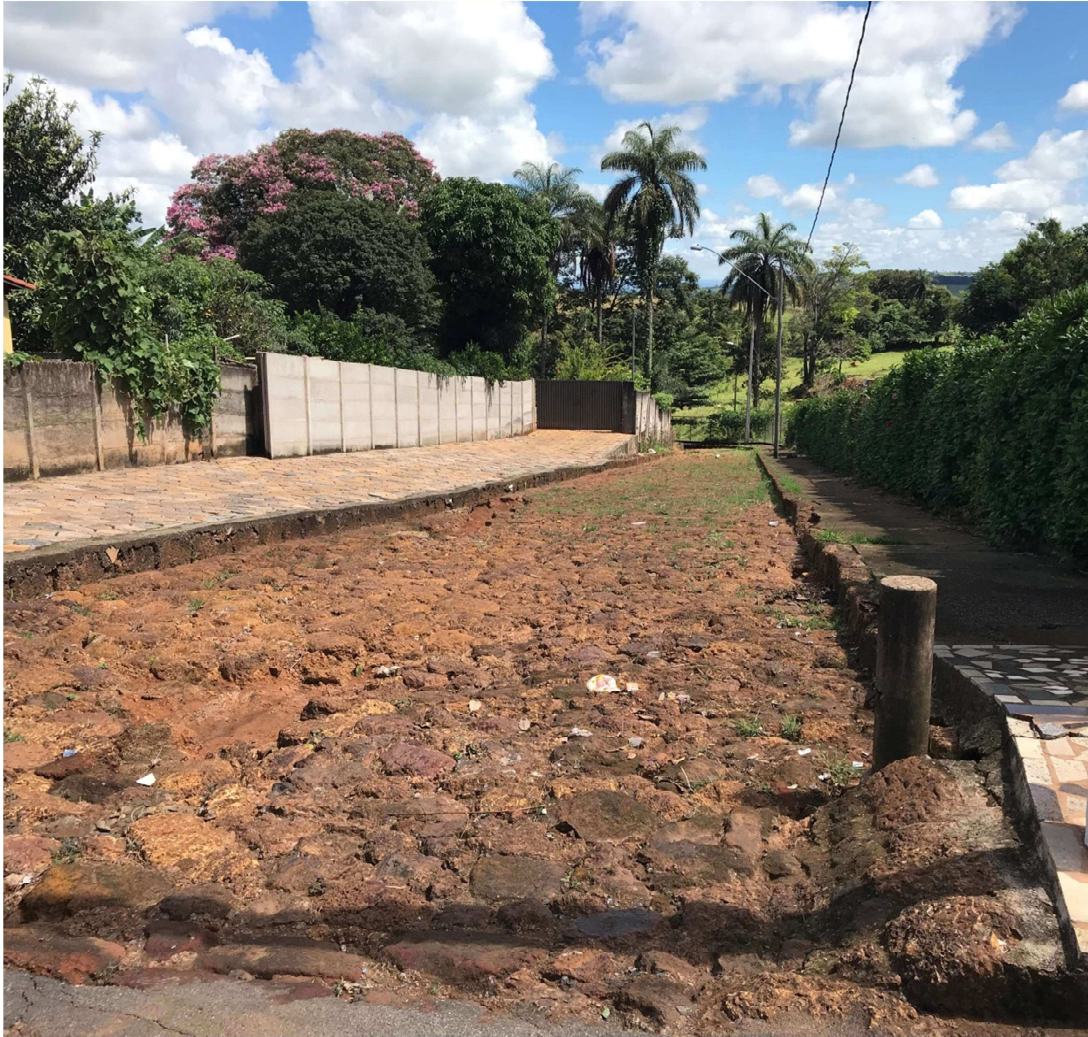
Rua calçada de pedra da Fonte do Mandioca: 05 de junho de 2018.