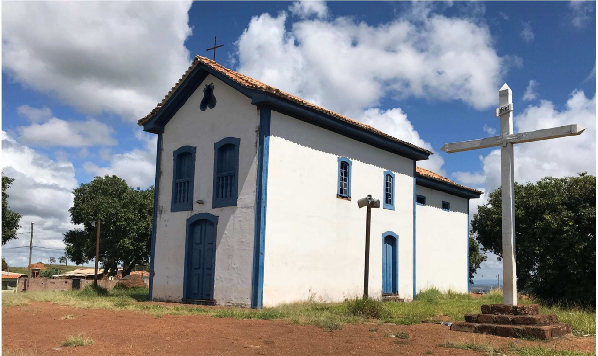
Capela de Santa Cruz do Monte: 05 de abril de 2018.