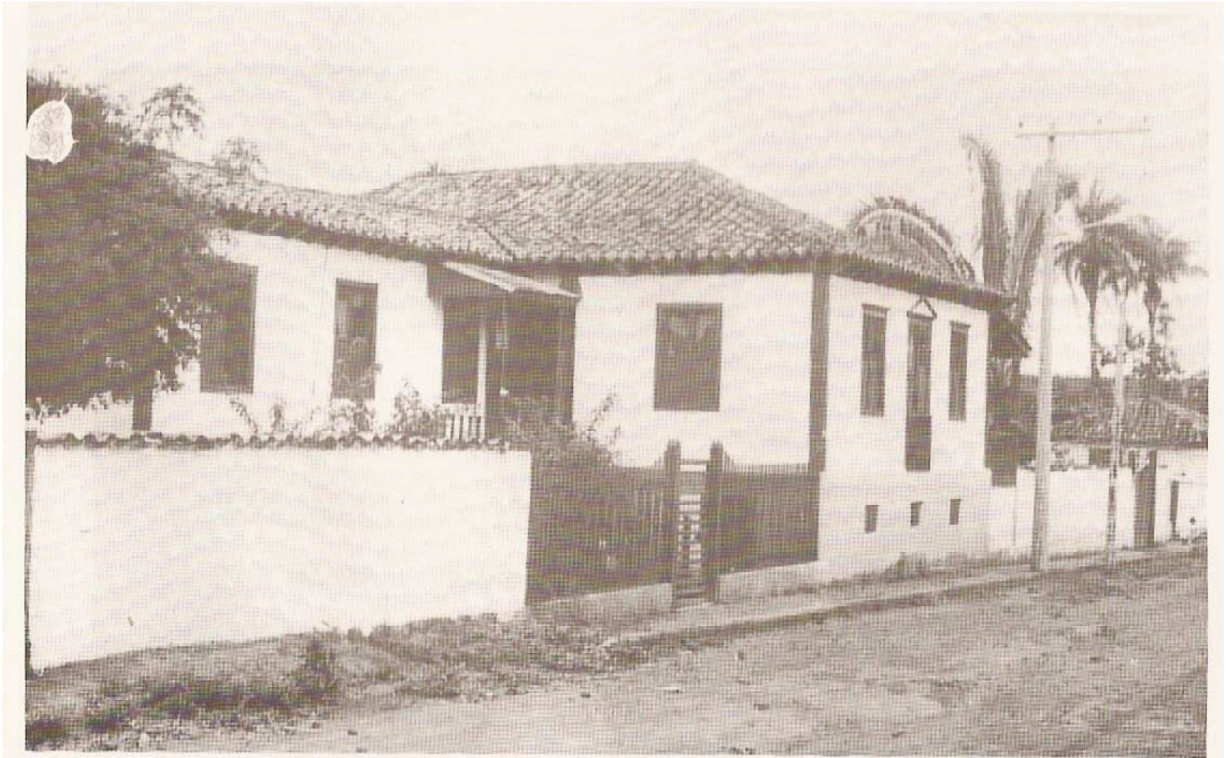
Primeira casa de Messina em Minas Gerais – Carmo do Paranaíba: 8 de fevereiro de 1936.