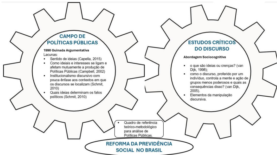
Figura 1 - Modelo Teórico Analítico.