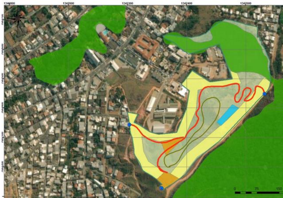
Perímetro do PNMCR.