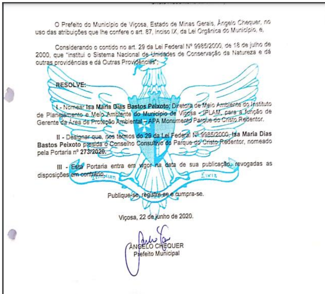
Figura 11 – Portaria nº 275/2020 – Nomeação da presidente do Conselho Consultivo do Parque do Cristo Redentor

A seguir, alguns exemplos de Portaria de nomeação e também de uma das Atas produzidas por esse Conselho.