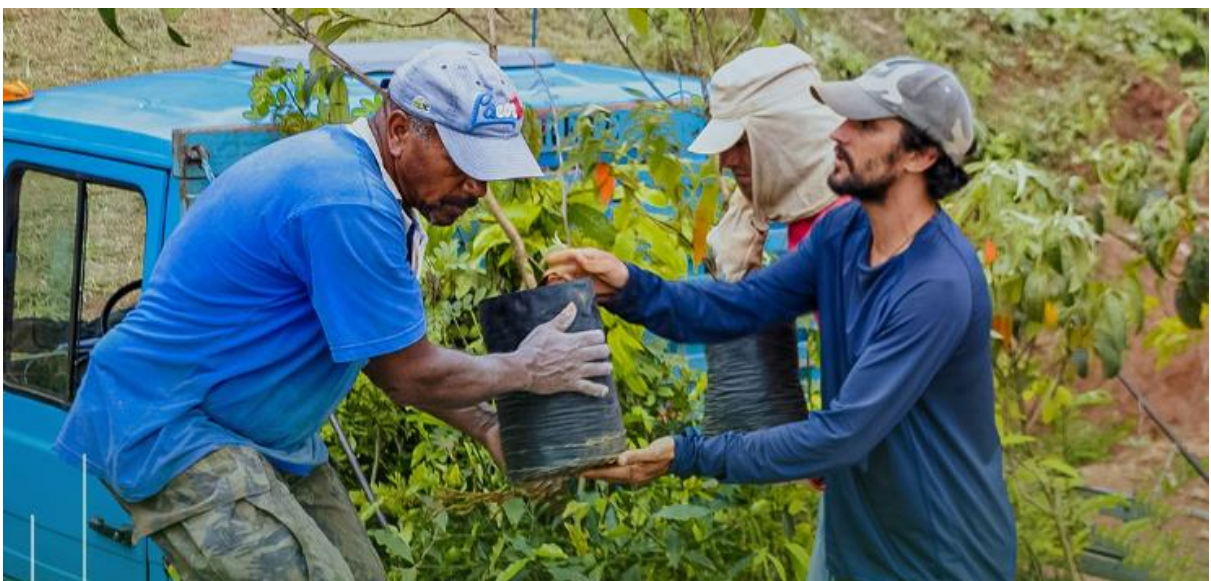
Figura 14 – Parque reflorestado com árvores da Mata Atlântica