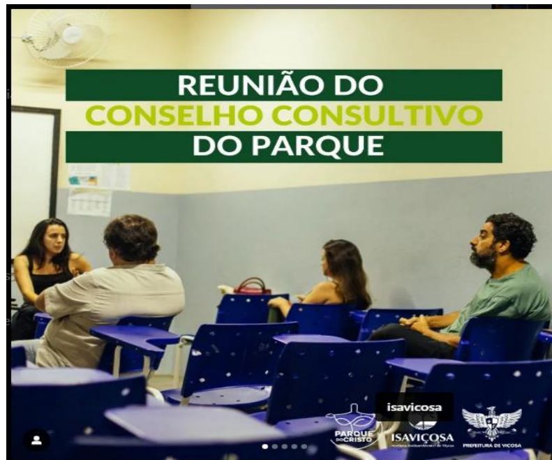
Figura 13 – Foto da Reunião do Conselho Consultivo do Parque