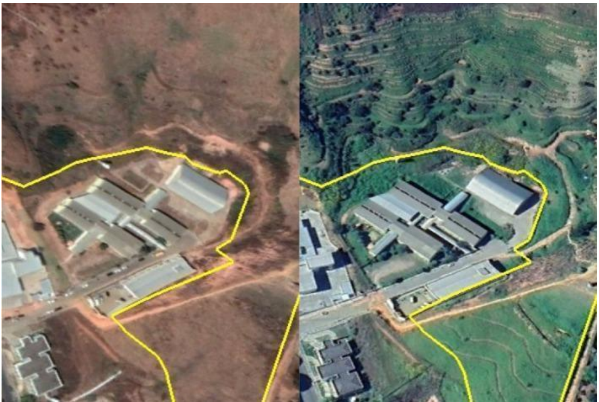
Figura 16 – Comparação de imagens de satélite mostra recuperação da vegetação do Parque do Cristo