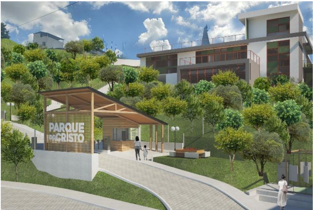
Figura 17 – Imagem do projeto arquitetônico do Parque do Cristo Redentor, portaria e sede administrativa

Ainda assim, é fundamental que o município incentive a captação de recursos externos, por meio de parcerias com instituições públicas, privadas e organizações não governamentais. A busca por financiamento via editais de preservação ambiental,