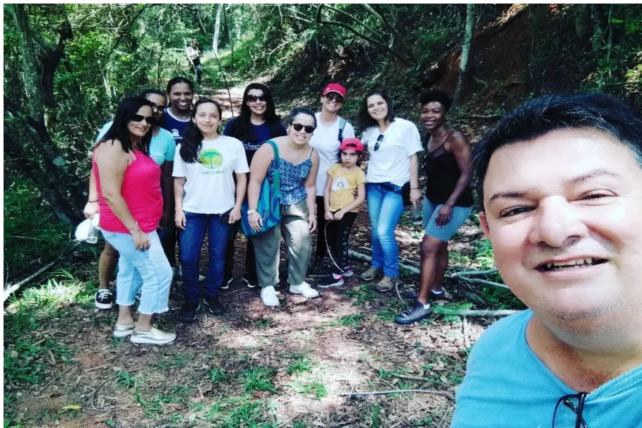
Figura 18 – Foto da visita guiada ao Parque do Cristo Redentor, em novembro de 2023