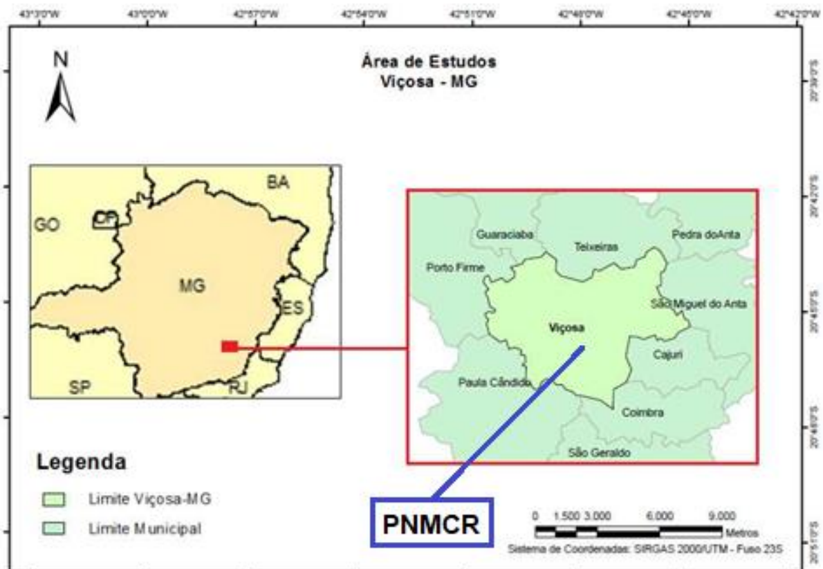
Figura 1 – Localização de Viçosa-MG; no recorte, a localização do PNMCR