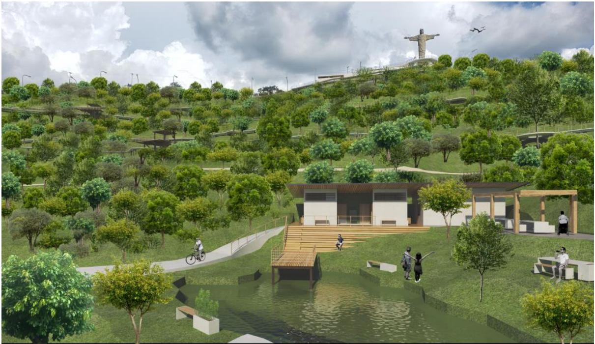
Figura 7 – Ilustração do Projeto Arquitetônico apresentado ao Conselho Consultivo do Parque do Cristo Redentor