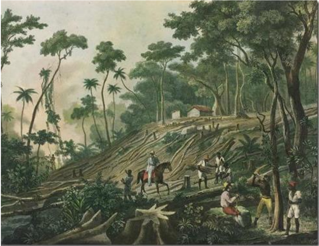
Figura 3 – Derrubada de uma floresta (Defrichement d'une Forêt), 1822-1825, Johann Moritz Rugendas ("Juan Maurício Rugendas", Pintor Academicista Alemão, 1802-1858), litografia sobre papel, 21,60 cm x 28,50 cm