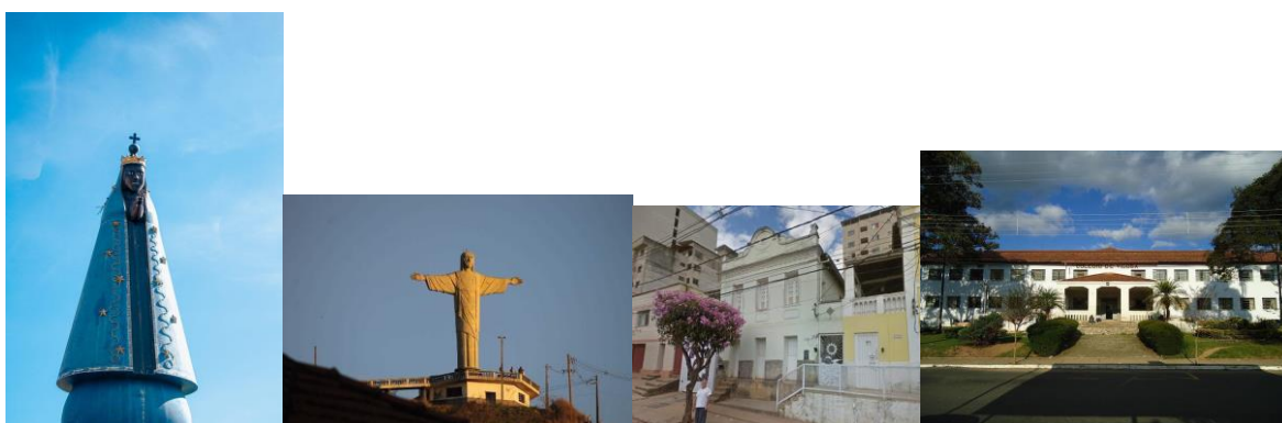
Figura 15 – Imagens do Parque do Cristo em contraste com as casas tombadas da Rua Gomes Barbosa e o Colégio de Viçosa

Traçando uma comparação entre a obra de Emily Wakild (2011) 21 , “Revolutionary Parks: Conservation, Social Justice, and Mexico's National Parks, 1910-1940” e a paisagem do Parque Natural Municipal do Cristo Redentor de Viçosa, MG, observam-se a intersecção entre planejamento e desenvolvimento gradual e a interação entre conservação ambiental e social. Ambos os contextos, ainda que distintos em termos históricos e geográficos, compartilham elementos comuns na maneira como os parques são moldados ao longo do tempo, seja por decisões políticas e sociais, seja por processos naturais e culturais. Vamos tentar, a seguir, comparar melhor esses contextos pela perspectiva do desenvolvimento gradual e orgânico: