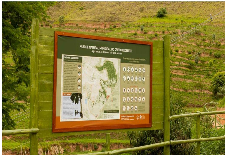
Figura 6 – Detalhe do mapa da área do PNMCR com uma das placas de sinalização dentro do Parque

No detalhe da próxima figura, podemos constatar uma das diversas placas de sinalização instaladas no perímetro do PNMCR.