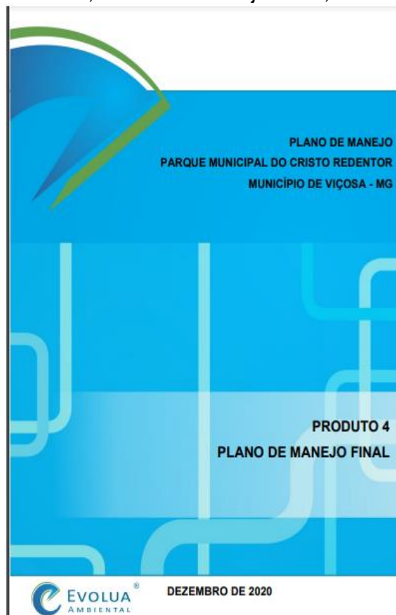
Figura 10 – Capa do produto 4, Plano de Manejo Final, dezembro de 2020.

(Jornal Folha da Mata-Parque do Cristo: Plano de Manejo ainda indefinido).