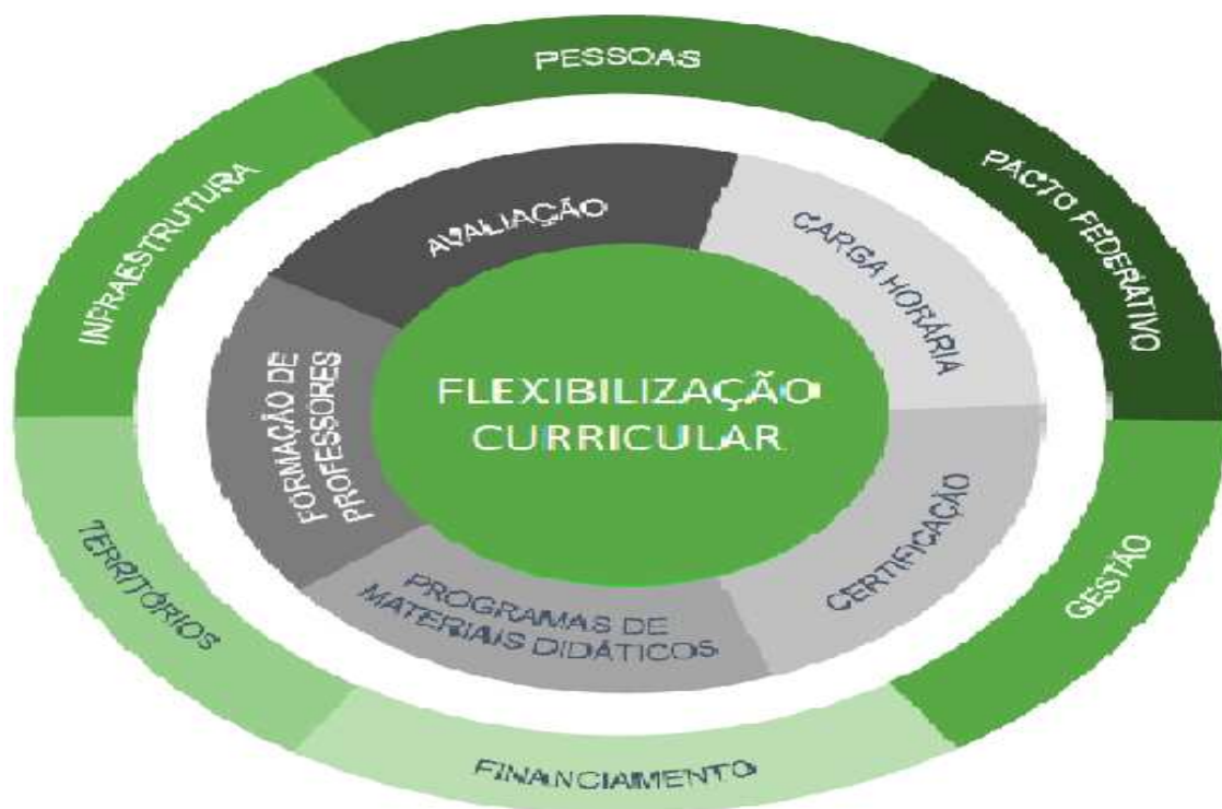
Figura 01: Dimensões que precisam ser reorganizadas para a flexibilização curricular.

Henriques, do instituto Unibanco, mostra uma série de dados estatísticos históricos que demonstram a necessidade de reforma do ensino médio, como a quantidade de alunos que adentram na educação básica e a quantidade que passam para o ensino médio e, posteriormente, para a educação superior, mostrando a significativa evasão que existe. Porém, como forma de resolver a questão, o documento aponta para a flexibilização do ensino como solução, que teria como estrutura a figura abaixo.