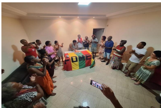
Figura 2 - Participação da diretoria do grupo Ganga Zumba na reunião do Fórum Mineiro De Entidades Negras – FOMENE.