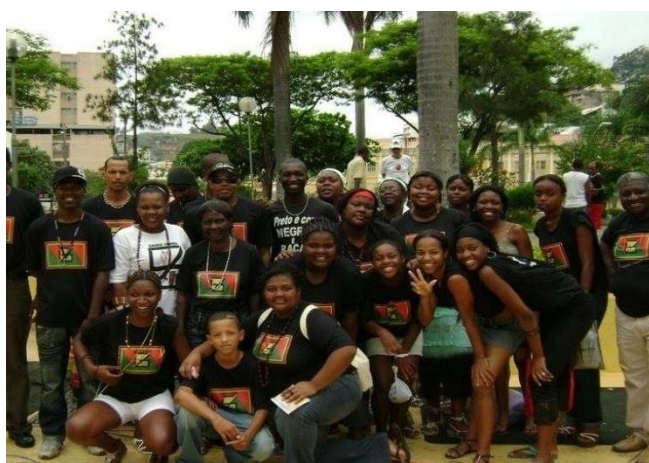
Figura 1- O grupo Ganga Zumba reunido em Ponte Nova- Minas Gerais.

Assim iniciou o meu processo de educação para as relações raciais no coração da Comunidade do Bairro de Fátima, na Casa Afra Ganga Zumba. Fui me envolvendo com as atividades, conselhos, presidências de conselhos municipais, participação em fórum e conferências. Todas as atividades políticas e sociais me direcionaram para as lutas, “o movimento negro me educa e educou” (Gomes, 2017, p.13).