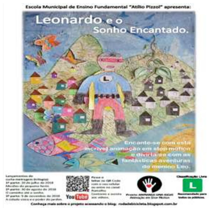
Figura 8: Cartaz de animação- stop motion: Leonardo e o sonho encantado