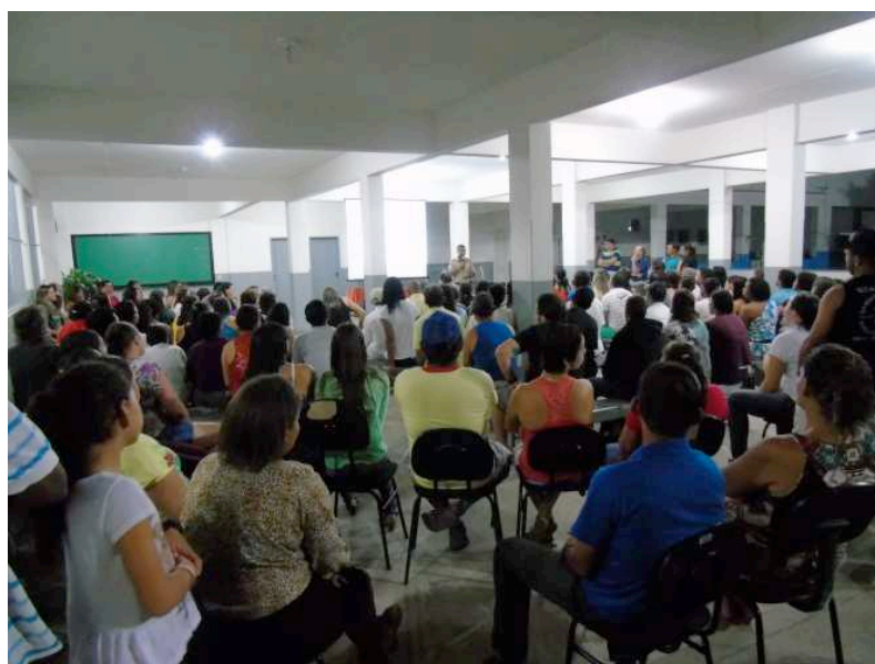
Figura 4: Momento pedagógico