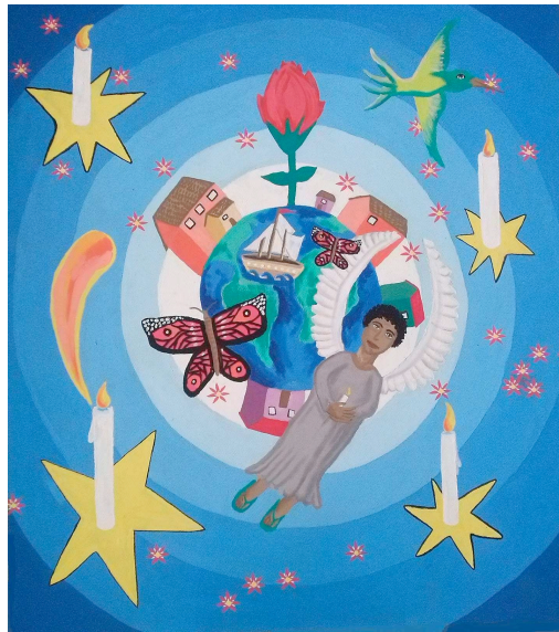
Figura 9: Quadro pintado pelas turmas de sexto ano no projeto de onde vem as ideias