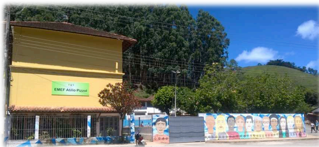
Figura 1: Fachada da escola