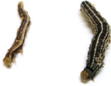
Figura 1. Lagartas de mesma idade originadas de ovos tratados com extrato de astilbina de flores de D. mollis (esquerda) ou etanol absoluto (direita) com aplicação tópica sobre grupos de ovos de Anticarsia gemmatalis (Lepidoptera: Noctuidae).