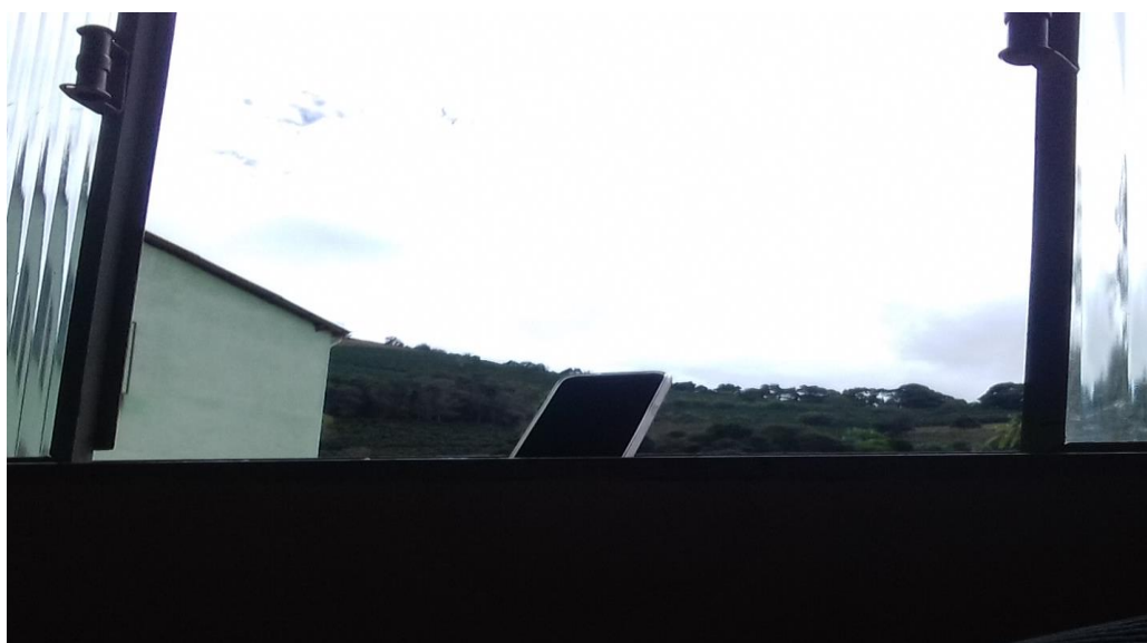
Figura 2: Aparelho celular fica exposto na janela da sala de aula do 2º ano na EFA Puris para conectar a internet.

O acesso à internet e ao telefone móvel na EFA Puris também acontece de modo precário. Para minimizar os problemas, os alunos desenvolveram algumas estratégias. Eles localizaram os pontos aonde chega o sinal da operadora Vivo que são: a janela da sala de aula (figura 2); a garagem embaixo do dormitório masculino e um ponto na área de socialização onde são feitas algumas refeições.