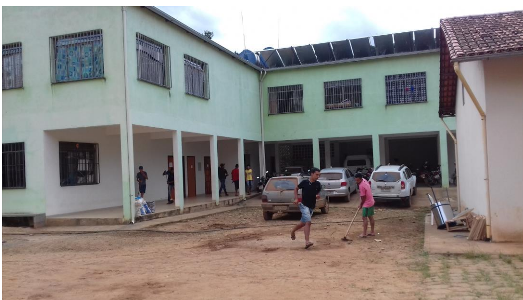
Figura 1: Alunos realizam a limpeza da área externa da Escola Família Agrícola Puris, em Araponga/MG.