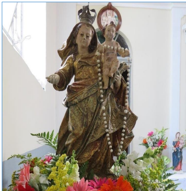
Figura 20 – Imagem de Nossa Senhora do Rosário.