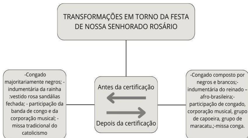
Figura 8 – Modificações na festa de Nossa Senhora do Rosário antes e depois da certificação.