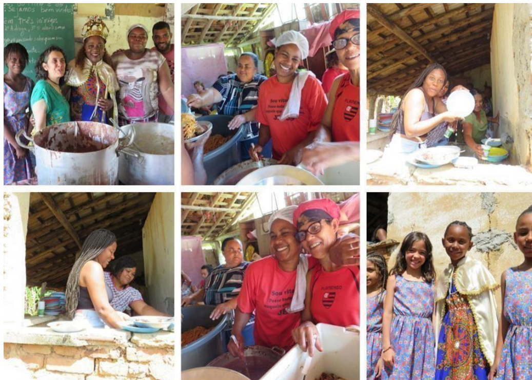
Figura 22 – Diálogos na cozinha.