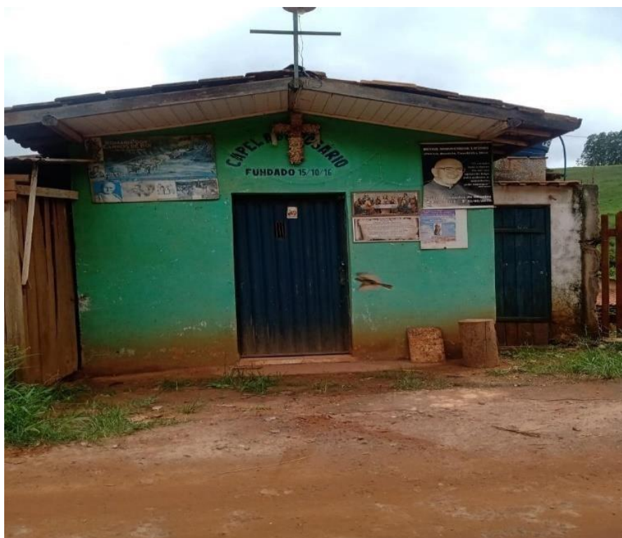
Figura 12 – Capelinha de Nossa Senhora do Rosário do Quilombo Córrego do Meio