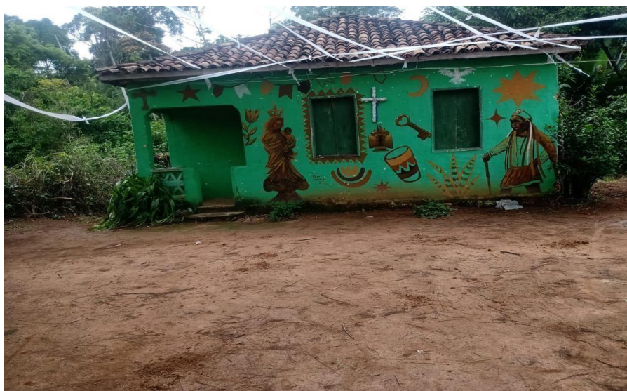
Figura 7 – Casebre Cultura, situado no Quilombo do Córrego do Meio.