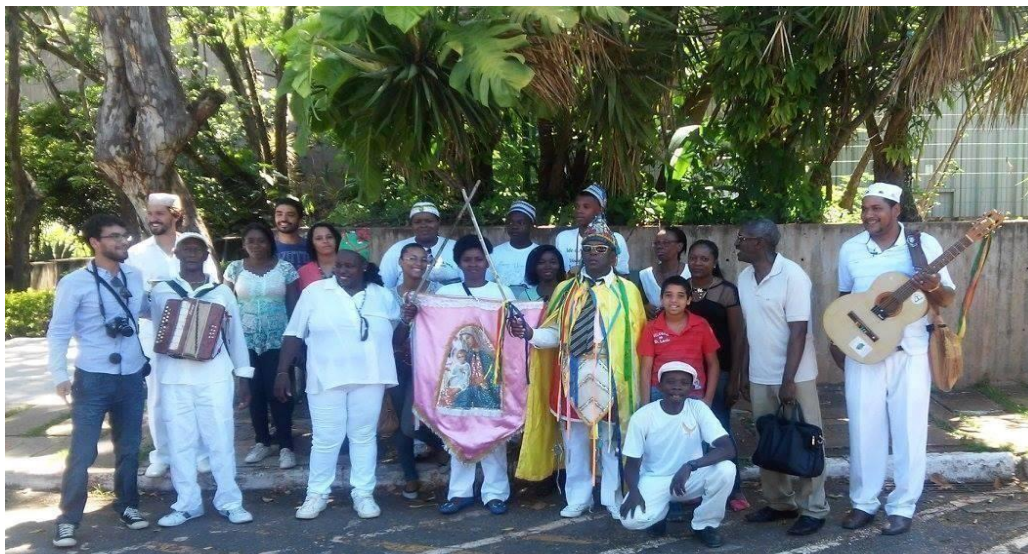
Figura 4 – Visita a FCP em 2015 afim de levar documentos necessários para certificação.