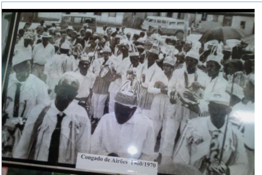
Figura 2 – Congado de Airões