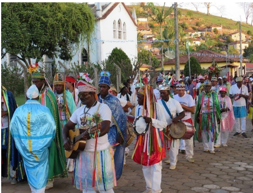
Figura 9 – Composição do Congado no dia da festa.