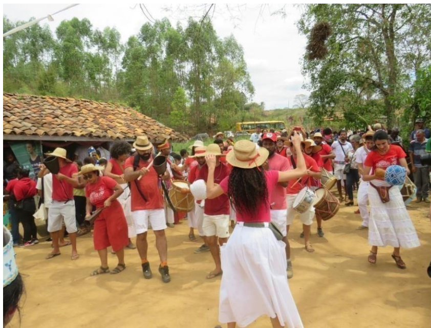
Figura 10 – Participação do grupo de maracatu O BLOCO no dia do festejo.