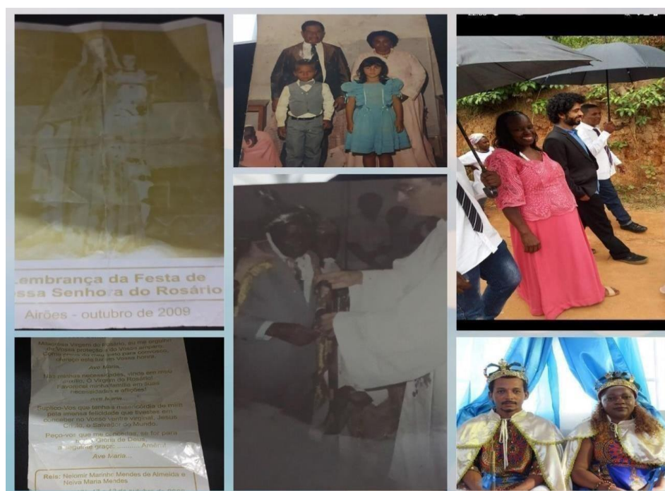
Figura 1 – Panfleto com a oração a Nossa Senhora do Rosário; Reinados em suas diferentes épocas.

história desses santos, é possível perceber que Ifigênia, ou Efigênia, era filha dos reis da Núbia, uma região da Etiópia. Já São Benedito era da Itália, mas seus pais eram escravos, nascidos também na África. É clara a relação entre a realidade desses santos e a realidade dos congadeiros, sejam os de hoje ou os de 1853, com algumas ressalvas. A ligação com Nossa Senhora do Rosário é diferente, pois não se trata de identidade étnica; a relação é de devoção. De acordo com a história que se conta, foram os congadeiros que resgataram a santa de um rio ou de uma mata tocando seus tambores, depois de muitas outras tentativas frustradas por parte dos brancos de colocá-la em uma capela.