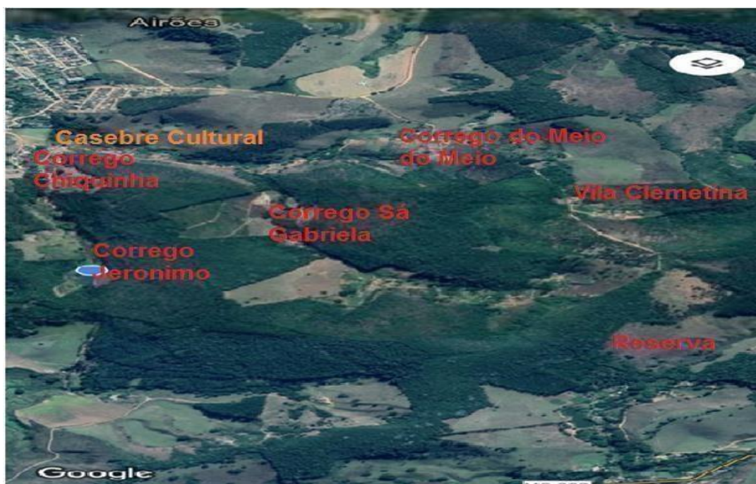
Figura 3 – Comunidade Quilombola do Córrego do Meio - Dimensão familiar-parental