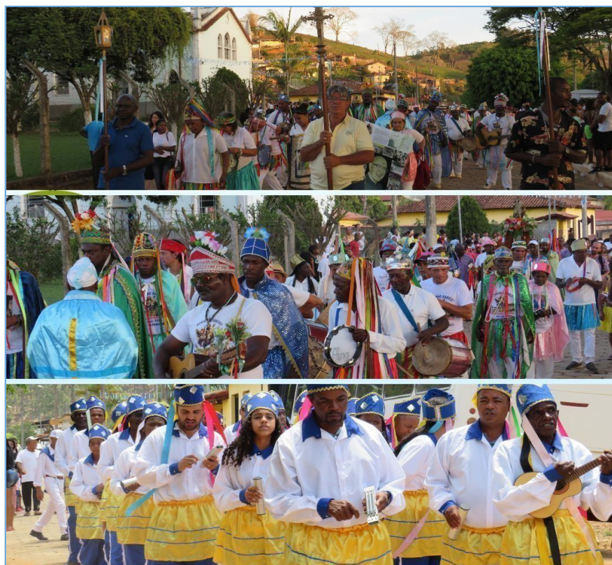
Figura 19 – Procissão do dia do festejo após a missa.