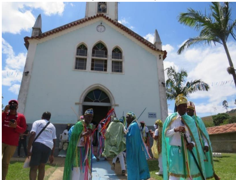
Figura 11 – Igreja de Nossa Senhora das Dores (Airões) e o grupo de congado no dia do festejo