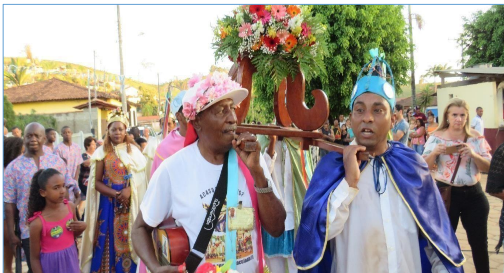
Figura 16 – Membros do congado carregando o andor com imagem de Nossa Senhora do Rosário