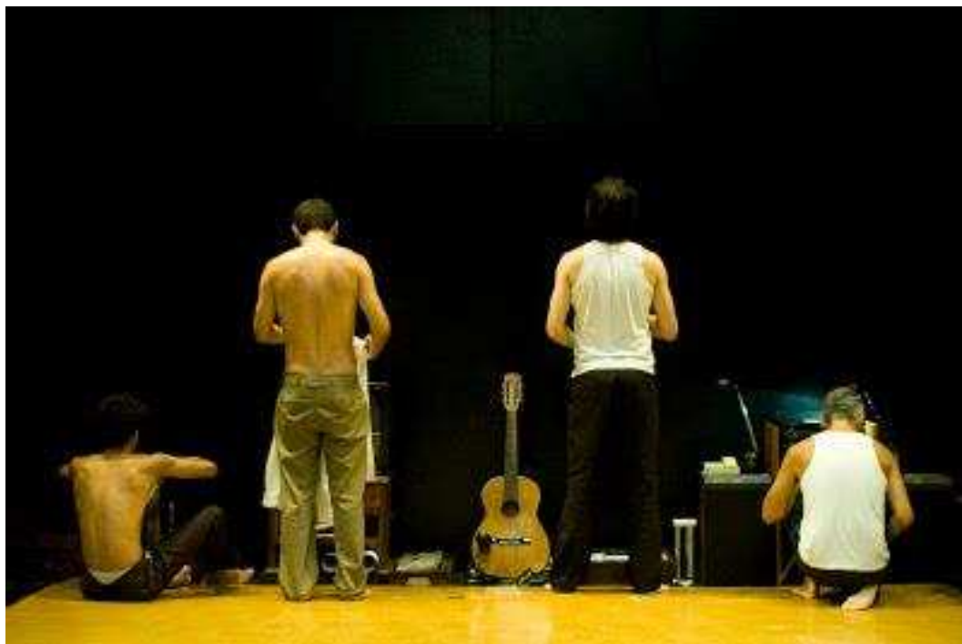
Figura 2- "Aqueles dois" - Luna Lunera

Um outro exemplo, que causa um estranhamento no espectador, está em Dogville (2003), filme dirigido por Lars Von Trier. A organização espacial peculiar também demonstra o método da simultaneidade de maneira clara, podendo ser considerada uma inovação estética no cinema, quando transpõe em maior escala um recurso frequentemente observado no teatro. O cenário é apenas dividido por marcações baixas e as paredes se tornam invisíveis somente para o espectador, não para a personagem.