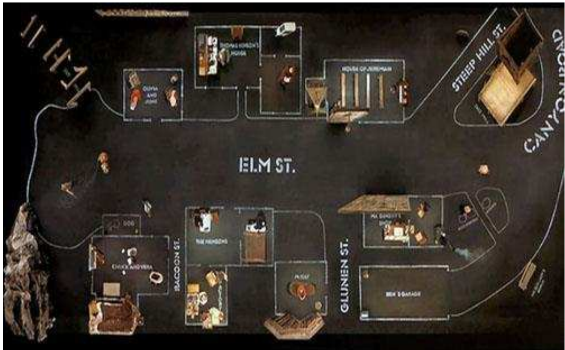
Figura 3 - Cenário de "Dogville", dirigido por Lars Von Trier

Considerando o romance de Rosa, notamos que o processo analisado por Joseph Frank pode ser percebido, respeitando as peculiaridades dessa obra, reiterando a ideia/forma inerente a essa narrativa. Assim como na análise proposta por Frank, em Grande sertão a espacialização do tempo ocorre tentativa de apreender tempos distintos num fluxo simultâneo. Porém, pela limitação do signo, essa busca não fica evidente num primeiro instante, mas precisa ser percebido pelo todo. O romance pode ser dividido em dois momentos estruturais que se limitam aproximadamente na metade da obra. Essas partes tem ação reflexiva, quando os cortes temporais aleatórios entre enredos não lineares na primeira parte complementam o que, num segundo momento, segue um certo fio que tem como protagonista Riobaldo e sua ascensão como chefe jagunço.