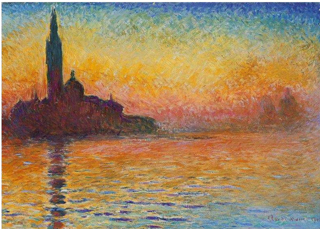
Figura 4 - Claude Monet, Saint-Georges Majeur au crépuscule, 1908.

Os Impressionistas, ao deixarem o ateliê para pintarem a natureza ao ar livre, passam a dissolver a figuração, o naturalismo, os contornos bem definidos encontrados na arte até então. A arte objetiva é substituída por uma arte de impressões visuais, que valoriza os objetos imersos em luminosidade e cores, característico de um ambiente aberto e sujeito a mudanças visuais (GULLAR, 1960).