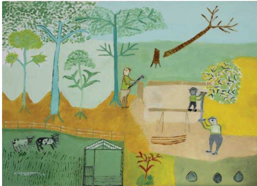
Figura 5 - Neves Torres – Sem título, 2011.