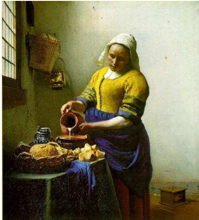
Figura 1: Johannes Vermeer, A leiteira, 1658.

naturalista da consciência. Os choques naturais ocorrem sempre de forma totalmente diferente. Há nisto a mão ordenadora do escritor, que compendia de forma fechada a confusão do conteúdo interno e o dirige no sentido em que ele próprio avança: na direção ‘repugnância diante de Charles Bovary’. Esta ordenação do conteúdo interno evidentemente não recebe as suas escalas de fora, mas do próprio material de que se constitui. É posto em ordem aquilo que deve ser empregado para que o próprio conteúdo se transforme em linguagem, sem mistura alguma (AUERBACH, 2004, p.434).