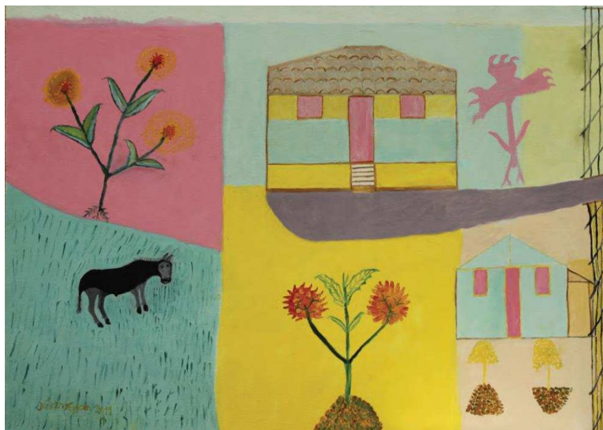
Figura 6 - Neves Torres – Sem título, 2011.

Desse modo, podemos traçar semelhanças entre a arte de Neves Torres e o narrador Riobaldo, pois os dois são exemplos (ficcionais ou não) de pessoas simples que carregam um conhecimento ligado às experiências. Como Neves Torres, o narrador tem um vínculo com a memória e ao narrar os espaços, temos a sensação de que fala de um lugar inexistente, apesar das constantes referências ao cenário do sertão mineiro. O narrador se deixa guiar pelas sensações trazidas pela lembrança, influenciando a descrição do espaço narrado.