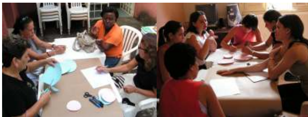
Figura 1: Construção dos Diagramas de Venn nos grupos de 2005 e 2006.

A construção dos Diagramas de Venn foi feita em grupos divididos de acordo com o ano de realização do curso. A montagem dos diagramas nos grupos (Figura 1) desenvolveu-se com muita discussão, pois além de resgatar os conteúdos trabalhados em suas práticas pedagógicas, as participantes os relacionaram com o tema Solos (círculo central) e fizeram a relação entre os próprios conteúdos levantados.