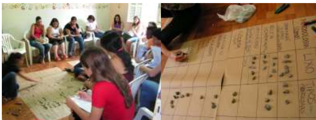
Figura 3: Aspectos da construção da matriz de conteúdos e métodos realizada em plenária pelas educadoras que participaram dos cursos de capacitação.

Com os métodos de abordagem registrados nas linhas da matriz em cada célula resultante do cruzamento de um conteúdo (coluna) foi registrado o número de educadoras que os utilizaram em suas práticas. A matriz resultante (Quadro 7) permitiu a pronta visualização dos métodos mais utilizados pelas professoras e sua relação com os conteúdos relacionados ao tema solos.