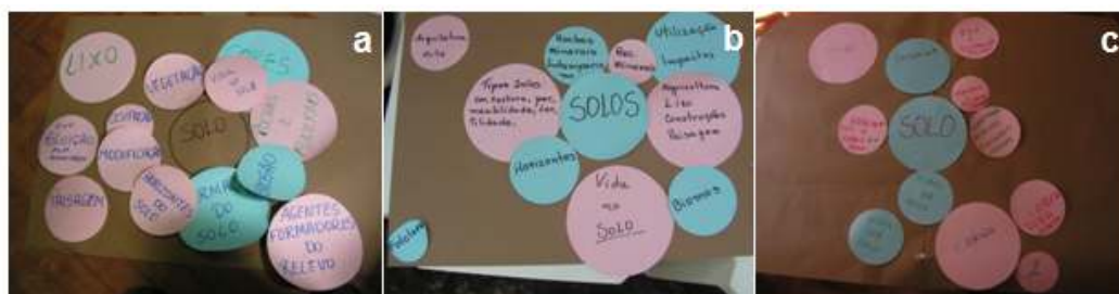
Figura 2: Aspecto dos Diagramas de Venn construídos pelos grupos de participantes dos cursos de capacitação dos anos de 2004 (a), 2005 (b) e 2006 (c), respectivamente.

As educadoras identificaram os conteúdos trabalhados em suas práticas individualmente, e através de discussões buscaram um consenso das relações entre os conteúdos e entre estes com o tema solos. Assim, foram construídos três Diagramas de Venn (Figura 2), onde foi possível perceber a influência dos cursos de capacitação no conjunto amplo e diversificado de conteúdos muito ou pouco relacionados ao tema solos em suas práticas pedagógicas.